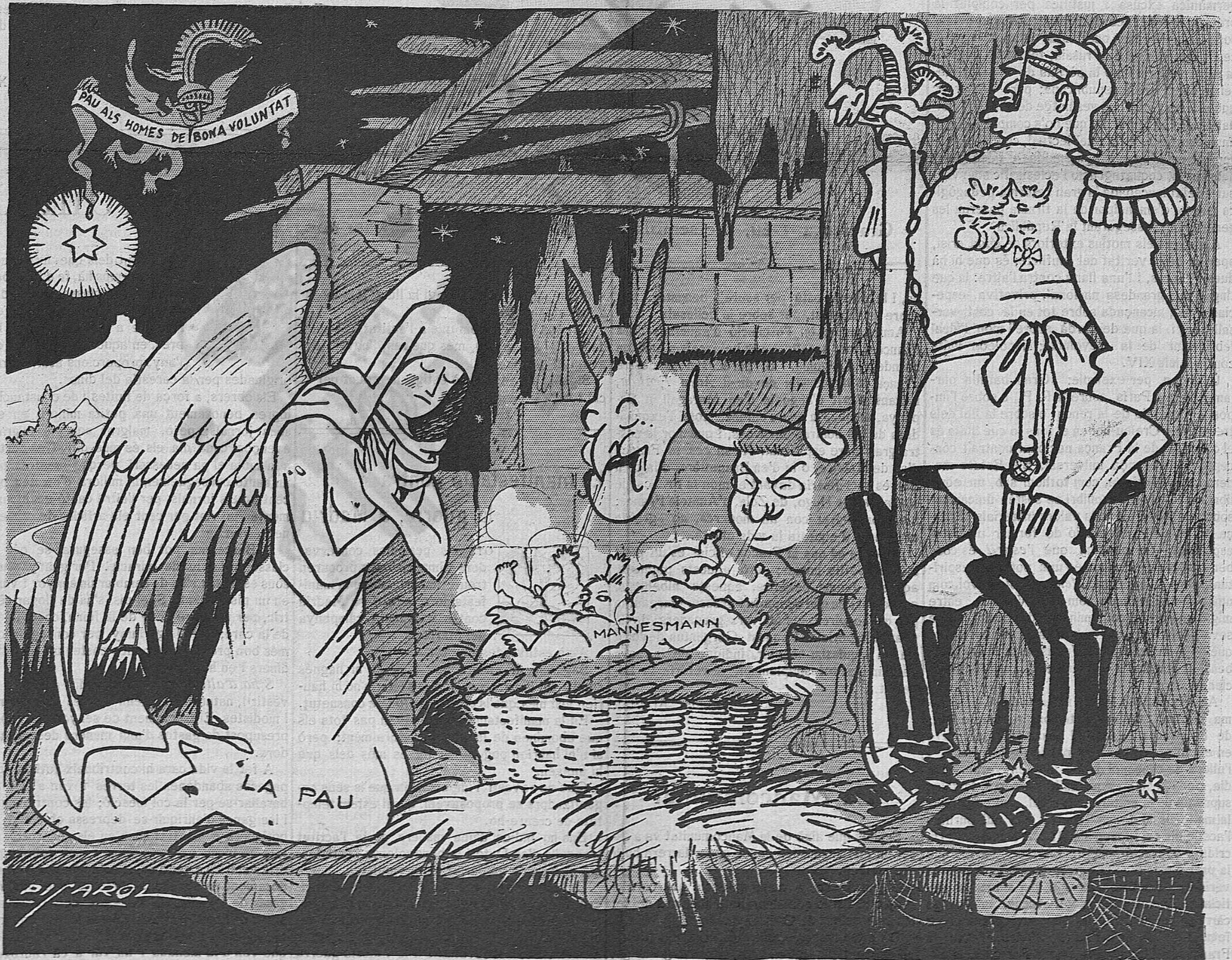
Aquest any ha sigut bessonada