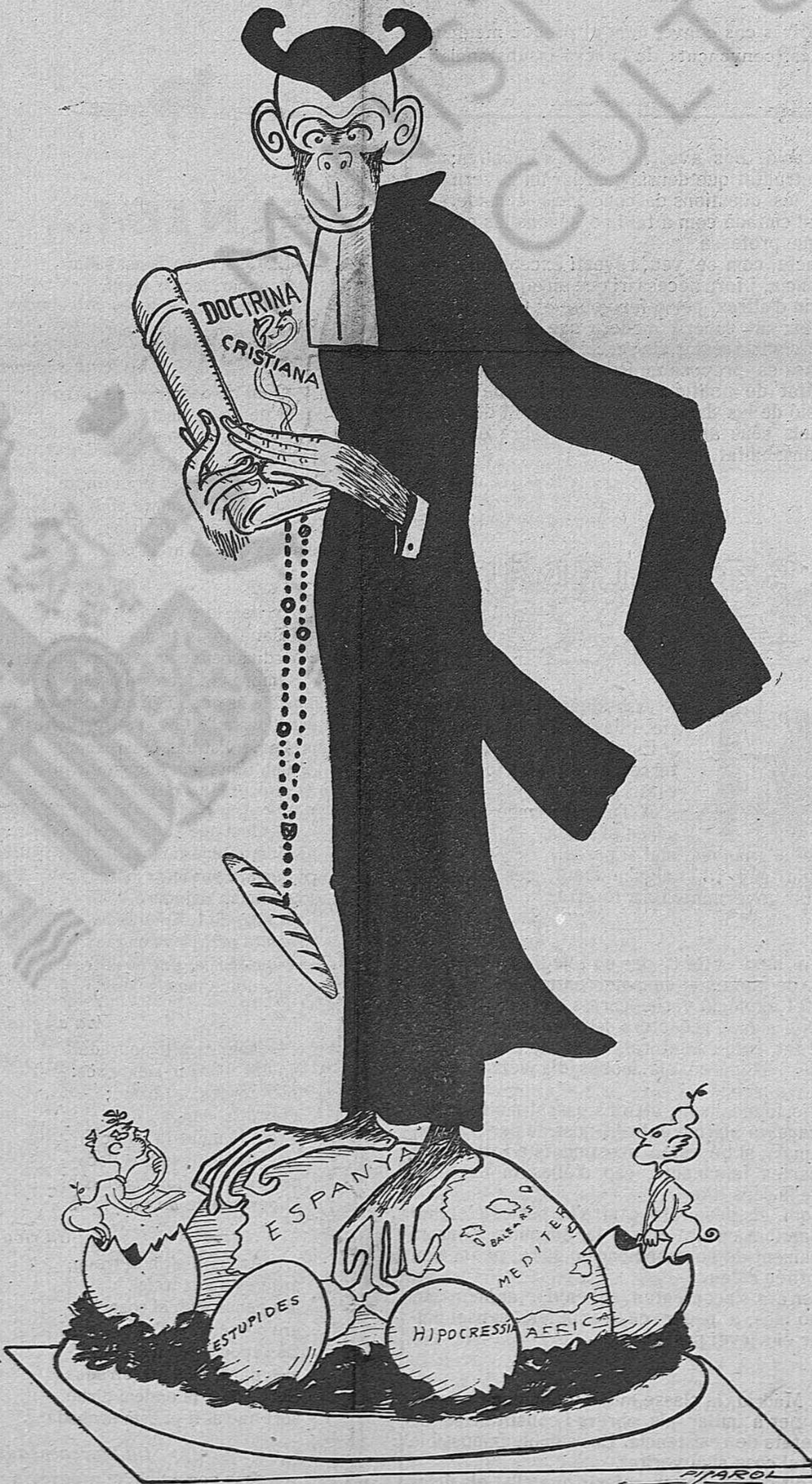
La mona d'aquest any.

El pa ha sofert un considerable augment de preu, en moltes localitats. Aquest és el veritable dissabte de Gloria: Nostre Senyor al cel, i el pa... als núvols. Una resurrecció completa!