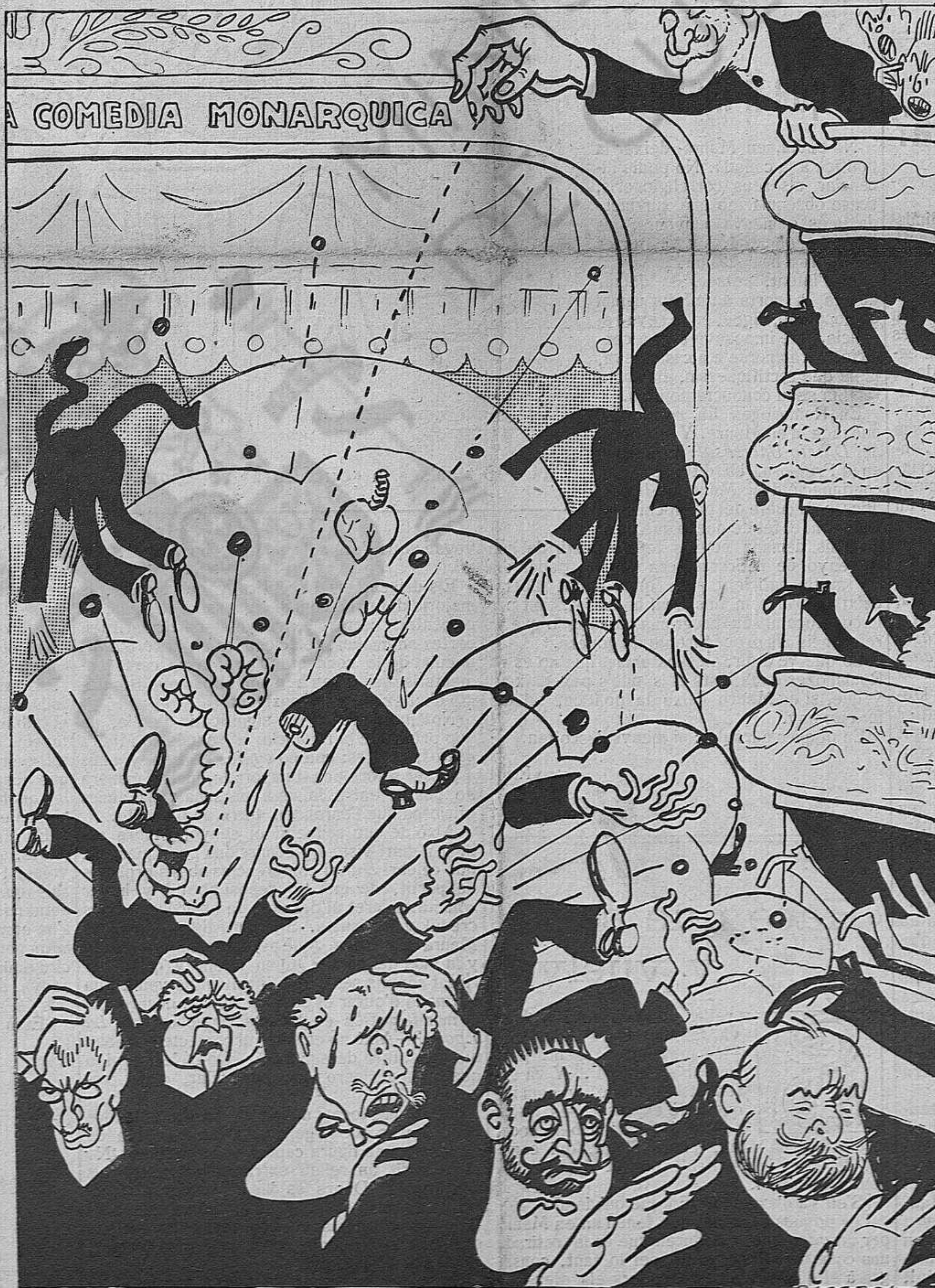
«La bomba de la retirada.... o la Revolución desde arriba».

compte exacte de l'impressió que ha de causar a l'extranger aqueixa retirada.—Es el triomf de la Conjunció socialista-republicana,— se diu, y nosaltres, els que hem contribuït a l'obra gloriosa, recabem avui la part en el futur agraïment. Però també cal dir que es la victòria de l'esperit europeu, que es un acte de contrició y esmena, que es una incorporació de Espanya a Europa, que es l'eficàcia d'aquella intervenció esperitual y solidaria de totes les intel·lectualitats mundials, sobre el trist ambient dels homes desterrats avui de la governació que convertiren en tirania. A vosaltres, estol selecte dels Anatole France, dels Jaurès, dels Gorki, dels D'Annunzio, dels Maeterlinck, vagi avui aquest immens desagravi. Nosaltres tinguerem la gloria de compartir ab vosaltres el vituperi dels inconcients, dels indignes o dels febles; deixeuos compartir avui la satisfacció de les nobles revenges.