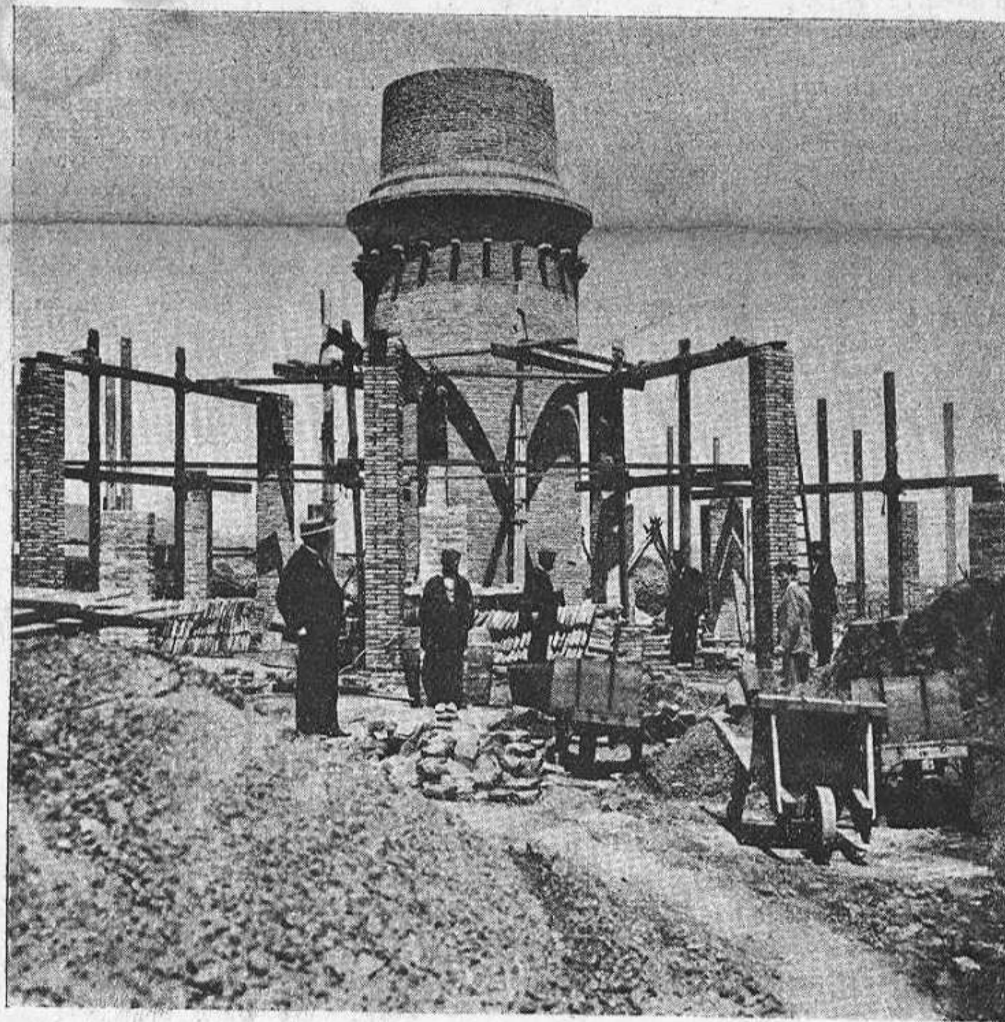
La nova Bóvila de Coll-blanch.