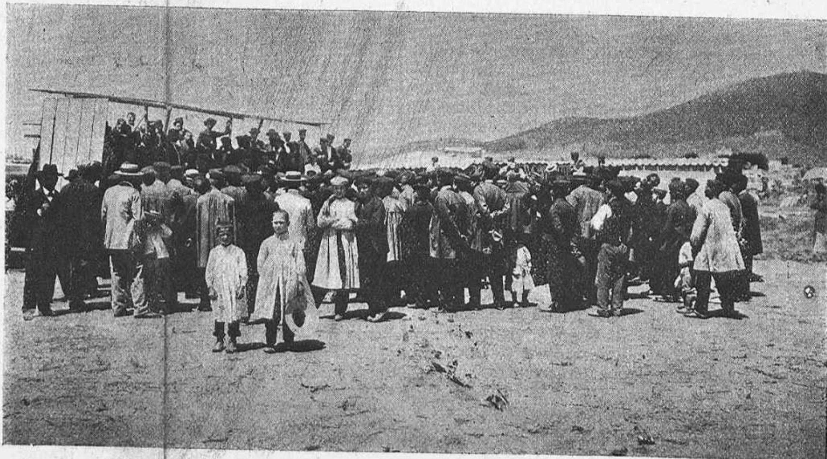
Las festas de l' inauguració.—Meeting en las inmediacions de la Bóvila.

La victoria més completa havia de coronar los seus esfoisos. Avuy la Cooperativa conta ab 445 associats; el negoci 'ls marxa admirablement; fins ara han pogut fer cara á totes las crisis, y ab lo séu exemple han adquirit una gran forsa moral tots los treballadors del ofici, en lo Plá de Barcelona. No falta qui preveu, que dintre de poch no hi haurá aquí un sol operari rajoler que no siga cooperatiu. Molt els hi ajudarà l' índole de aquesta producció, qual valor principal está representat per la má d' obra.