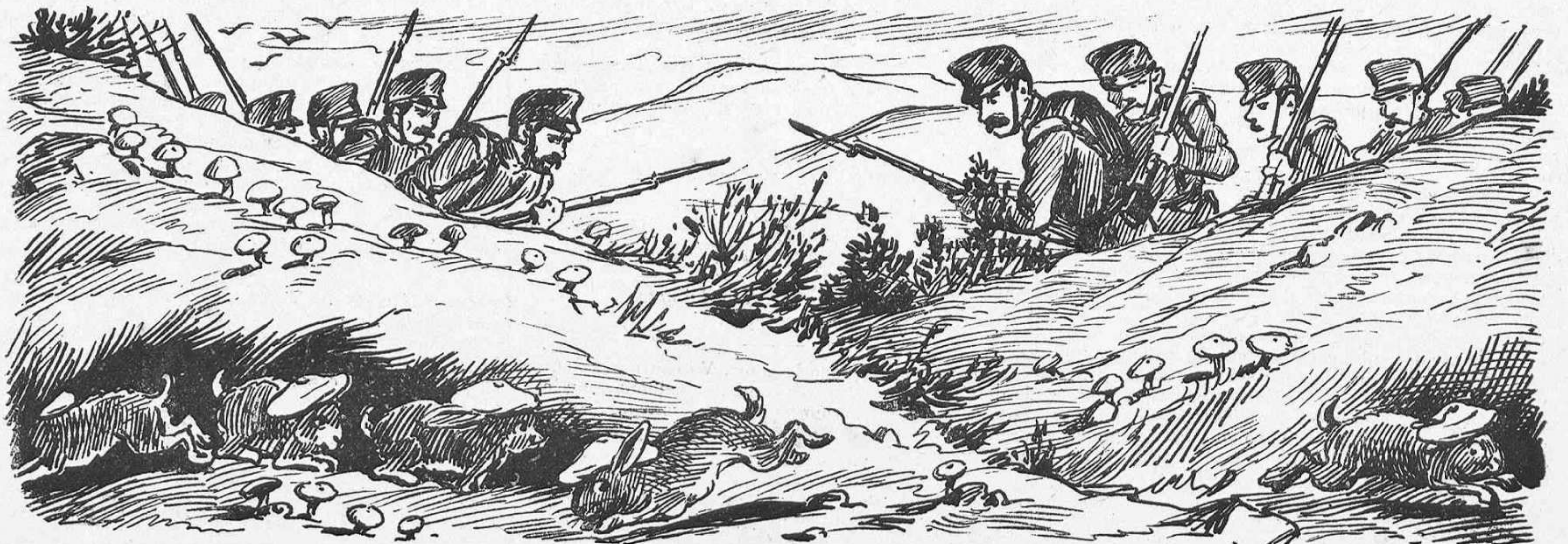
—Al primer que surti del cau, ¡foch!... Es el millor sistema.