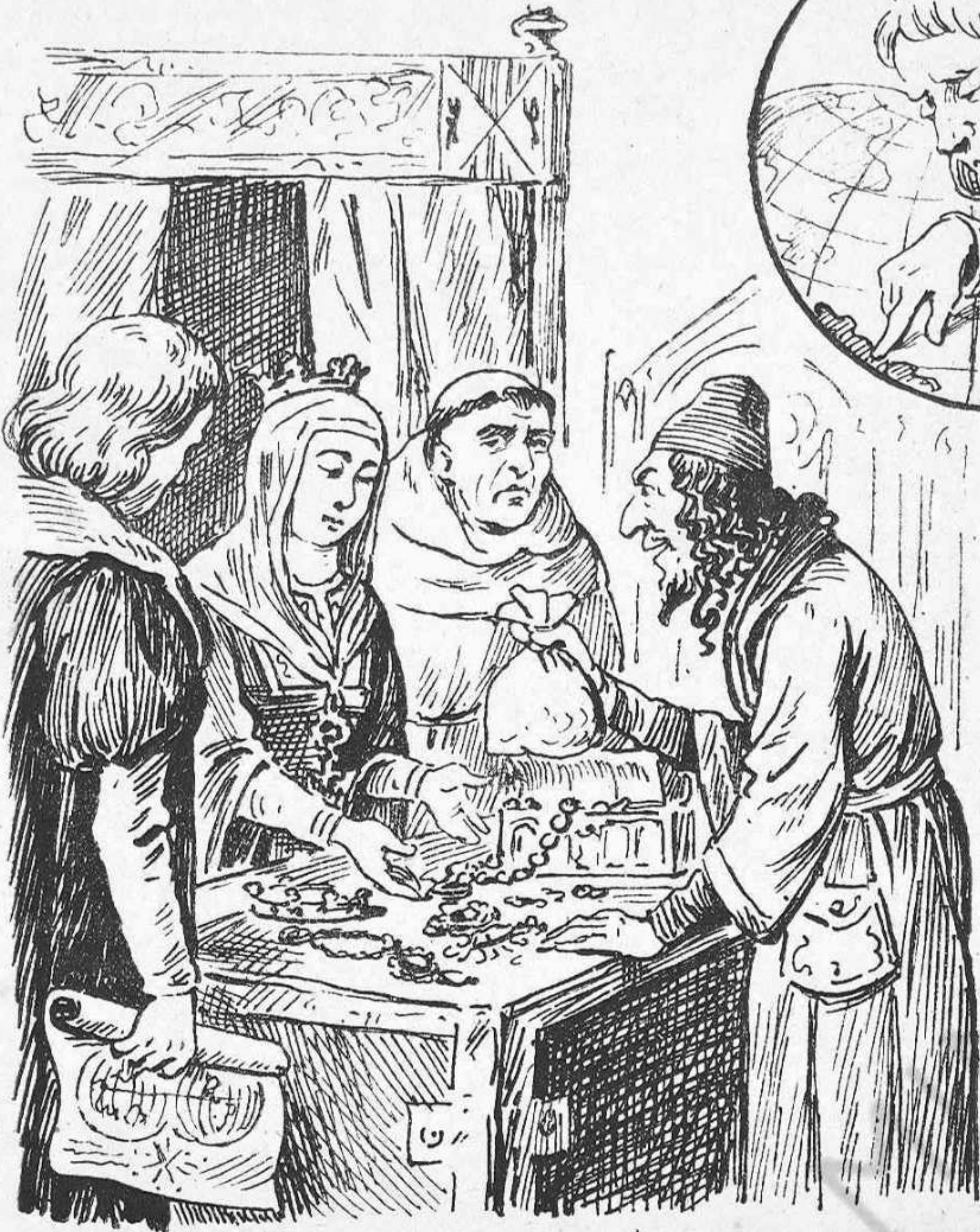
Per anarnosla á buscar, ja hi va haver qui 's va empenyar.