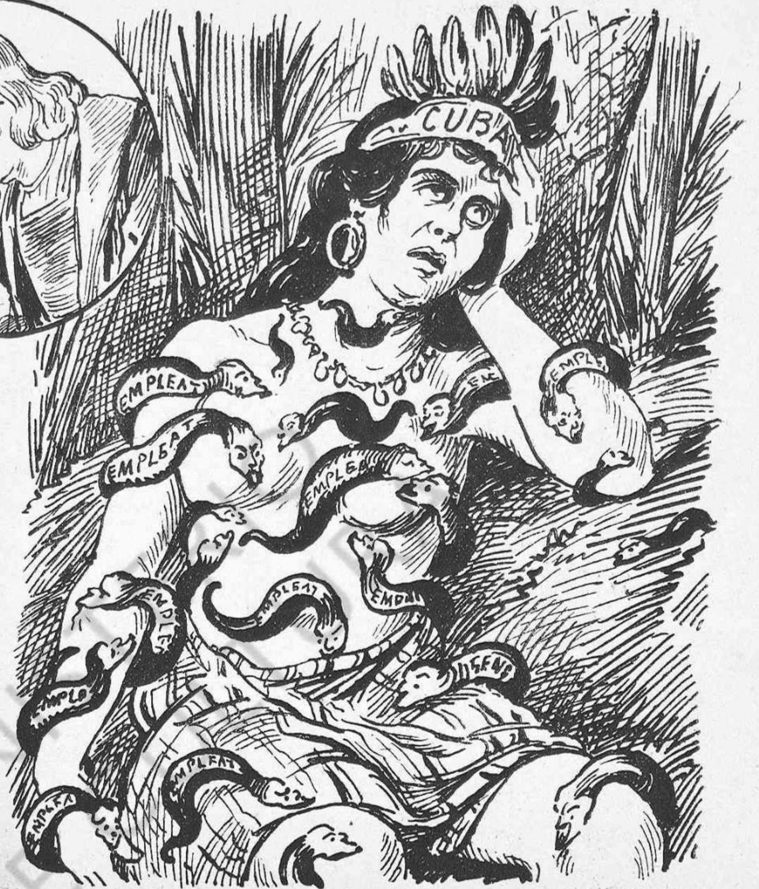
De maluras endiabladas ¡n' ha suferit!... ¡A carretadas!