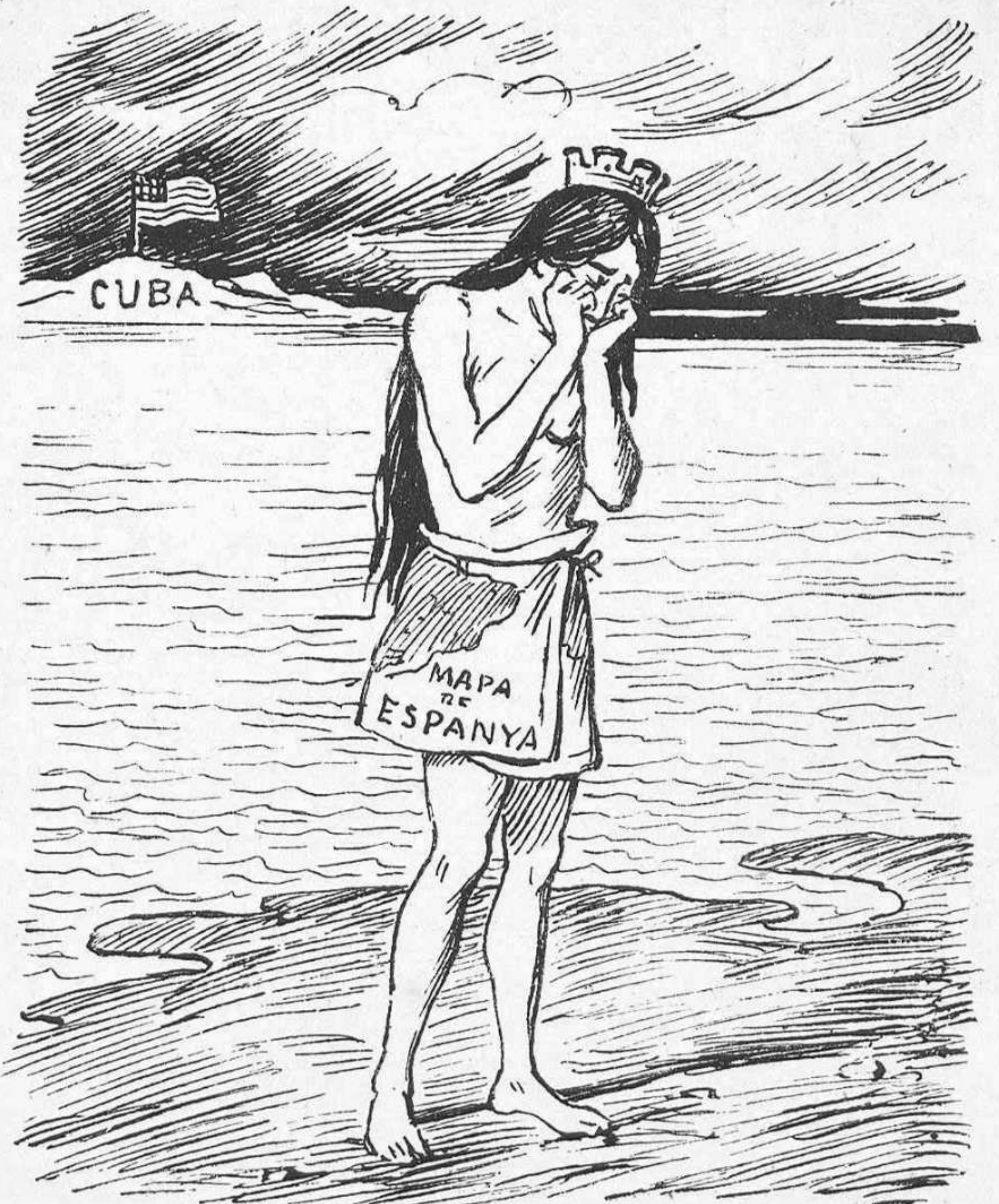
Cansó final: ¡Tururut, quí gemega ja ha rebut!