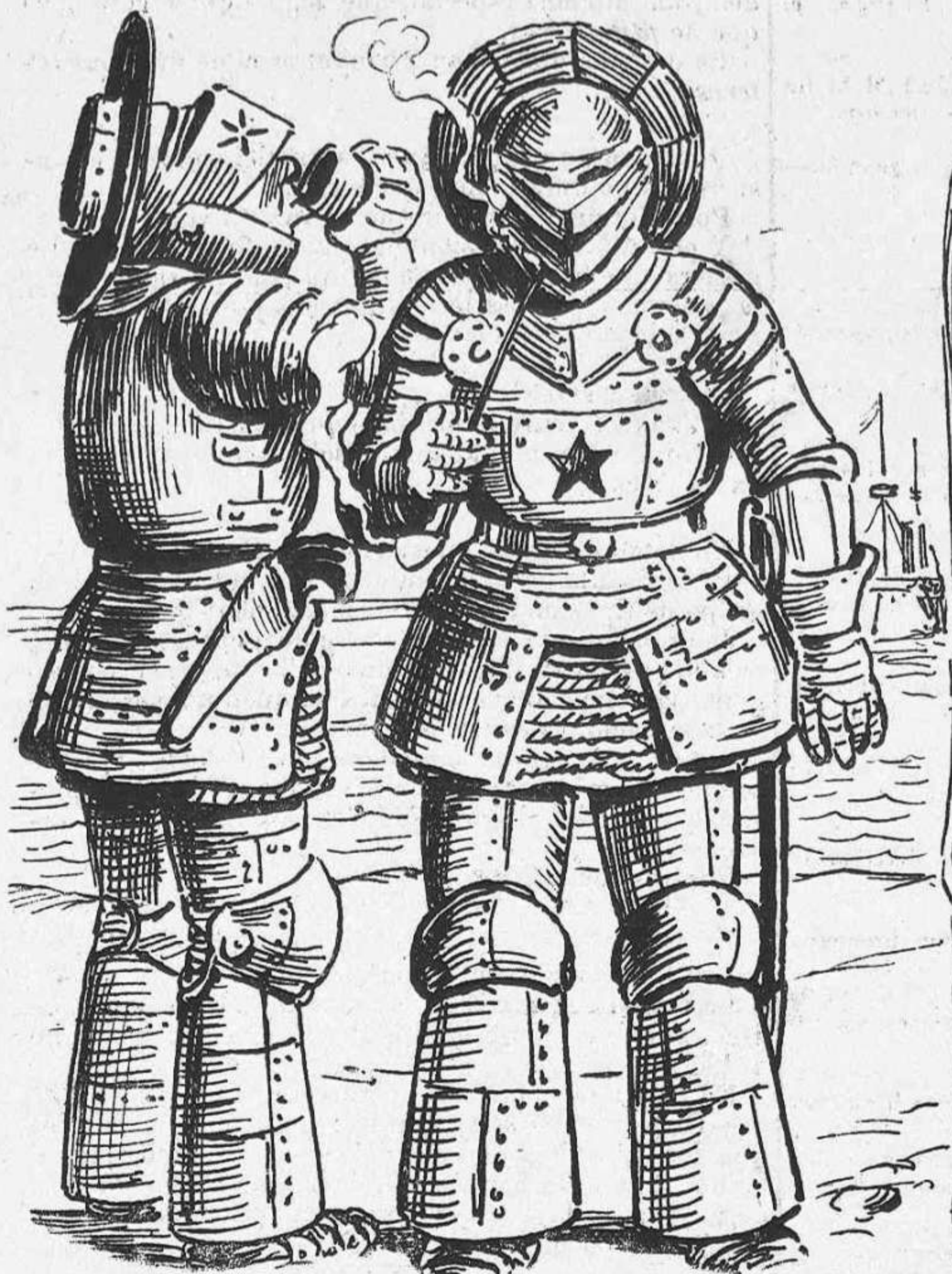
L'acorament dels marinos. (Sistema yankée).