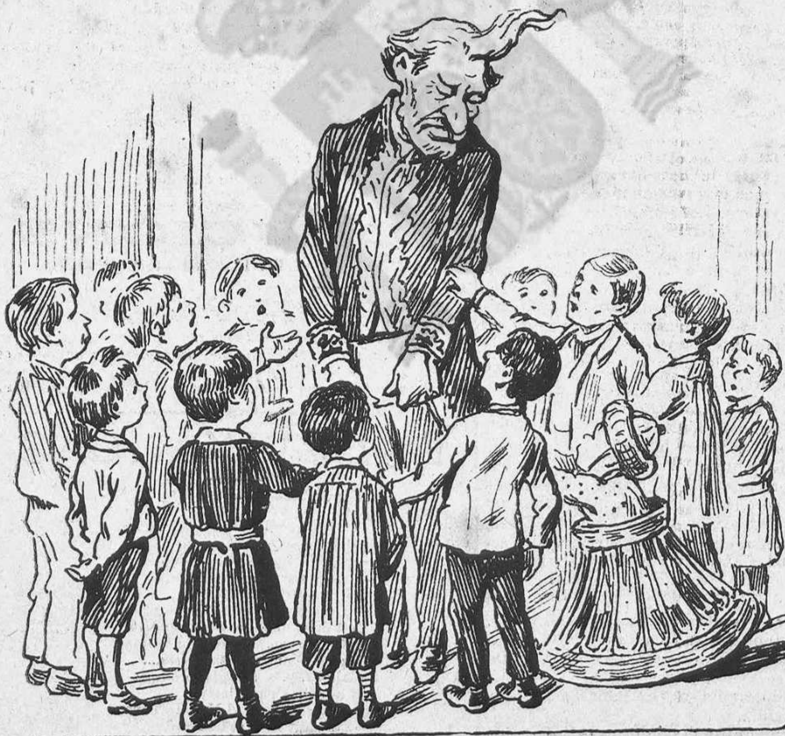
La qultxalla á n' en Sagasta:—Avi vell, vegi de acabar aviat lo de Cuba ó sino encare 'ns tocará anarhi á nosaltres.

La mateixa acció judicial pera ser eficaz necessita trobar lo seu cami ben expedit, y avuy encare hi ha qui podent ilustrar al jutje instructor dubta, vacila, y té por als que ab tot y pensar sobre d' ells tan tremendas acusacions, continuan desempeñant los mateixos cárrechs, al amparo dels quals cometeren las monstruositats de Montjuich.