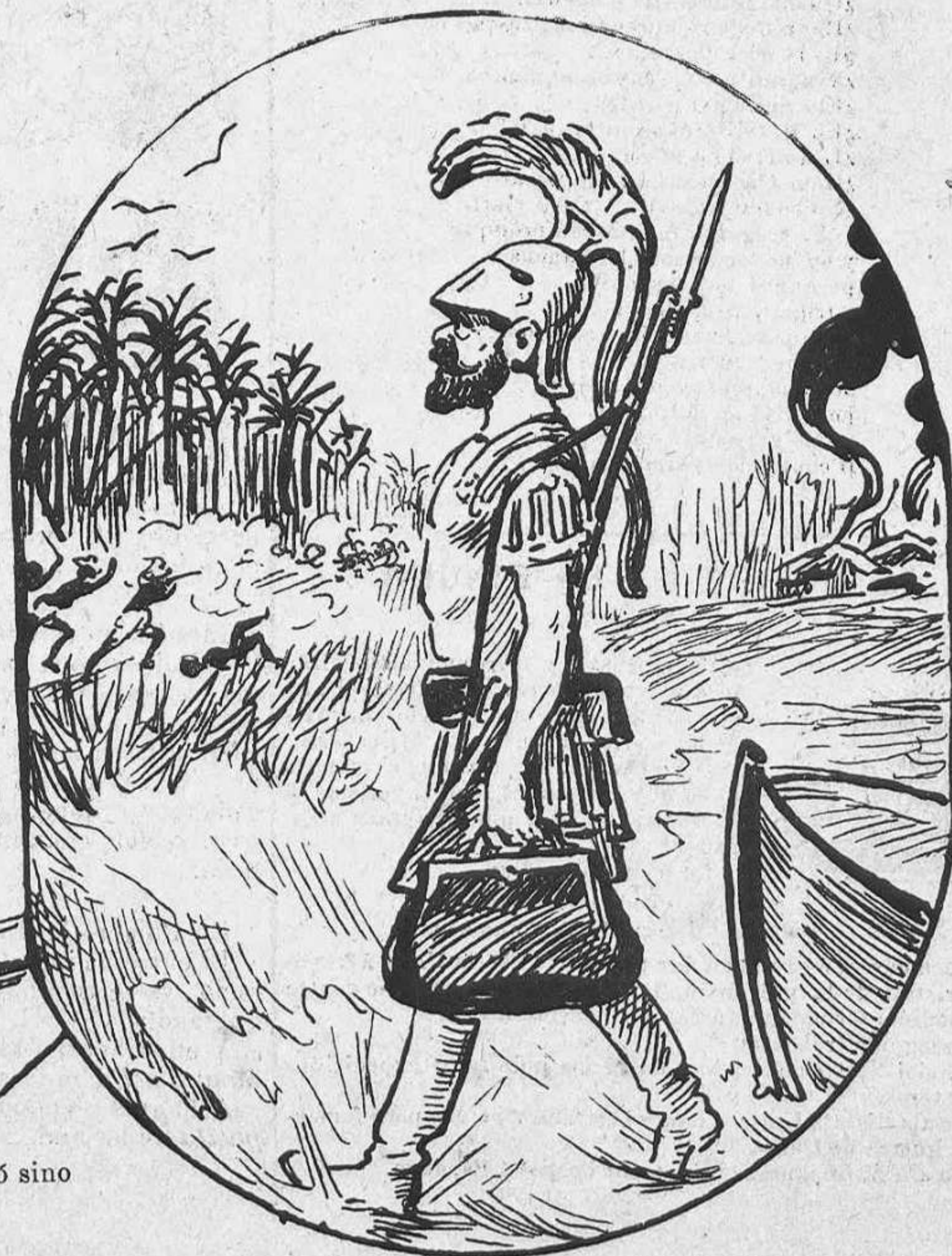
Lo viatge de Marte.—Com que á Europa m' hi estich morint de fástich, me 'n vaig á Cuba, que allí al menos hi ha broma llarga.