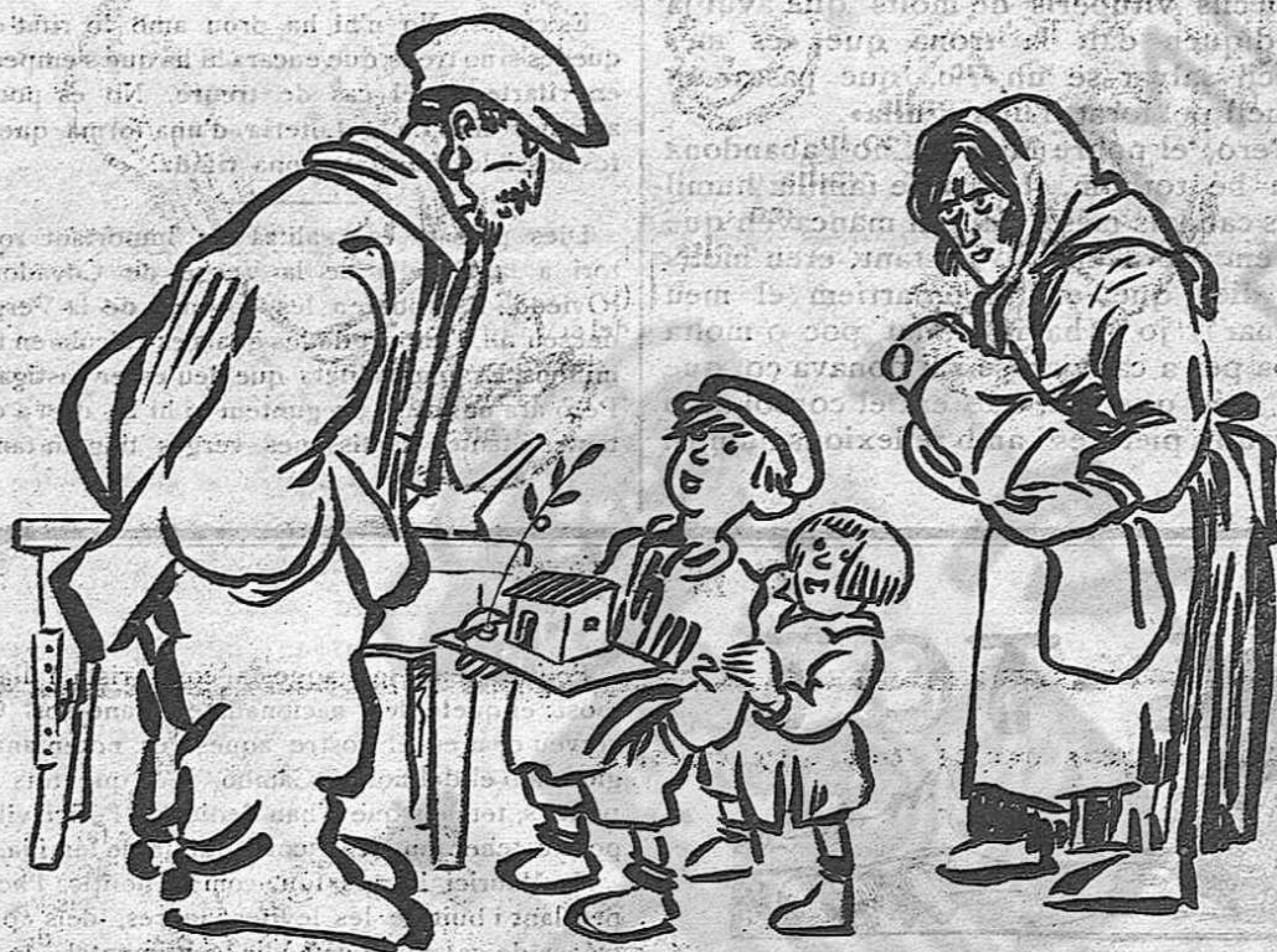
—Mireu, pare, una caseta de pessebre!

—I què en farem, fill, si és de cartró, i si hi poguéssim viure també ens farien pagar lloguer.