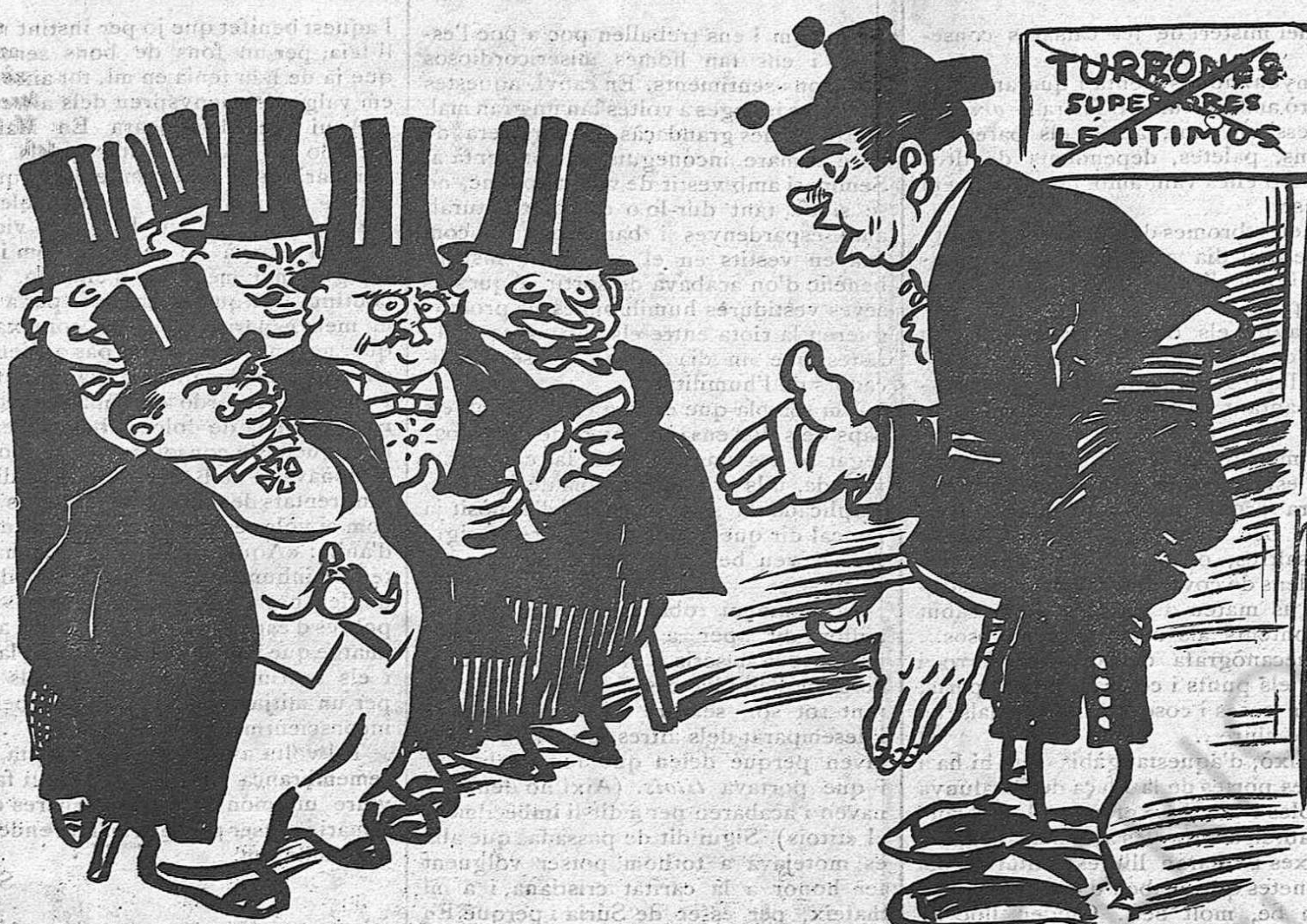
—“Señores, este año, se han acabado los turriones.”