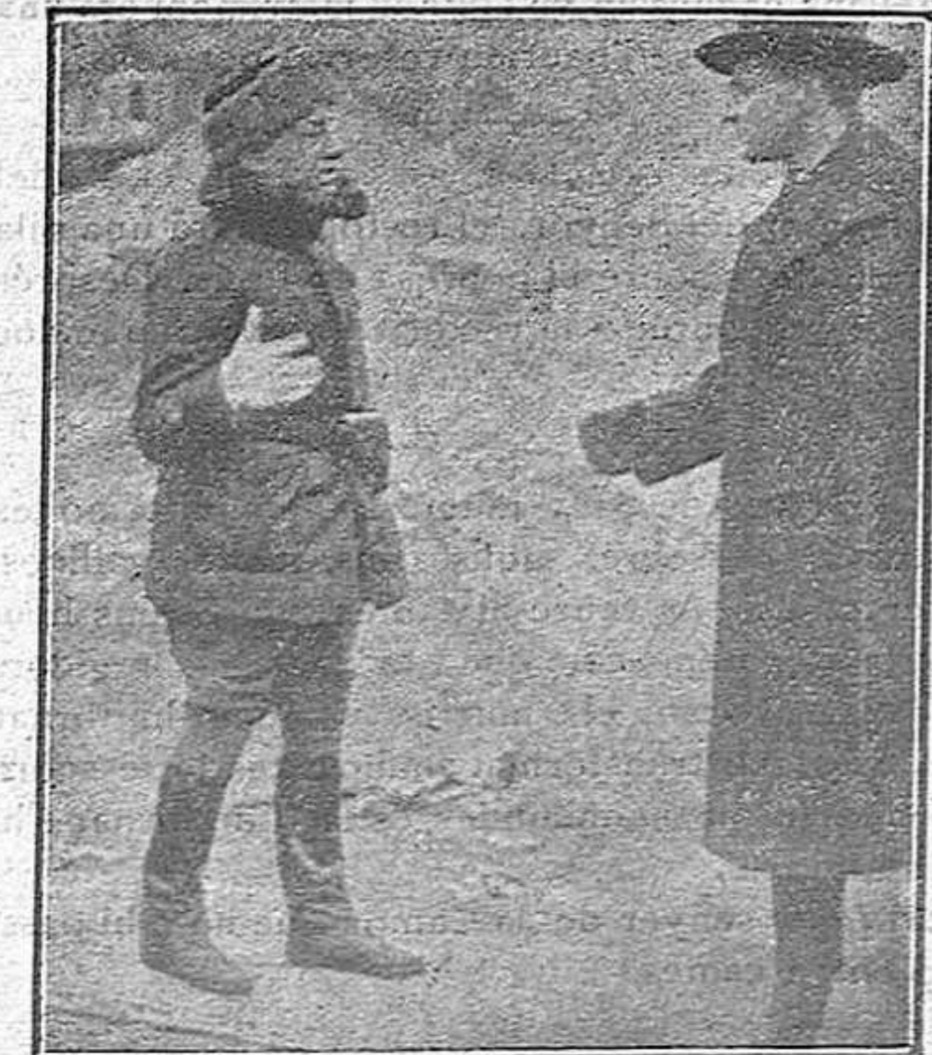
D'Annunzio a Gleno

Aquest home petit i desagradable està, indub-