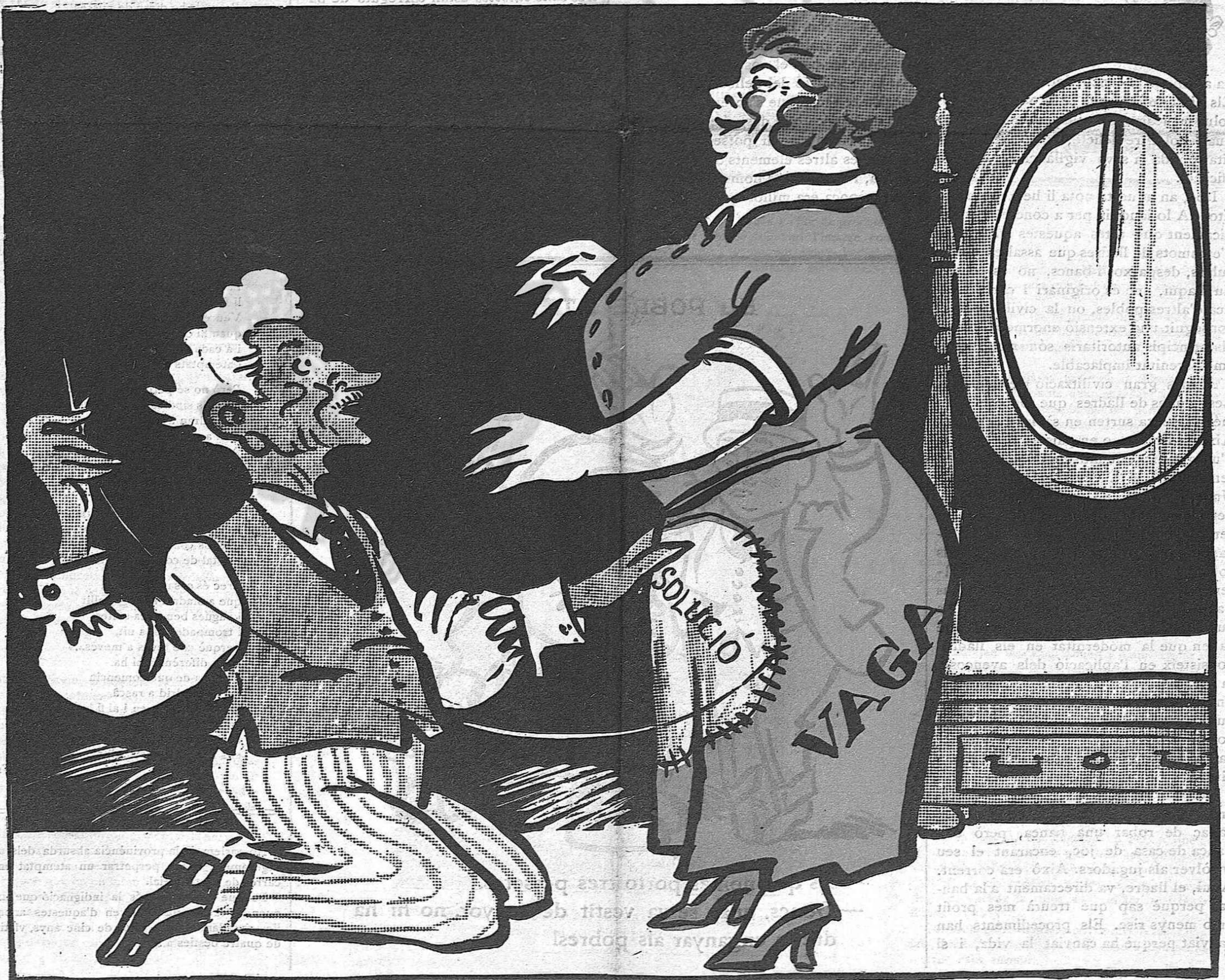
— Amb aquest pedaç, al menys podrà passar tres o quatre setmanes