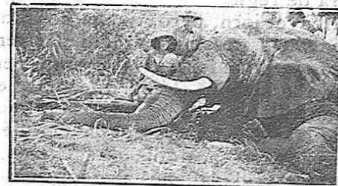
Elefant que Mistress Farquhar utilitza per a transports i passeigs a l'Àfrica Central

Abans que tot, si no hi tenim una seriosa dificultat, fixin la seva atenció an el gravat. Què hi han vist? Un elefant, oi? Sí, senyors, sí, és un elefant, un elefant de l'Àfrica Central que gairebé se li podria dir bona persona. I per a demostrar-