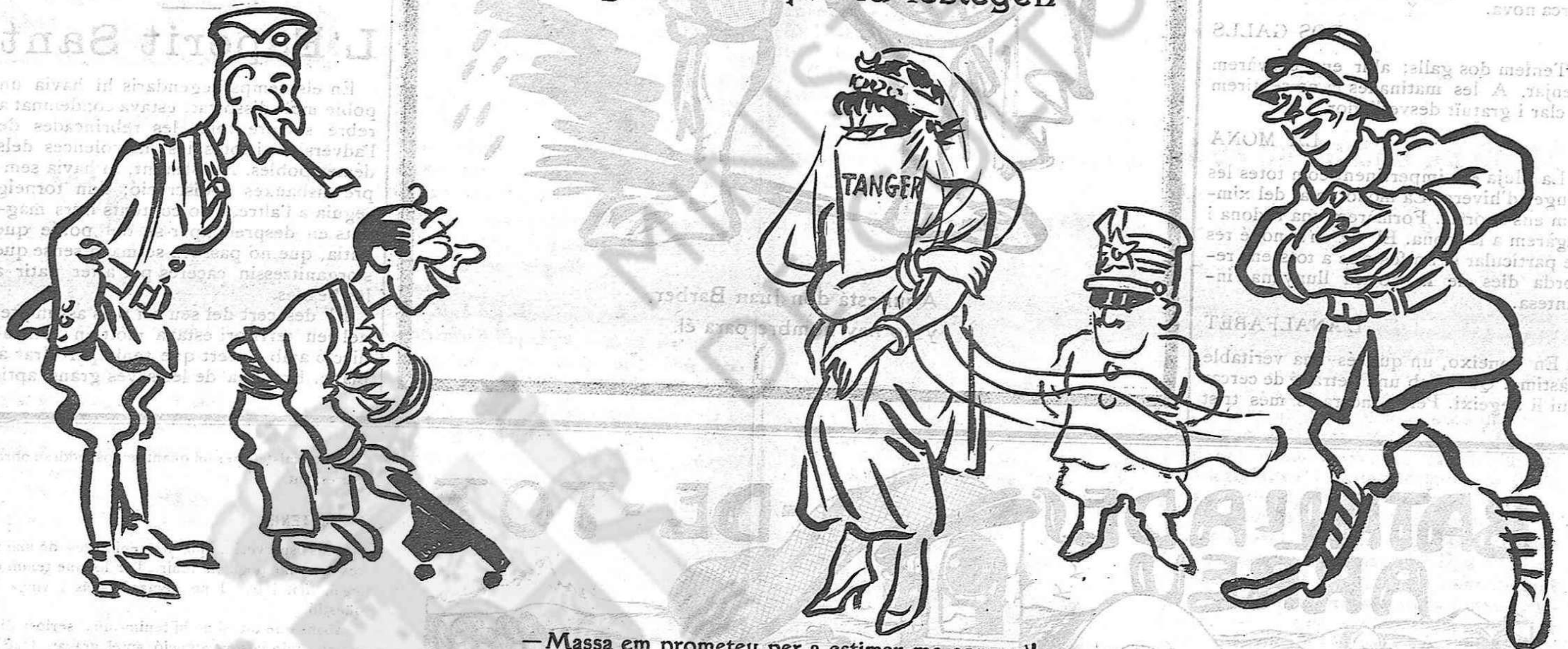
— Massa em prometeu per a estimar-me com cal!

tuds, i això el dispensava de la seva mala manera de regir.