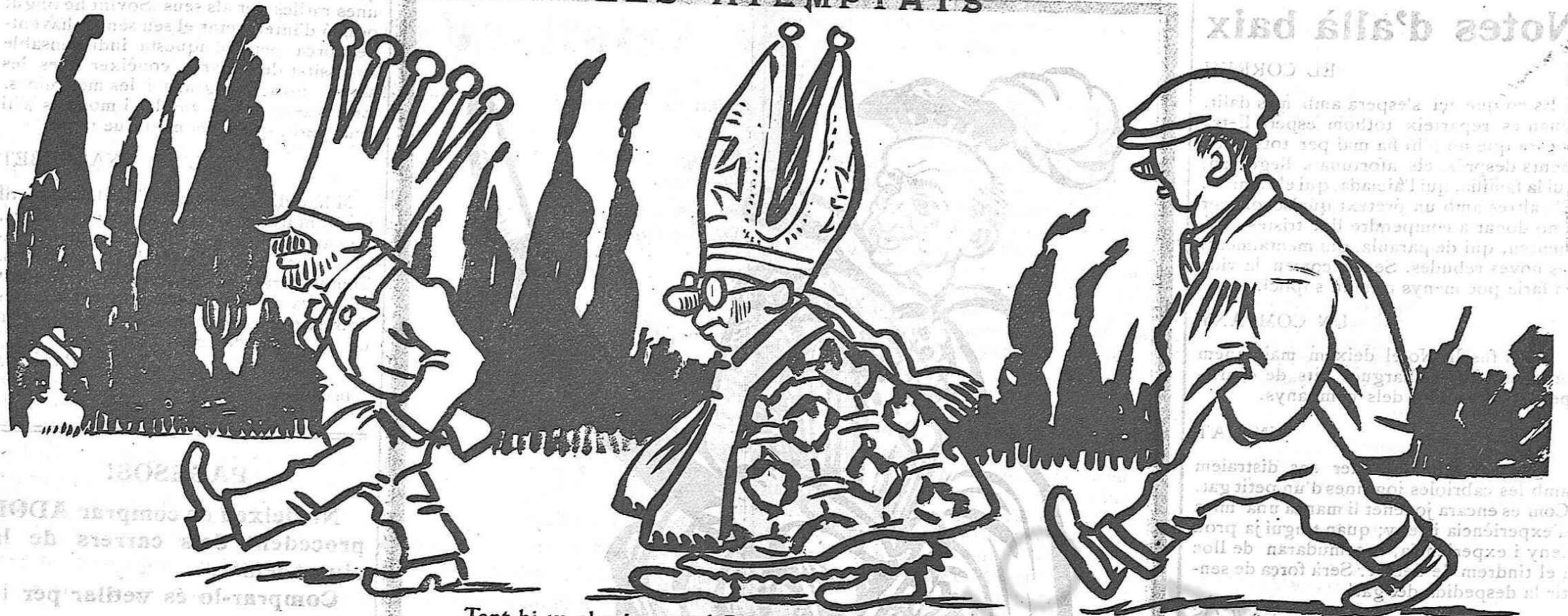
Tant hi va el rei, com el Papa,— com aquell que no té capa.