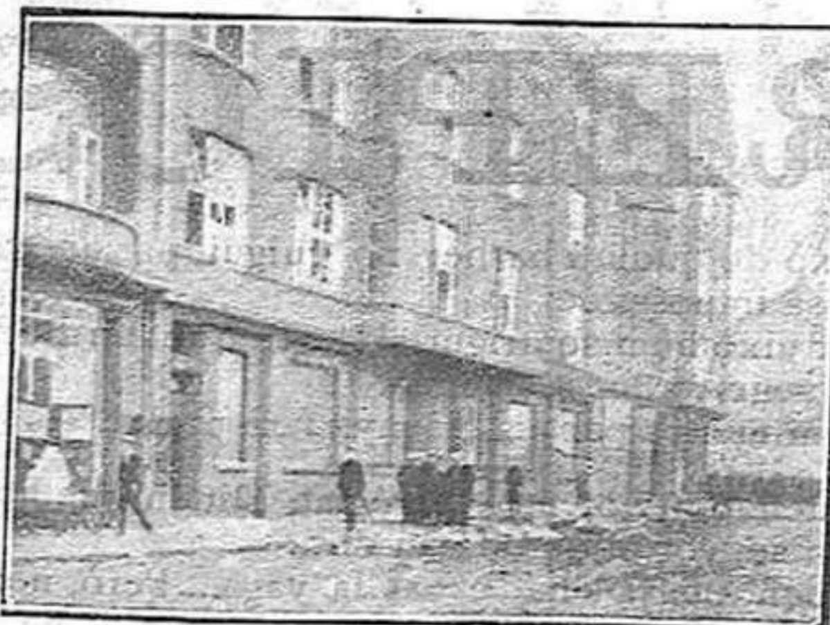
A Gelseukirchen els comunistes s'apoderen dels arxius de la policia

Els comunistes assalten la Quefatura de Policia