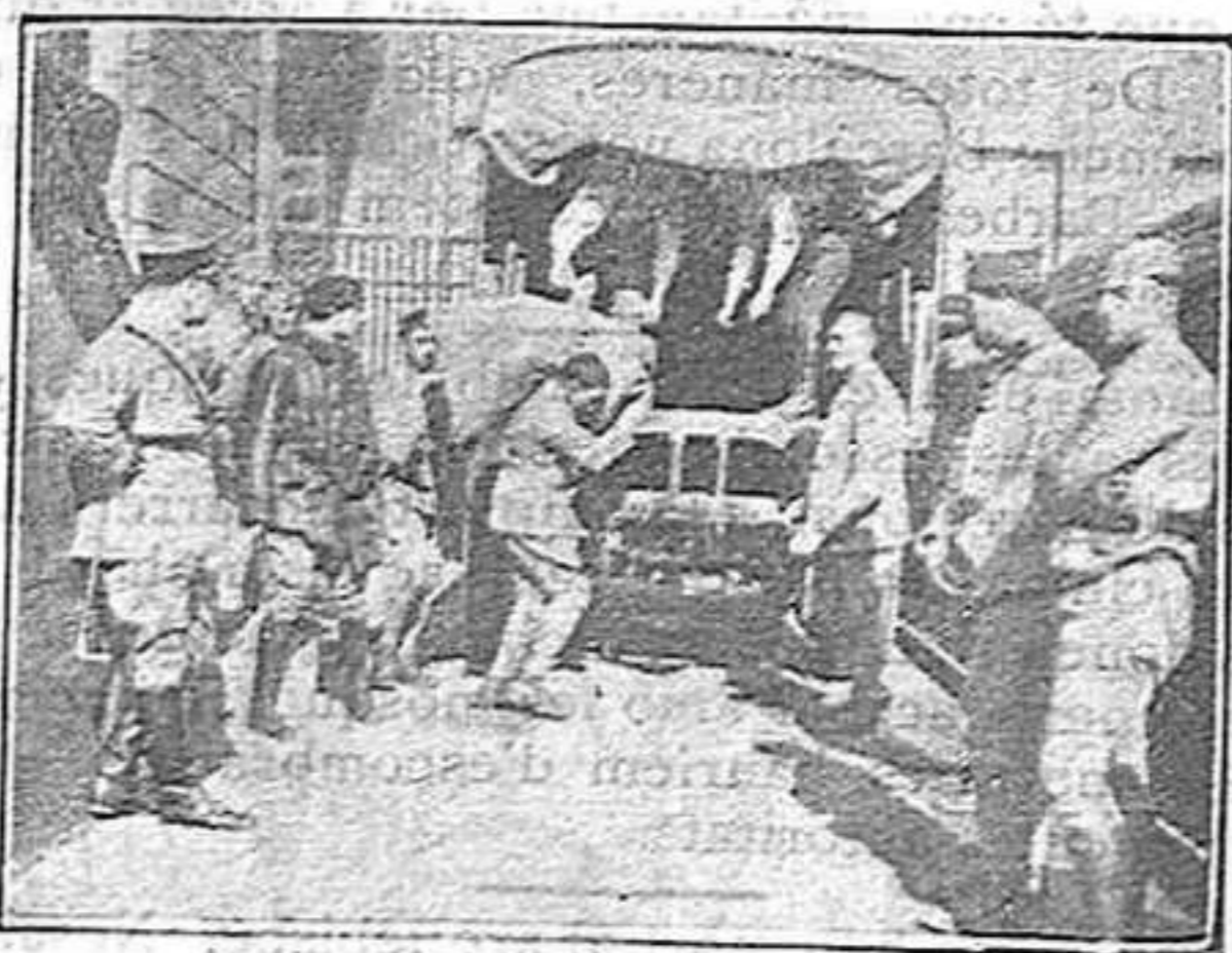
A Essen.—Carregant noranta milions de mares.

Però el món està plé de perills, d'amagatalls,