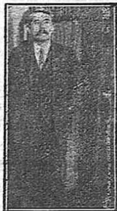
Cachin, diputat francès que ha sigut agafat pel seu govern

En Poincaré es mereix la medalla del mèrit reaccionari.