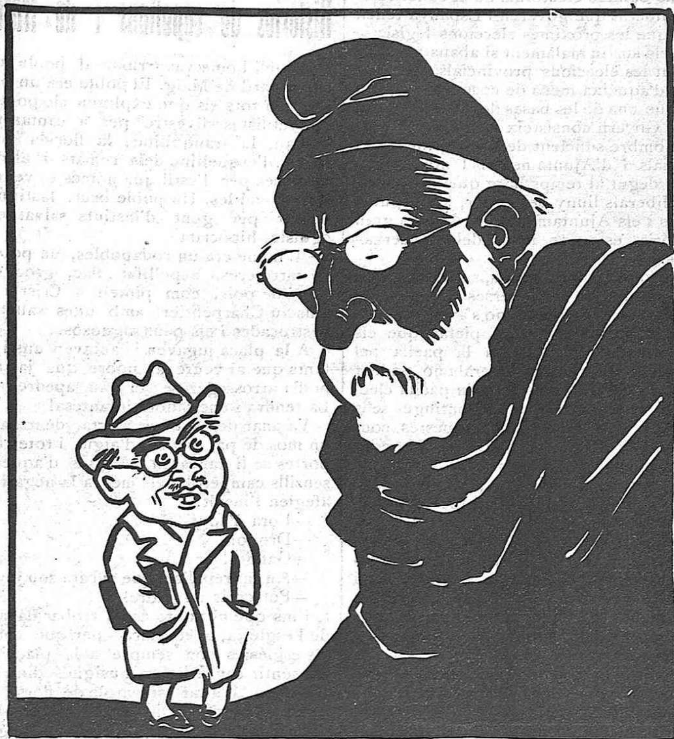
—Segueix per aquest camí, simpàtic Rovira Primer que tot, manar a casa nostra i lo demés són pu...