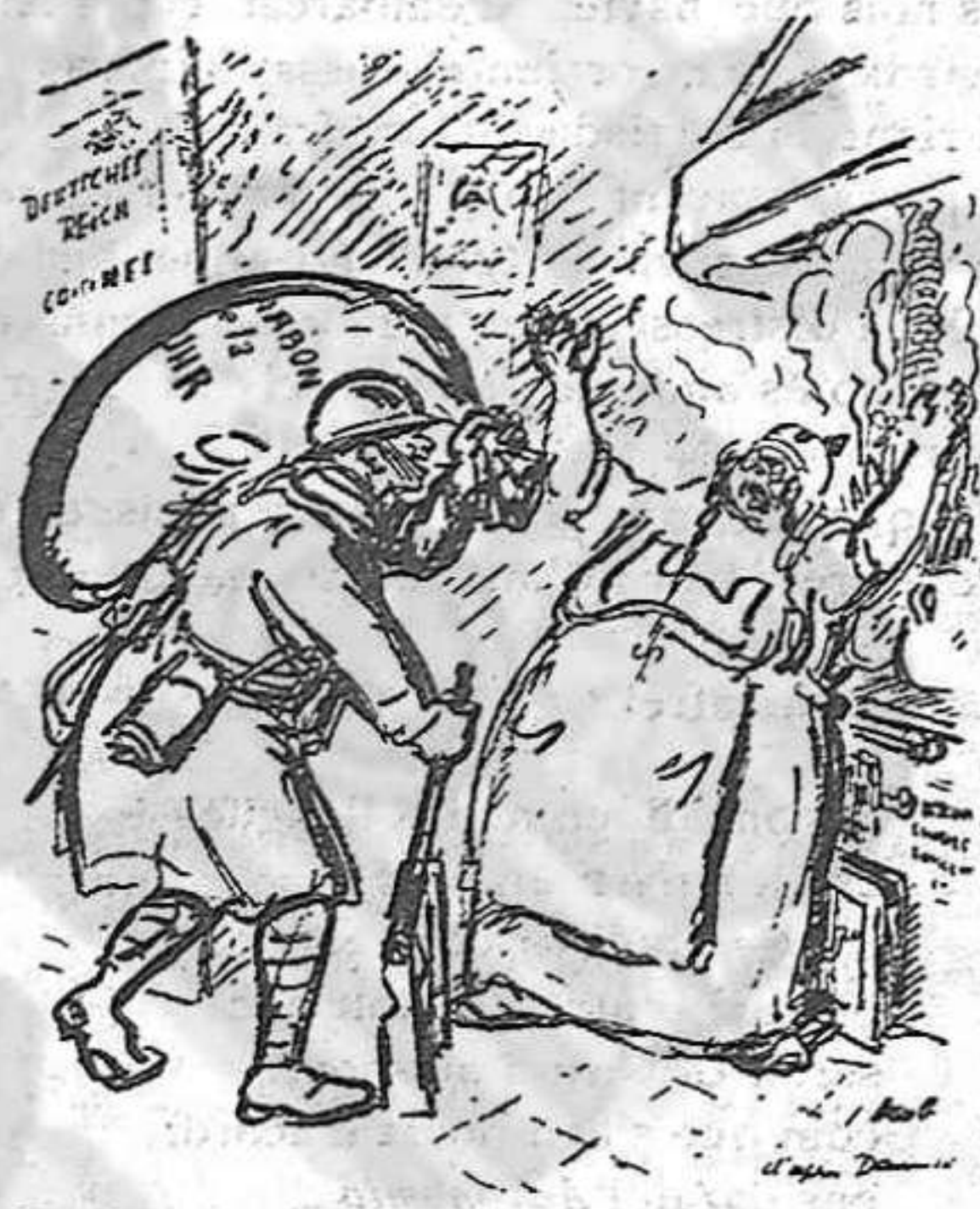
—Tu deixa'm entrar, que una vegada a dins...

paratius fan dubtar de que l'entrada de [França dins d'Alemanya sigui tan sols per obtindre el pagament dels deutes.