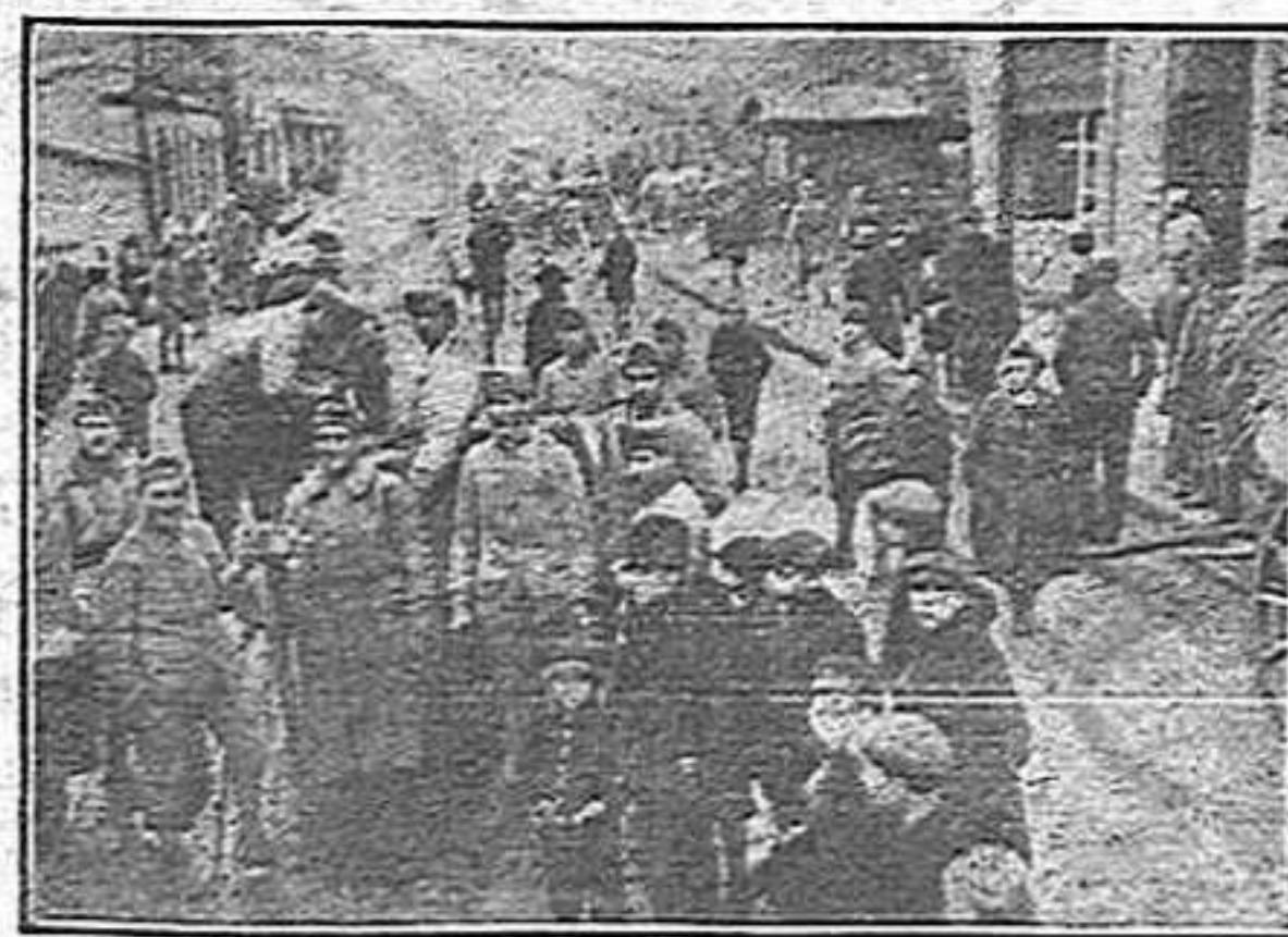
Tropes franceses a Dortmund

demonstrat, quan menys pels que encara es convingu una mica de bona fe. Ella ho enreda tot i quan està ben embolicat, aquí us ho deixo i apa!, arregleu-se.