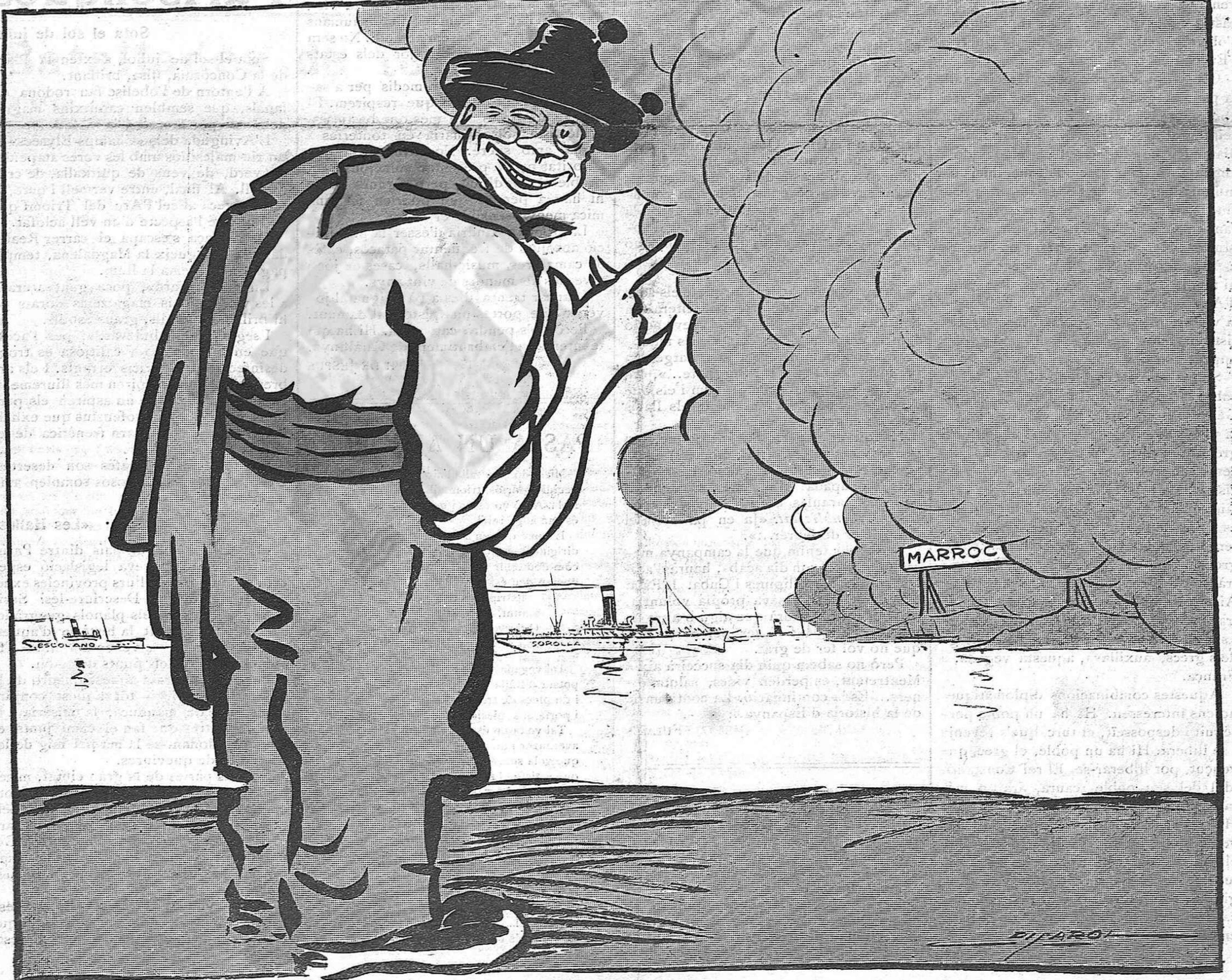
—Encara en marxen... i aixó que els pares de la pàtria diuen: "Sin novedad en todo el territorio".