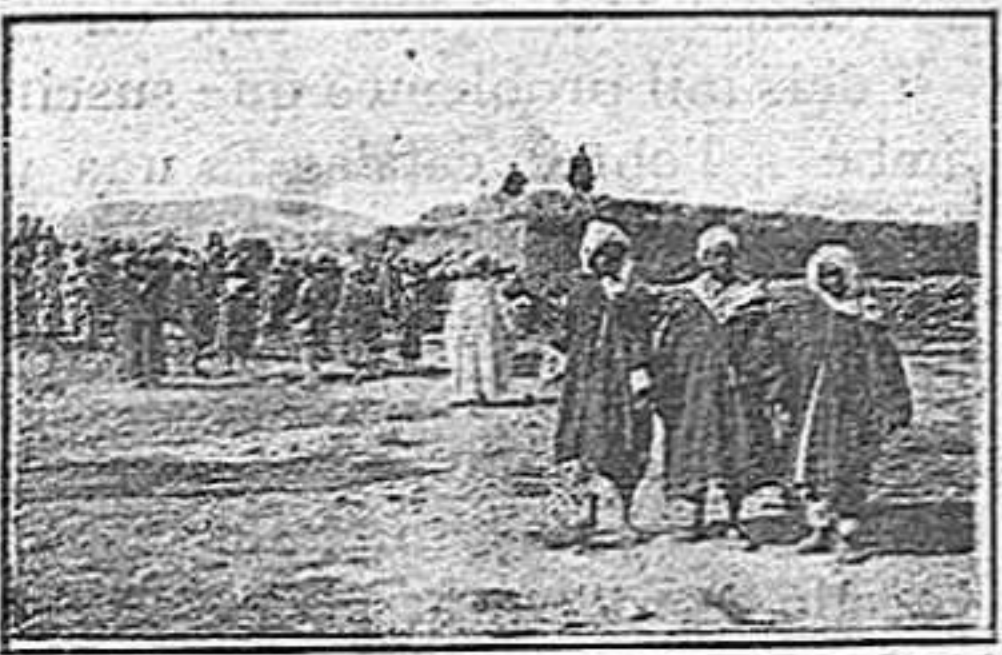
Els caïds de Tafersit, Haddu i Midher

Armats fins a les dents, o fins amb les dents