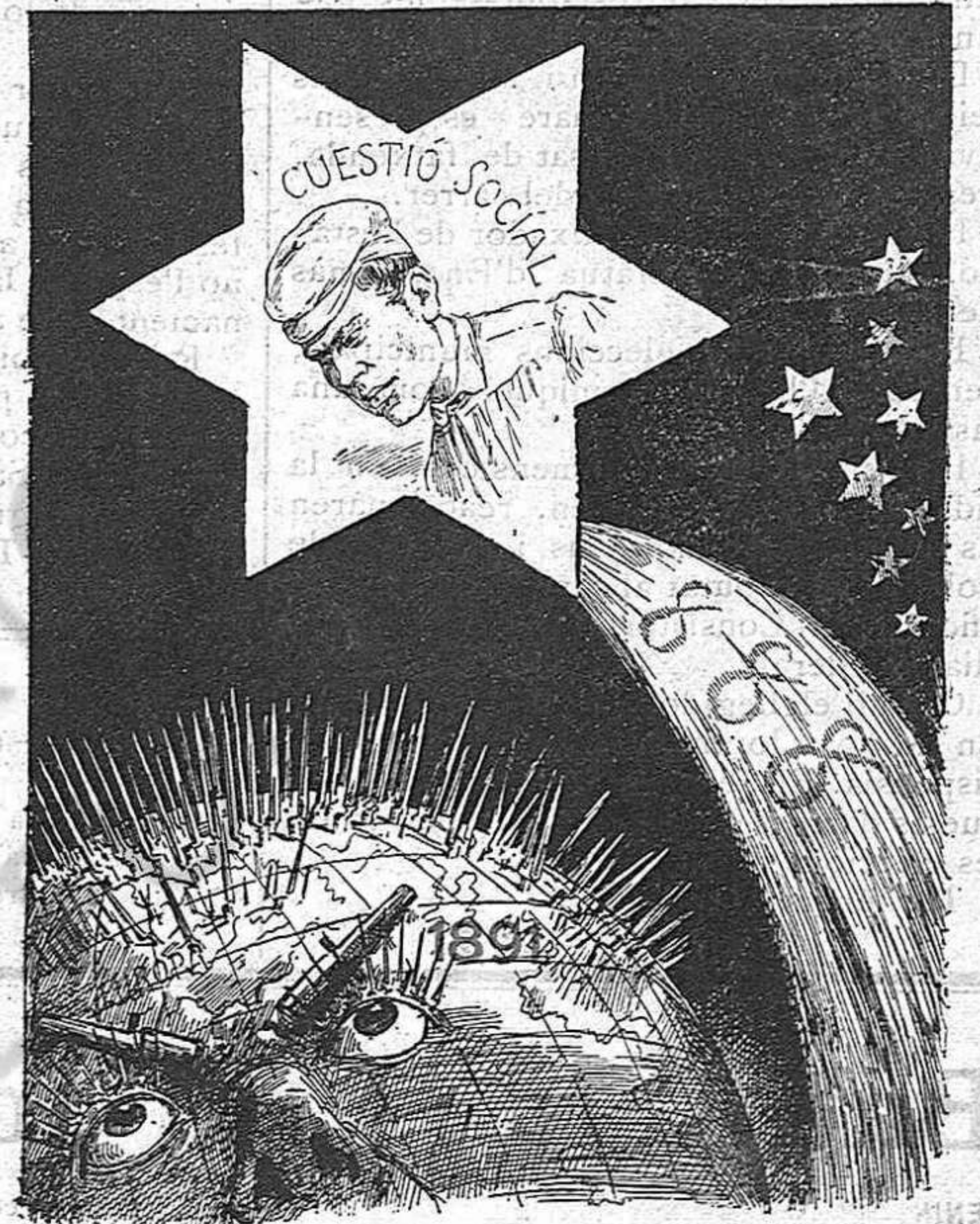
Al veure la estrella ab qua que ha aparegut en lo cel al mon se li erisa 'l pel y de angunia está que sua.