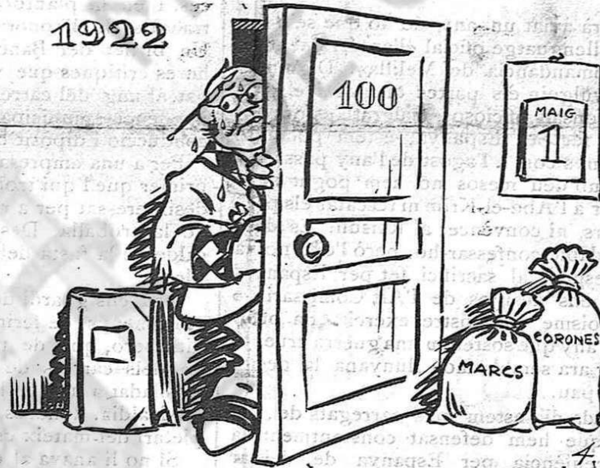
— Fa molt servei el diner... sobre tot si és en paper.