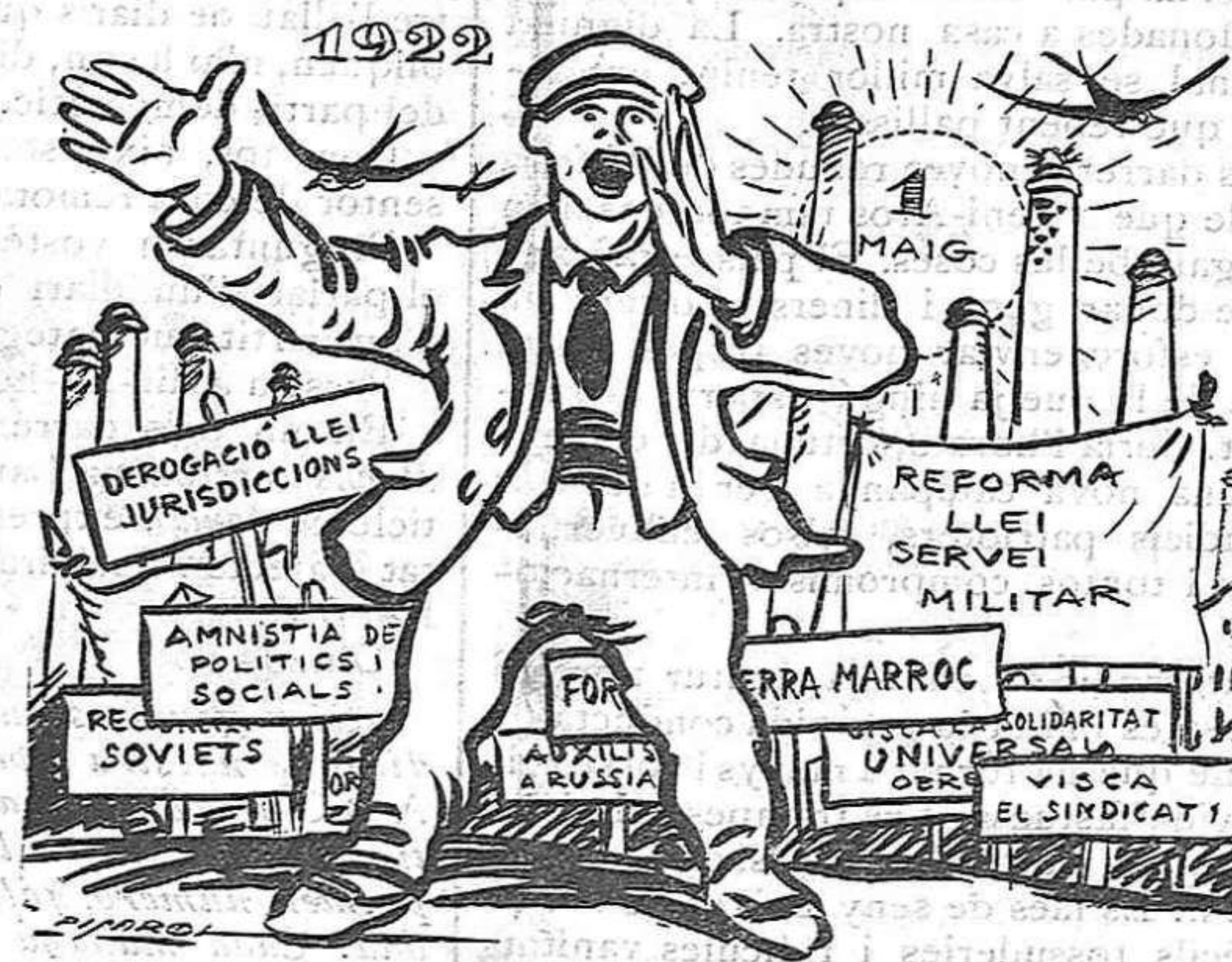
— Sort que d'avui a demà... un nou món comensarà.