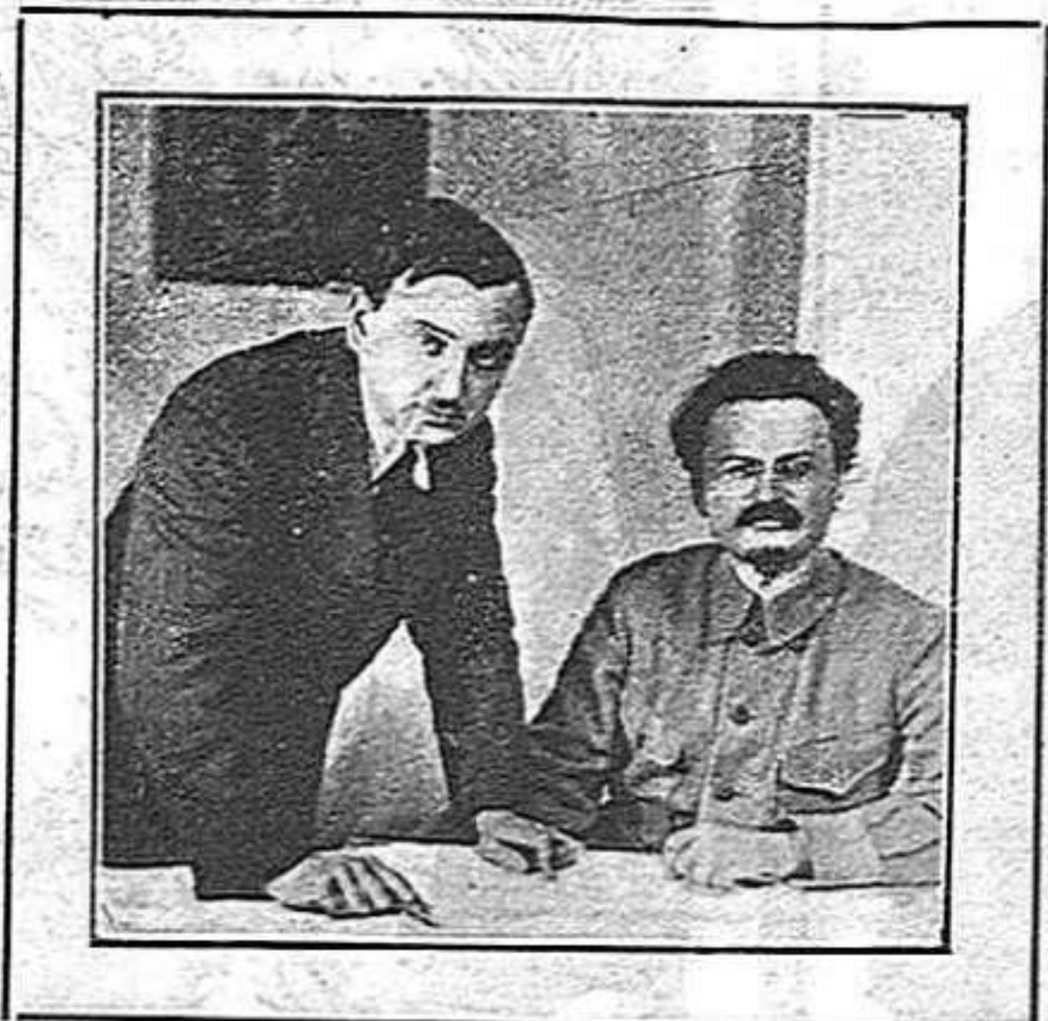
En Trotsky despatxant amb el seu secretari

Lleó Trotsky és un altre dels homes que fugint de la reacció correngué el món sencer i potsers