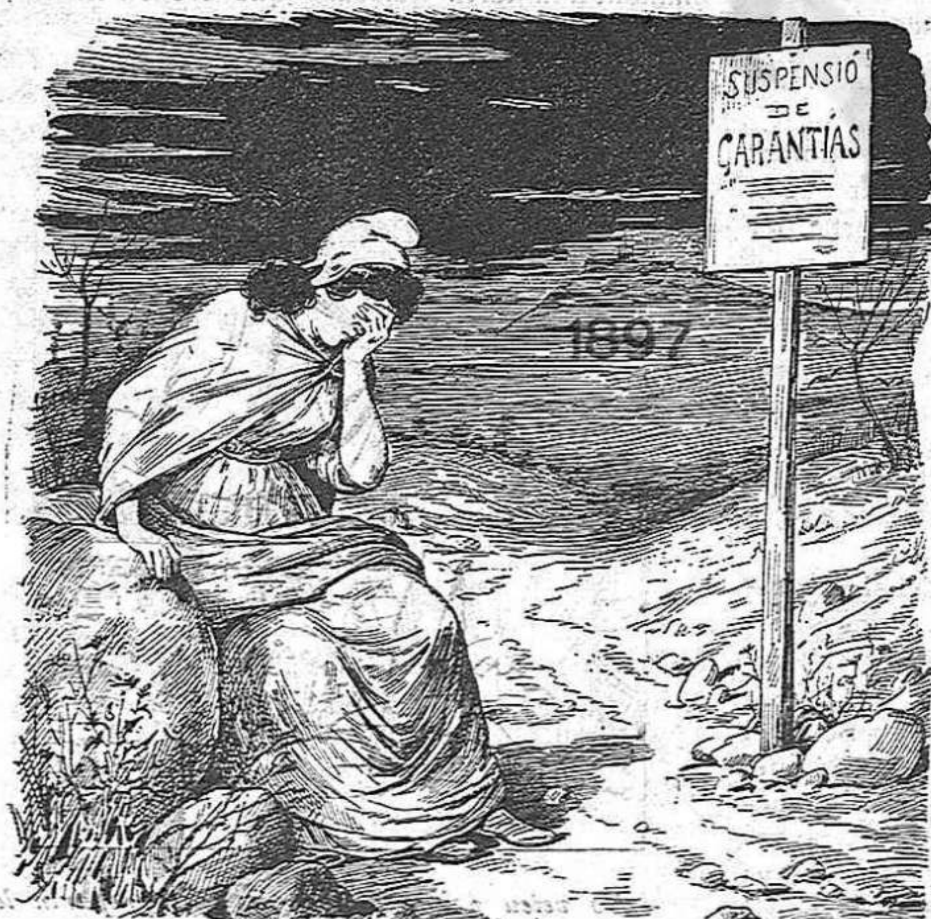
Lo primer de Maig á Barcelona