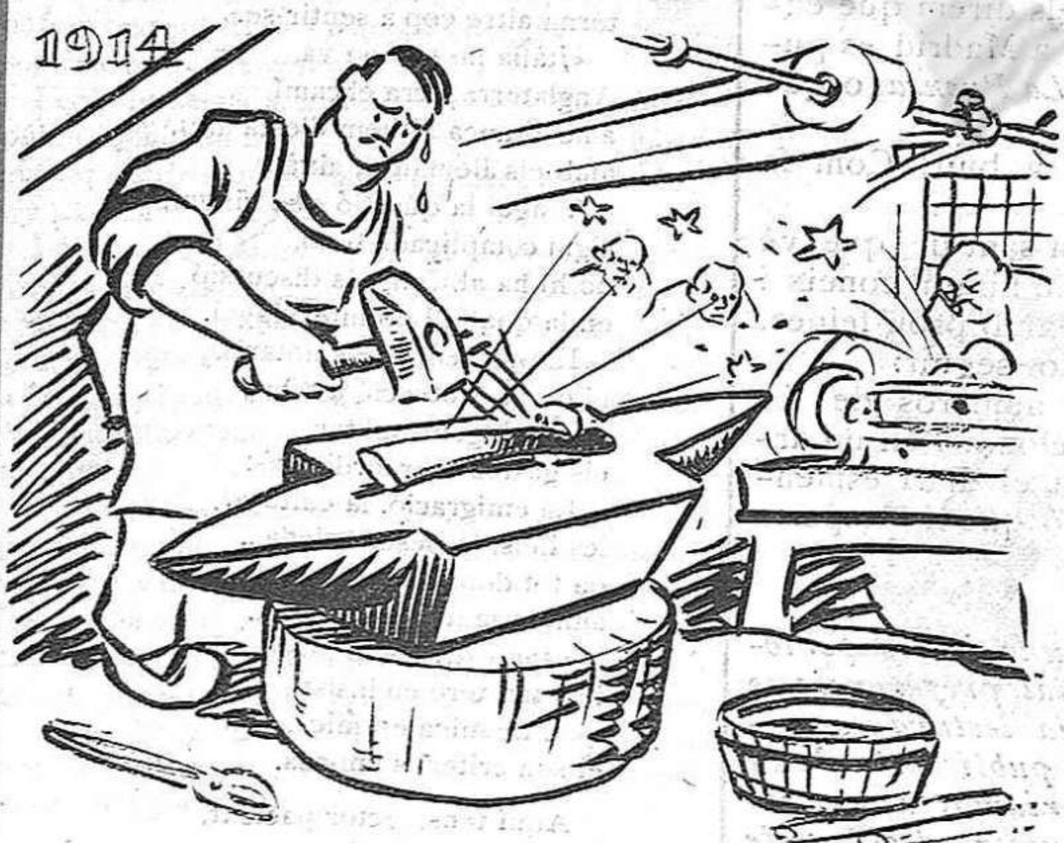
— Molt treball i mal pagat per l'obrer formal i honrat.