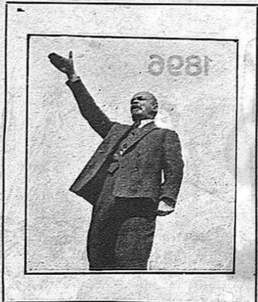
Lenin, en actitud de discursar

Tots els grans moviments favoreixen el seu capdill, l'home quin nom ho sintetitza i ho evoca