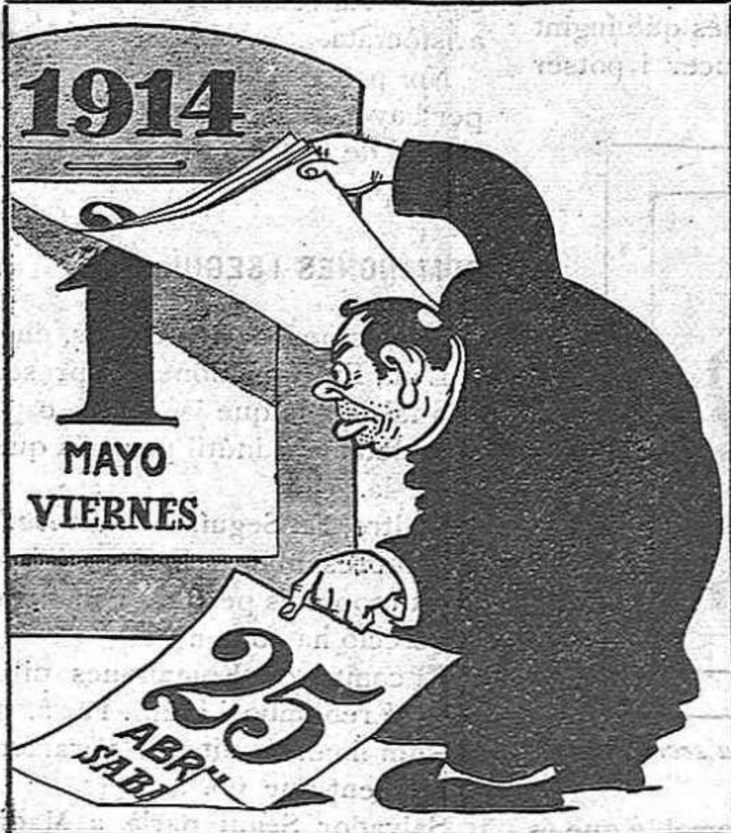
—Té, ja s'acosta el mes de Maria, el mes de les flors... —Si... pero cuidao con las espinas, señor clérigo!