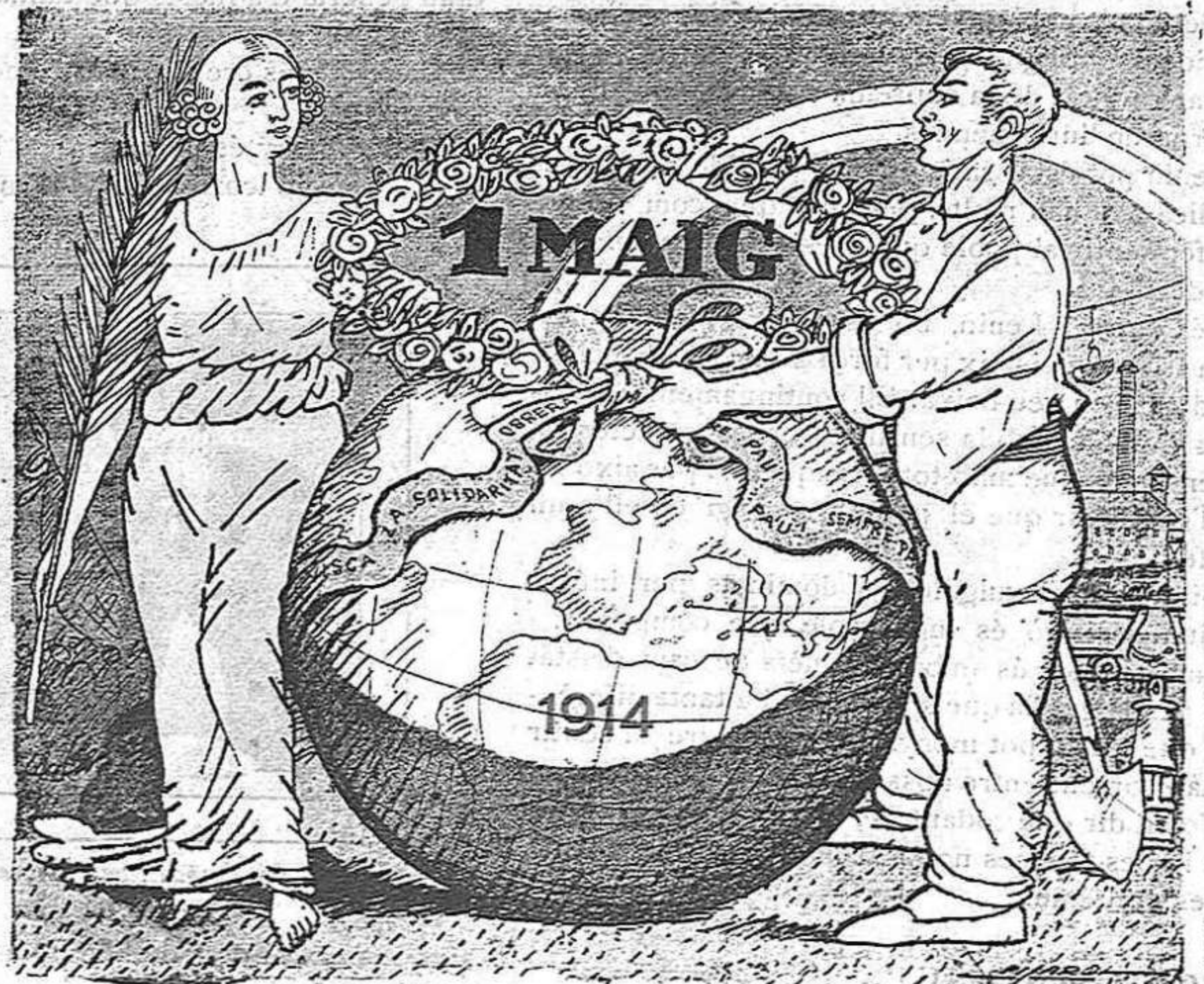
La Pau i el Treball, futurs amos de la Terra

Famoses làmines publicades a LA CAMPANA, amb motiu de la Festa del Treball