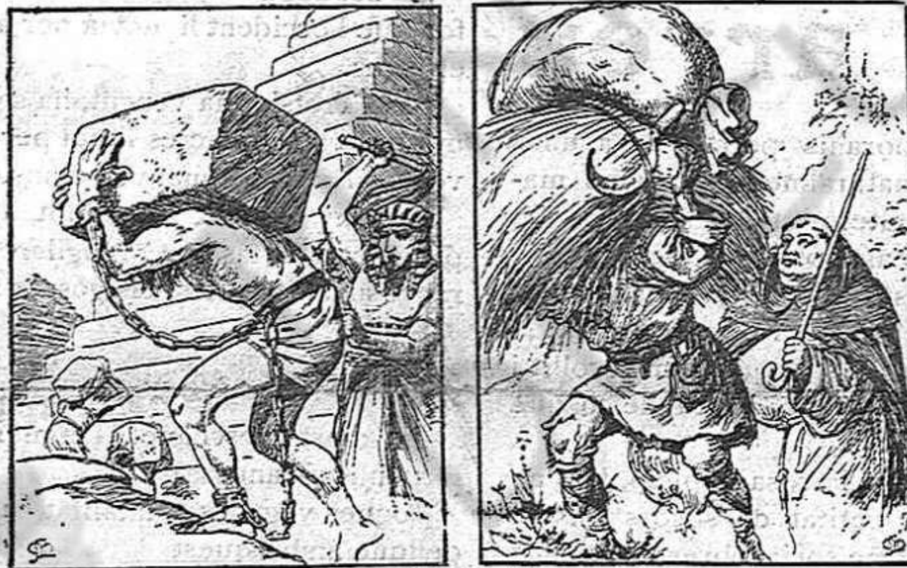
L'obrer, é la antiguetat 1894 L'obrer, é la Edat mitja