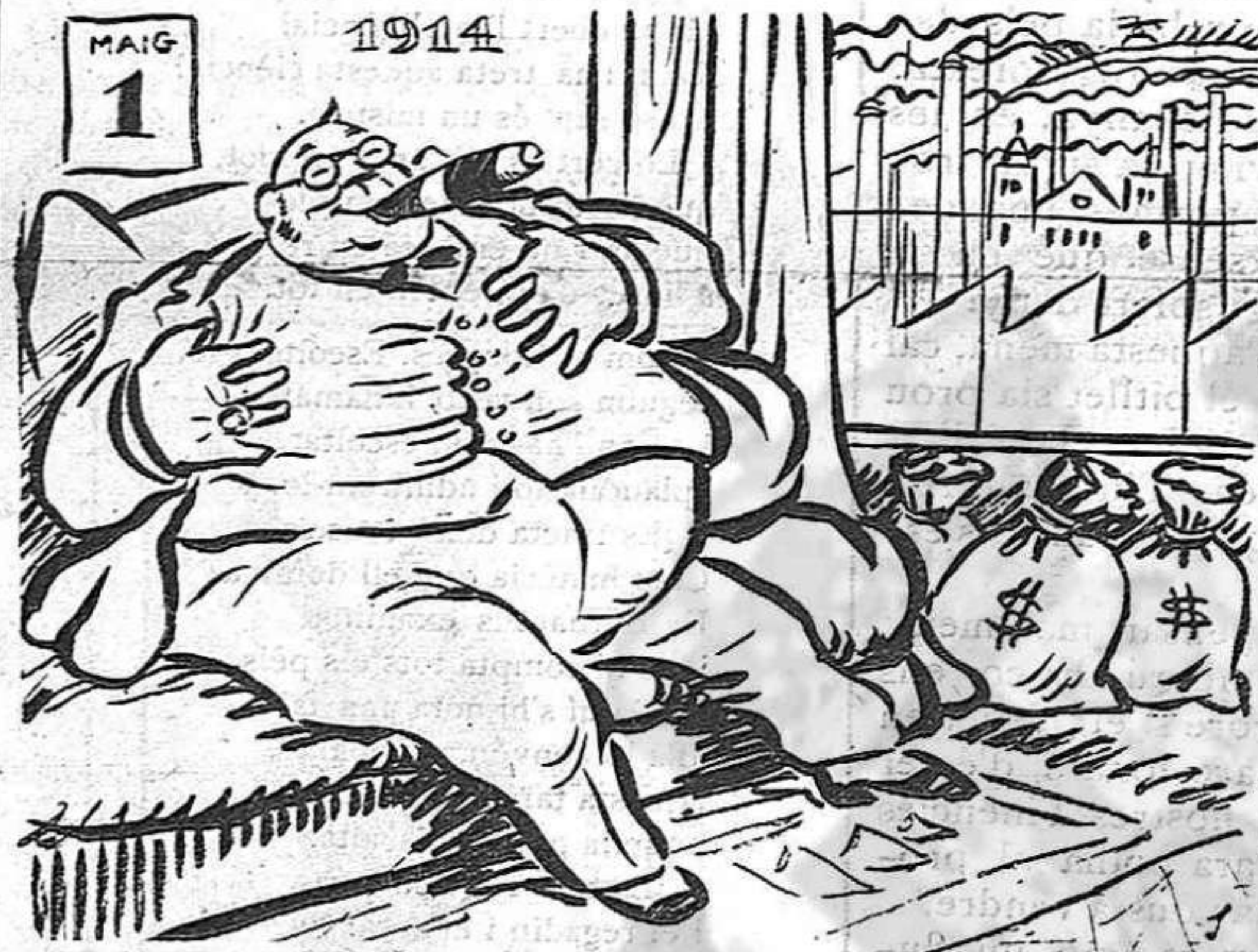
— Com que soc l'amo de casa, ningú m'empeta la basa.