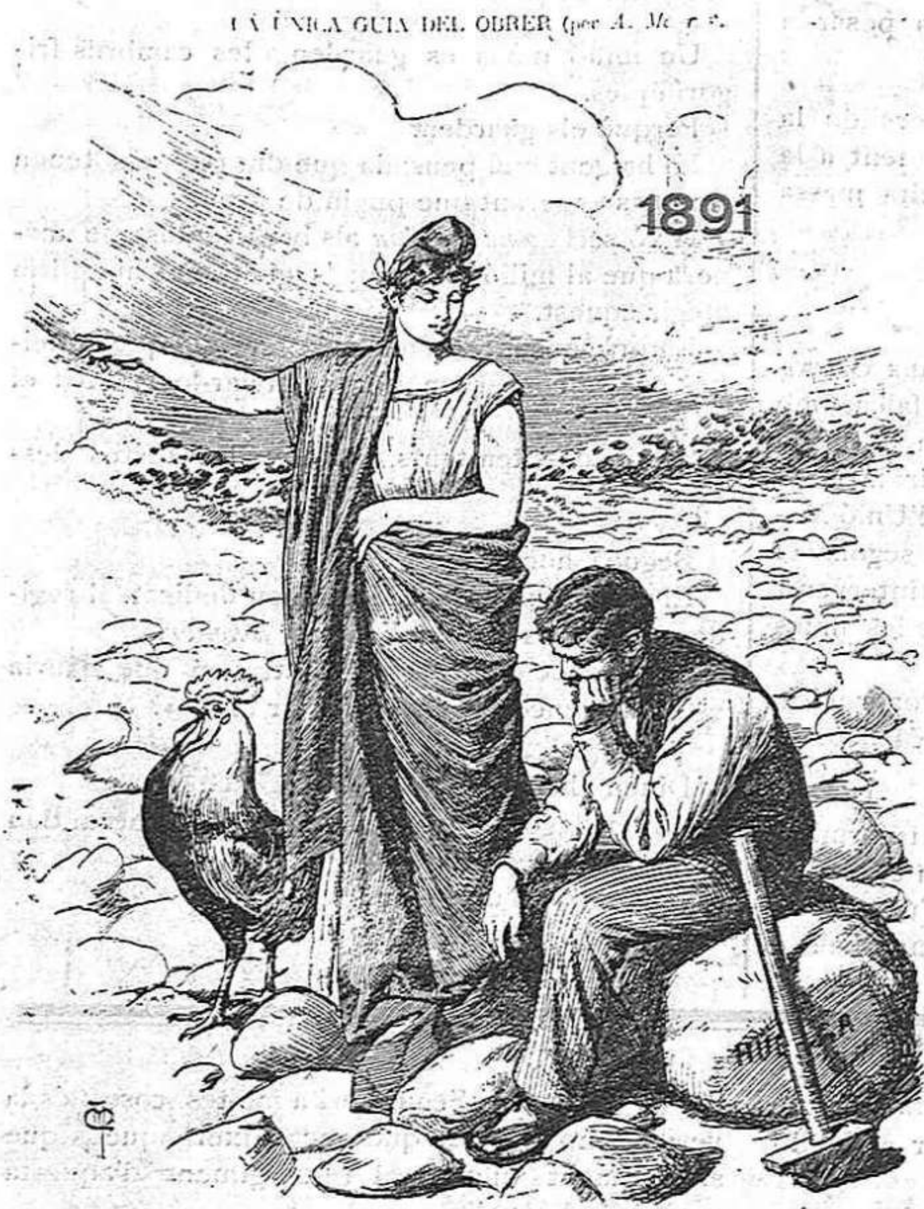
¡Si vols sortir de aquest pedregam, àlstat y segueixme!