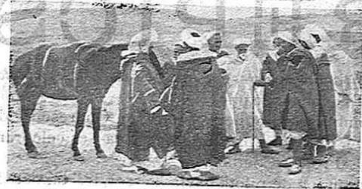
Quefes de hàbila, disposats a oferir la sotmissió

Malgrat la rapidesa que semblava havia d'emprar-se en la qüestió d'Alhucemas, la cosa segueix estacionada i els moros, previsors, van internant als presoners a l'anunci del nostre avenç fet, demostrant una tàctica com cap excelent, a sò de tabals i platerets. Els pobres pre-