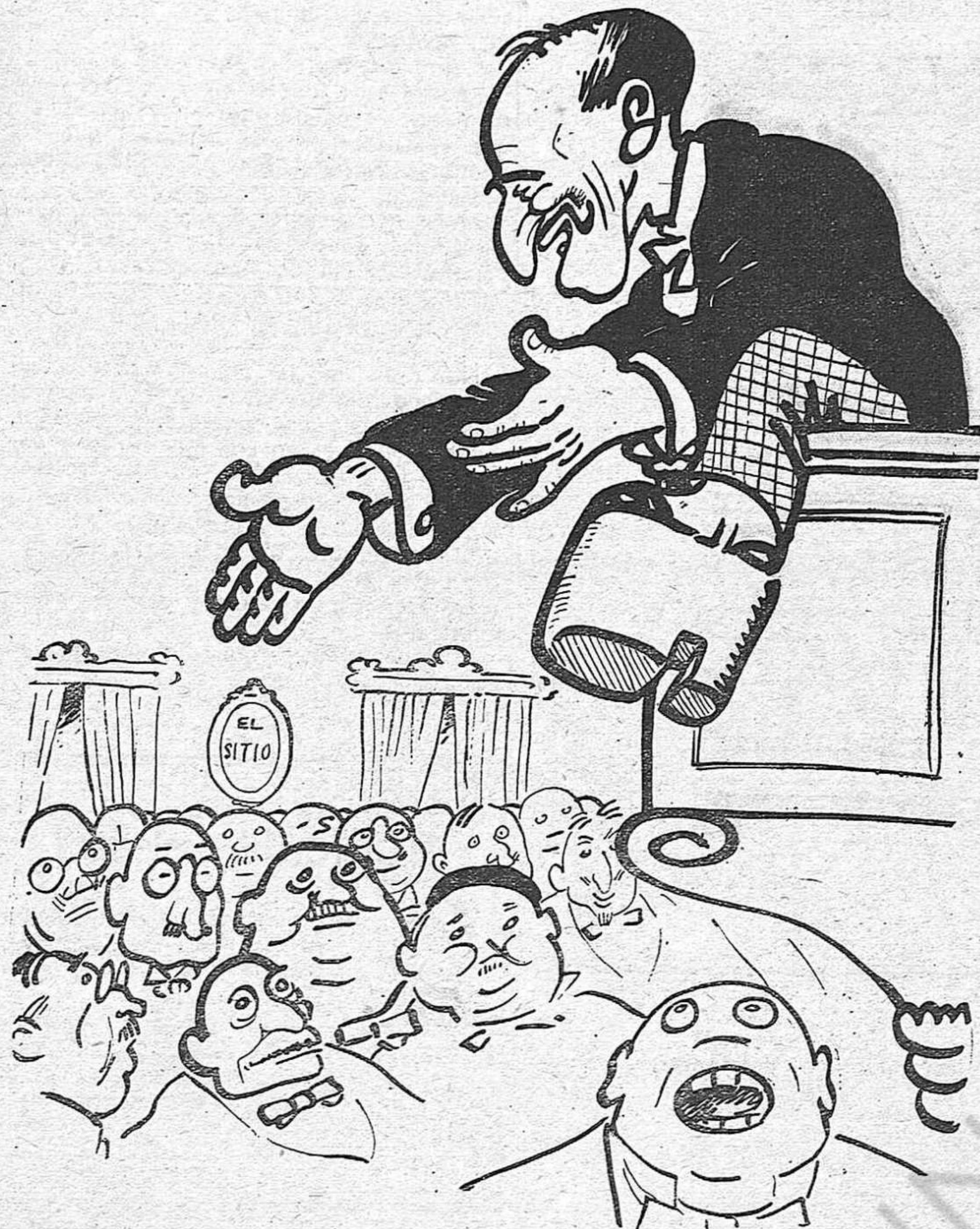
—Jo sempre ho dic: per governar Espanya s'ha d'anar amb peus de plom.