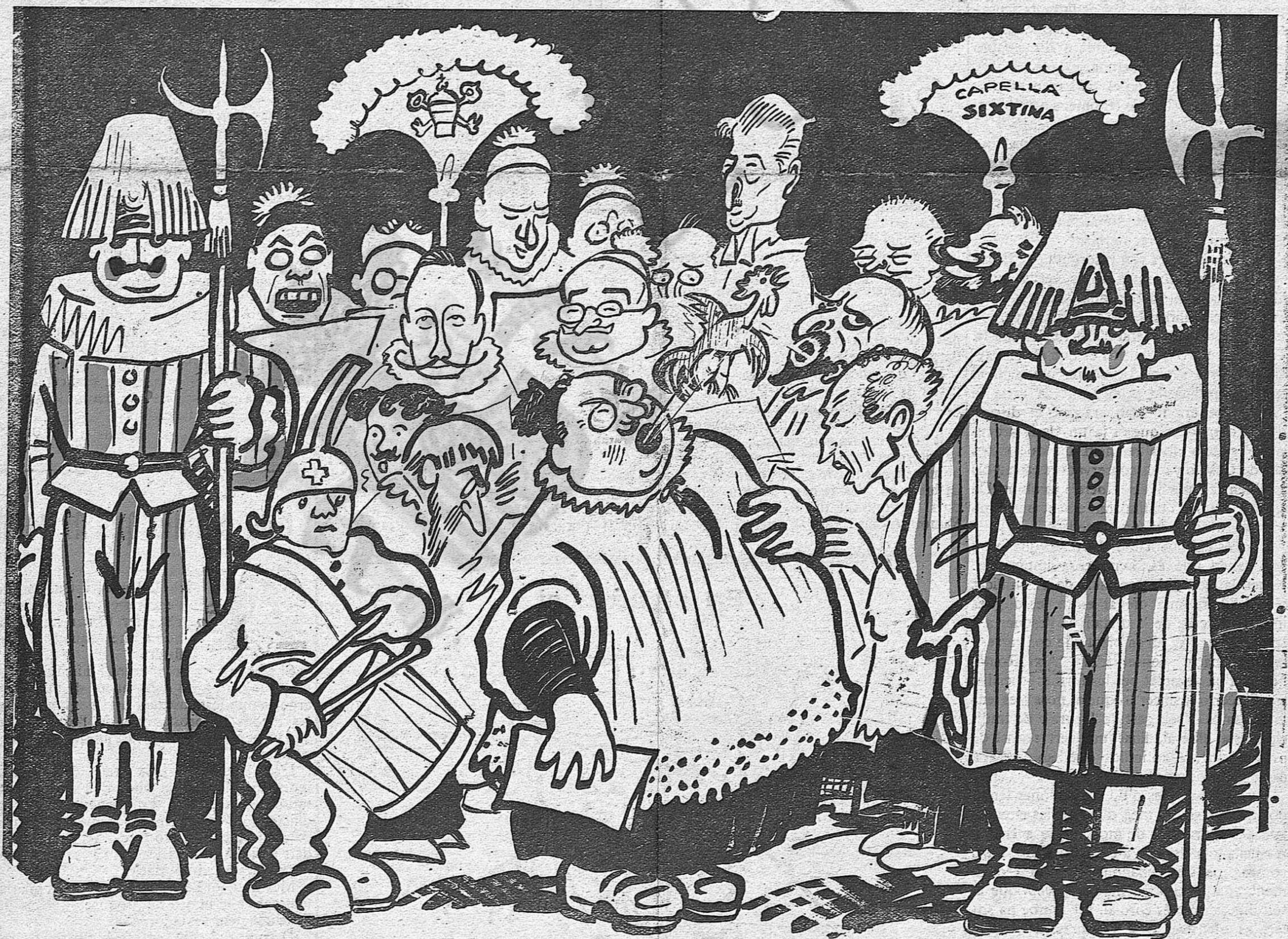
Uns fan galls, altres són muts... — Vaia uns cants més pistonuts!