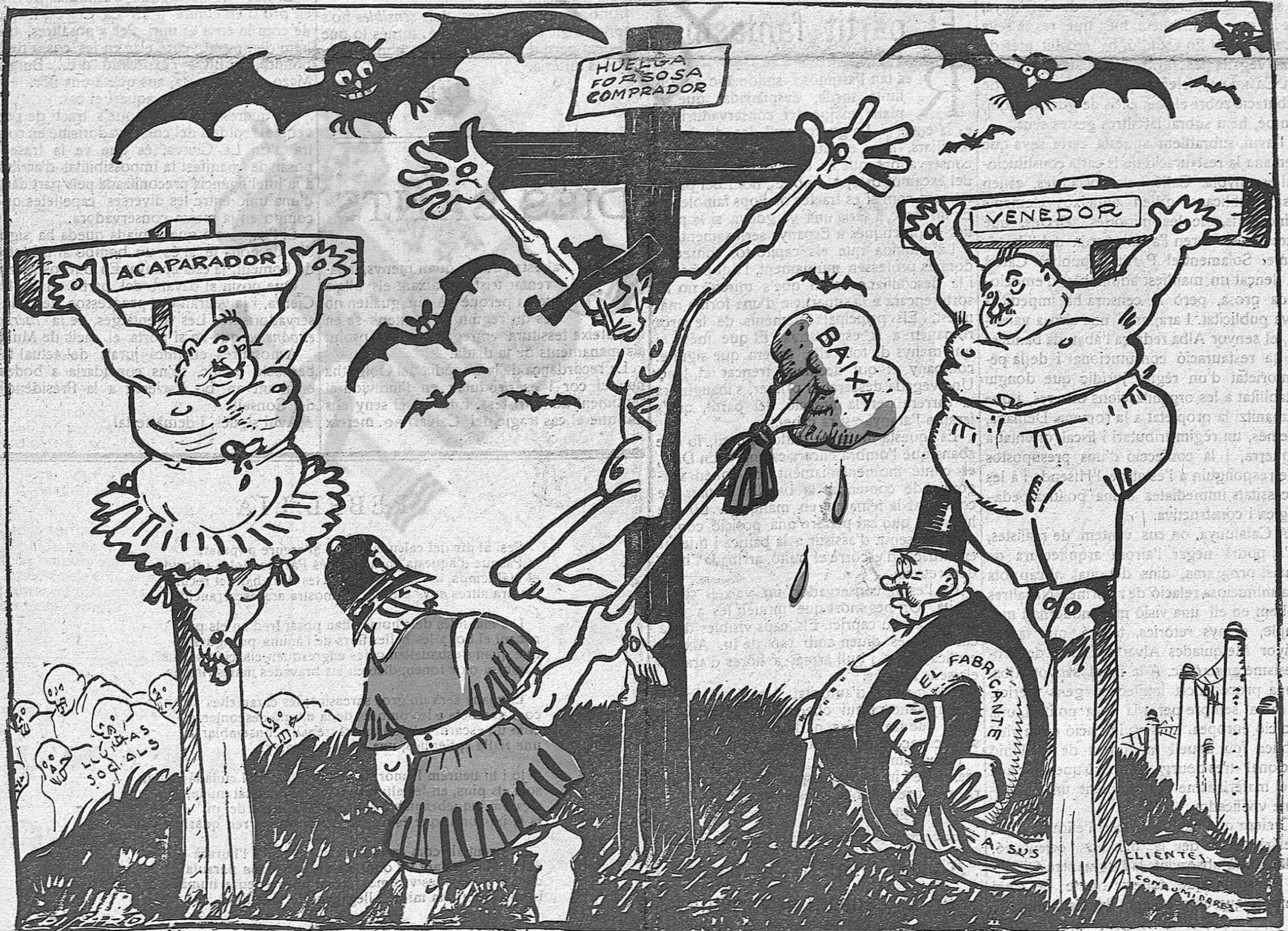
Les tres creus del Calvari