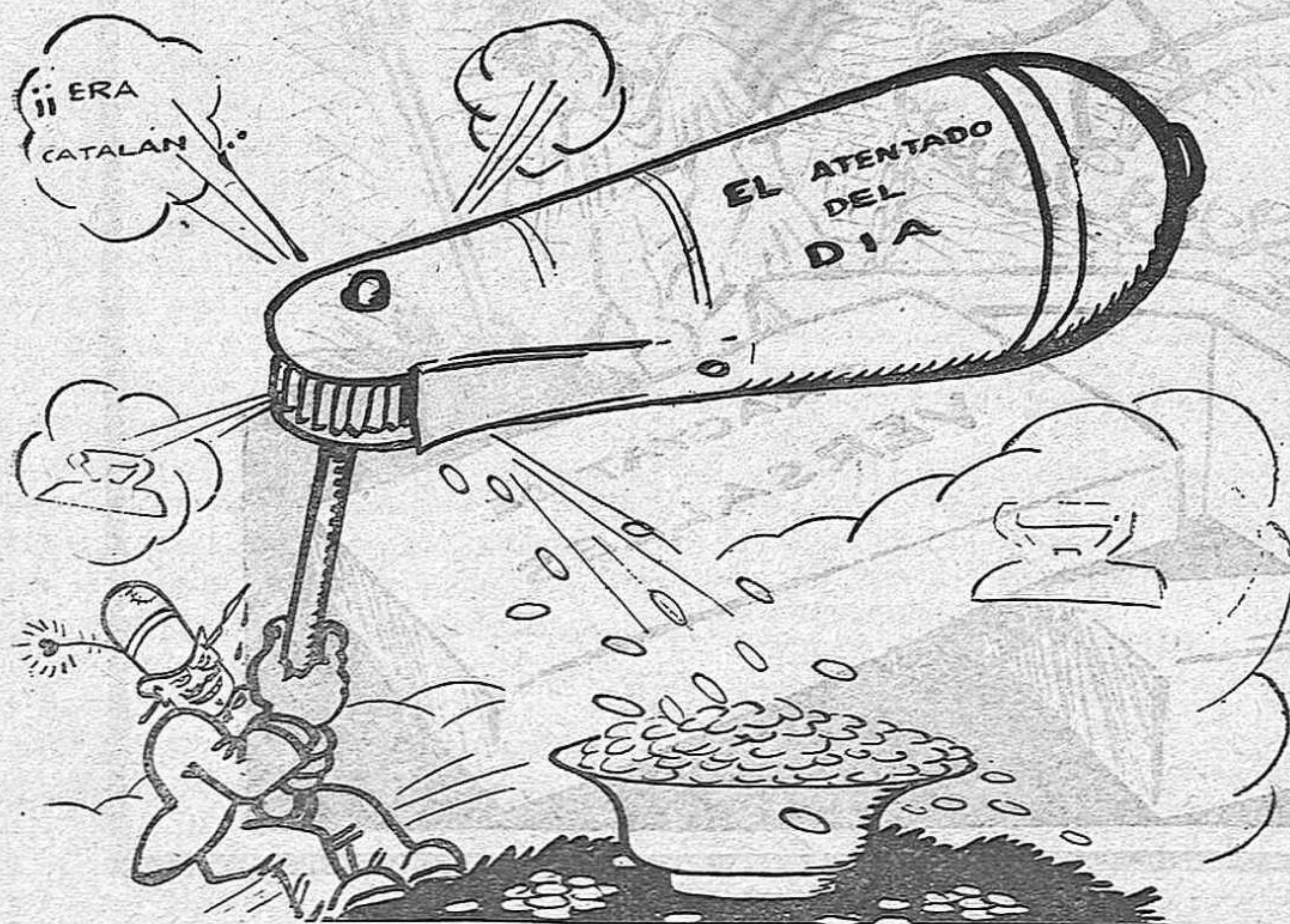
El xarrac miraculós