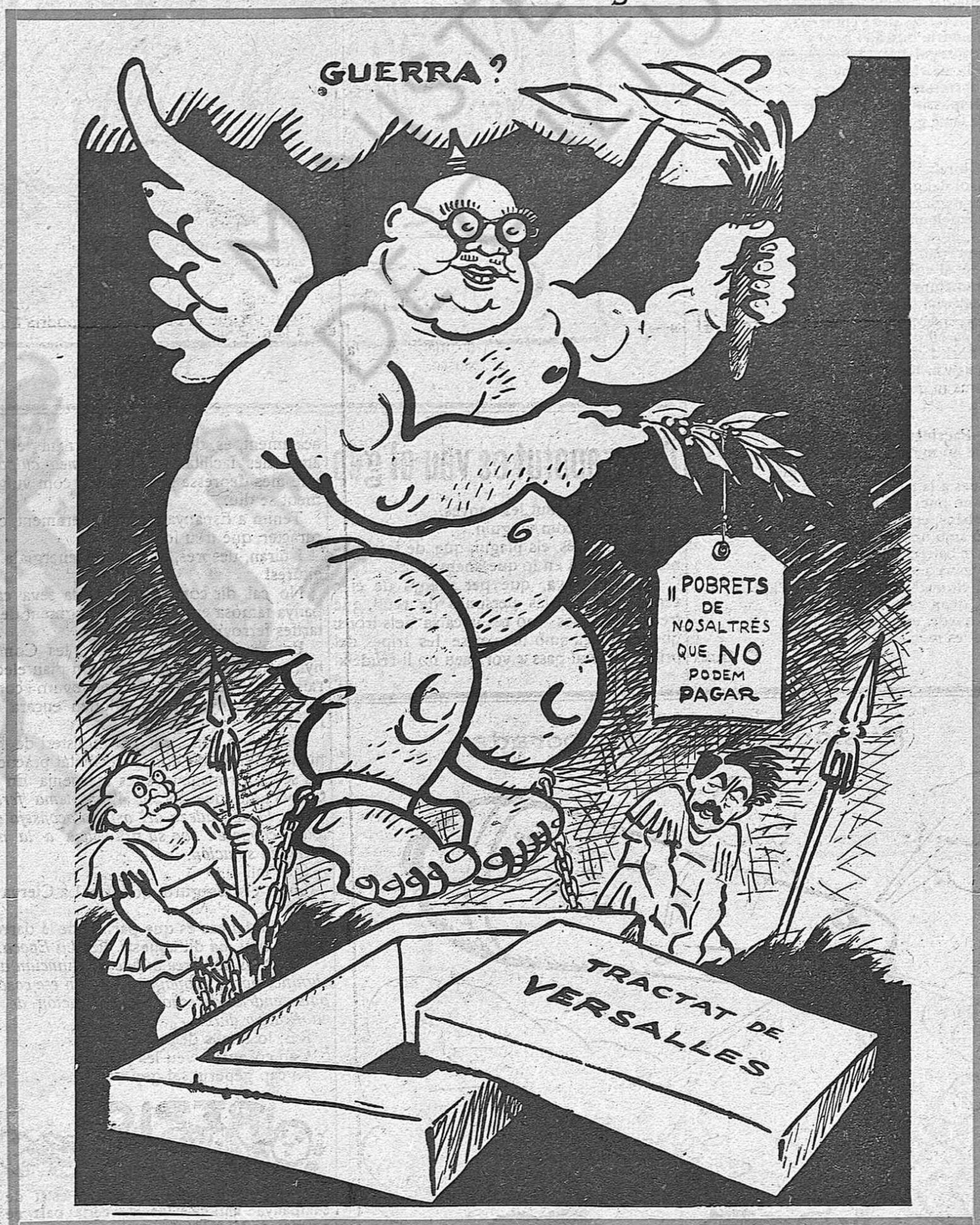
El que voldria ressucitar i no pot