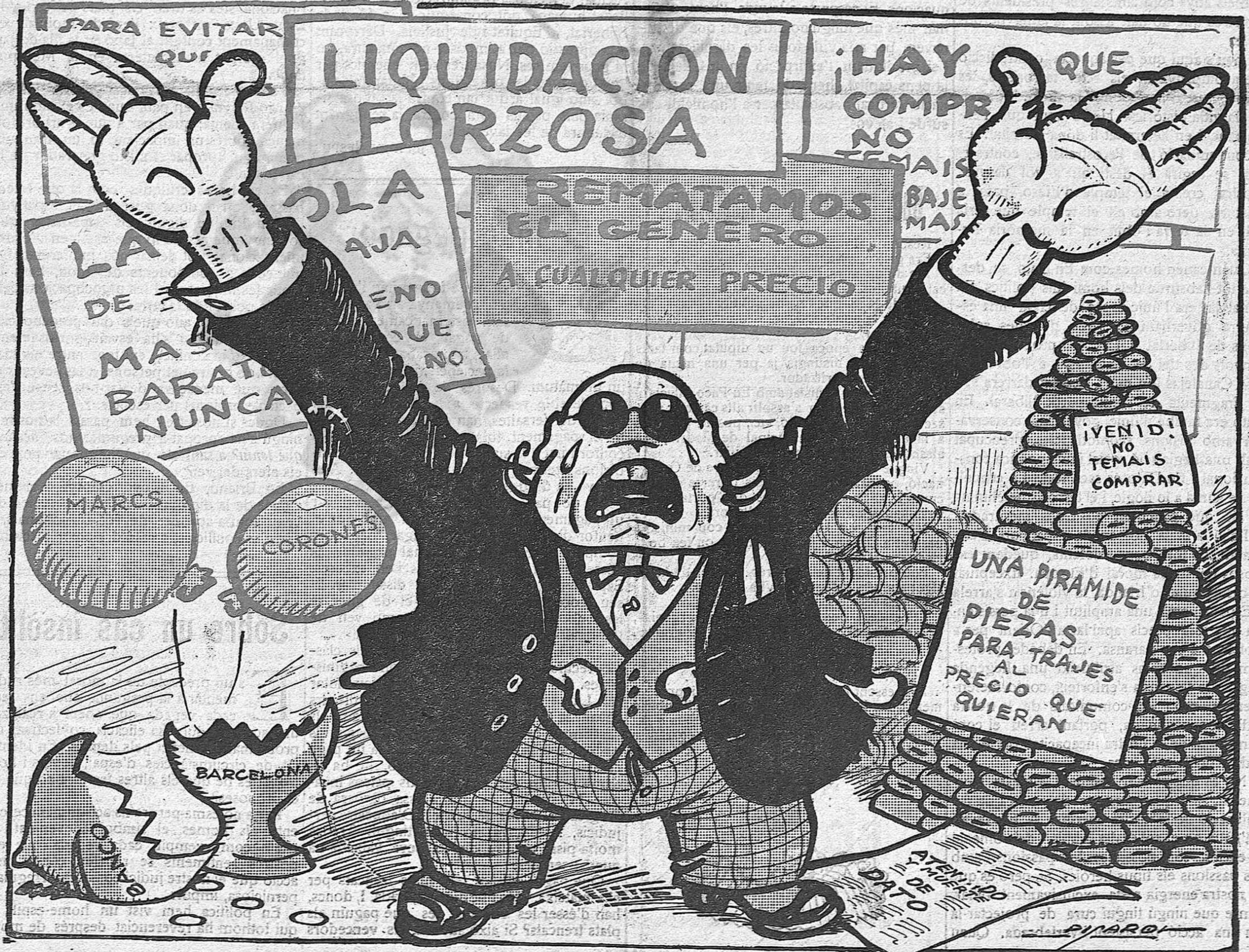
— Si això és la pau,... que vingui la guerra!...