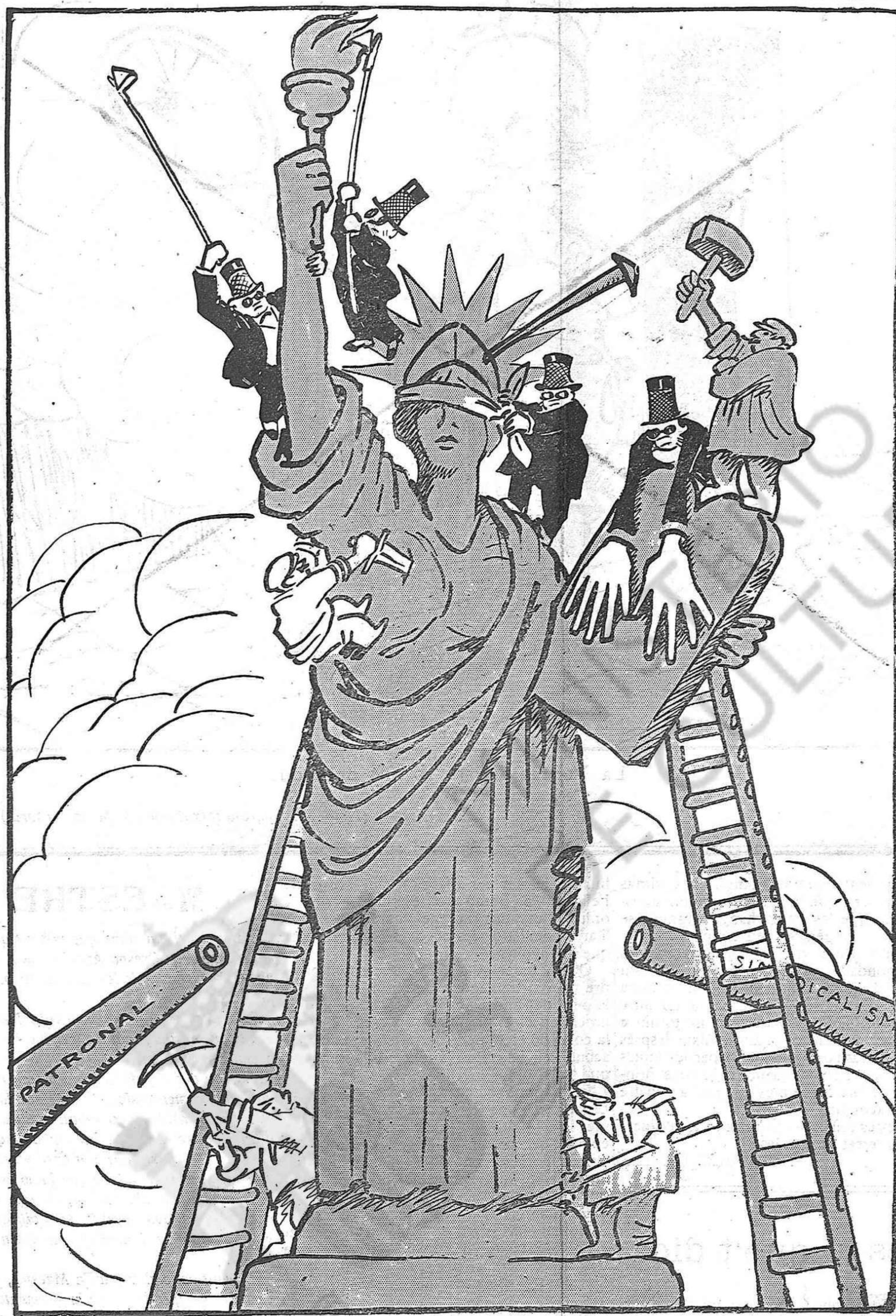
Uns i altres treballant contra la llibertat.

d'aixecà un gran envelat; l'altre preté que a la plassa s'hi construïx una font que hi ragi vi en compte d'aigua; l'altre voldria els «Xiquets», l'altre, «corrides» de vaques, l'altre, que's llogui a la Meller, l'altre... En fi, una saragata que se sent d'una hora lluny, però cap idea pràctica ni res que s'aparti un xic de les coses rebregades i vistes ja deu mil cops per tota aquella comarca. —Senyors—dú el batlle:— cal que'ns decidim. El temps passa, i si anem seguint així, vindrà la festa, i encara estarem aquí xerrant. Què fem? Au, determinar-se!