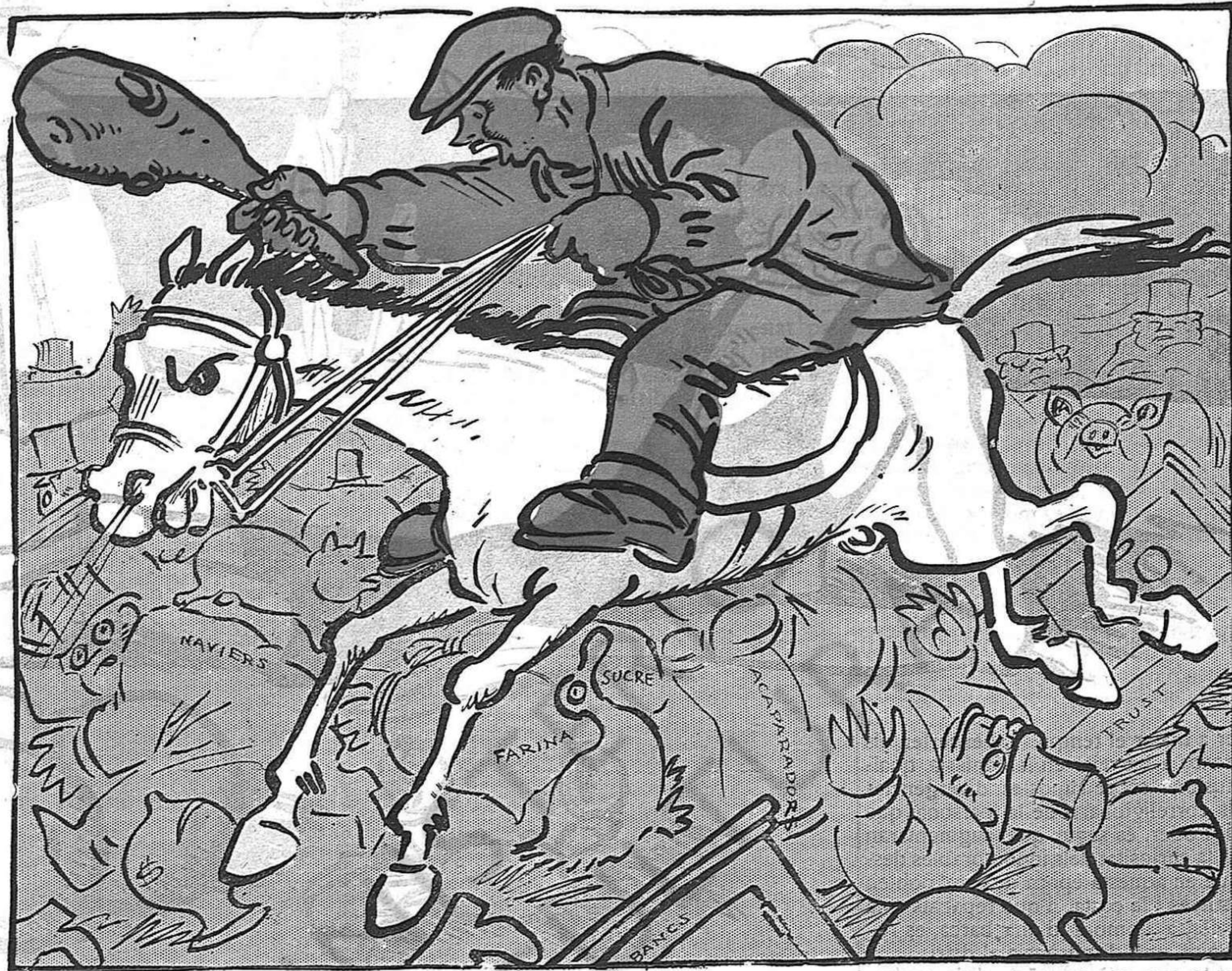
El modern Sant Jaume contra els moros acaparadors