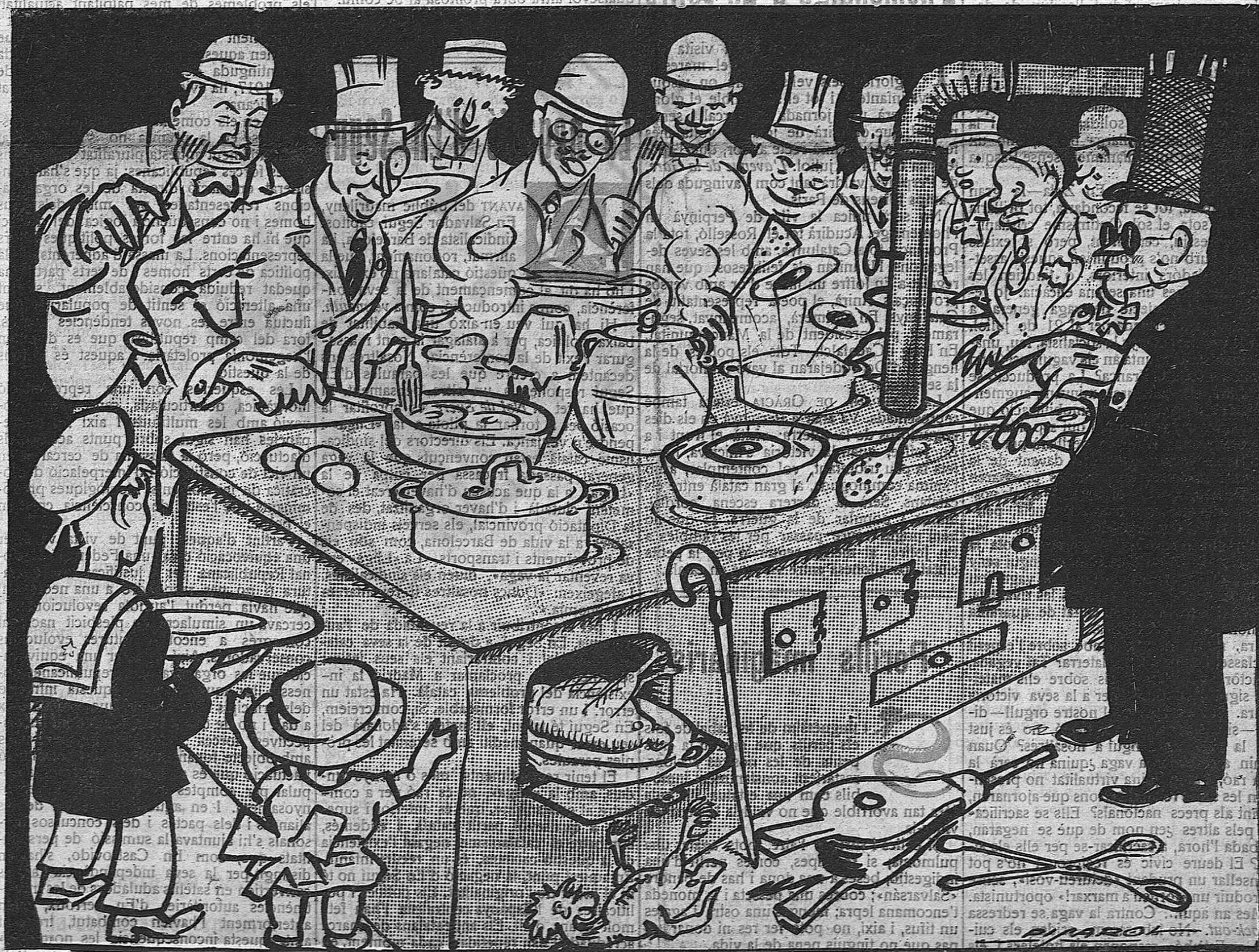
“Si vols estar ben servit — tu mateix cou-te el rostit.”