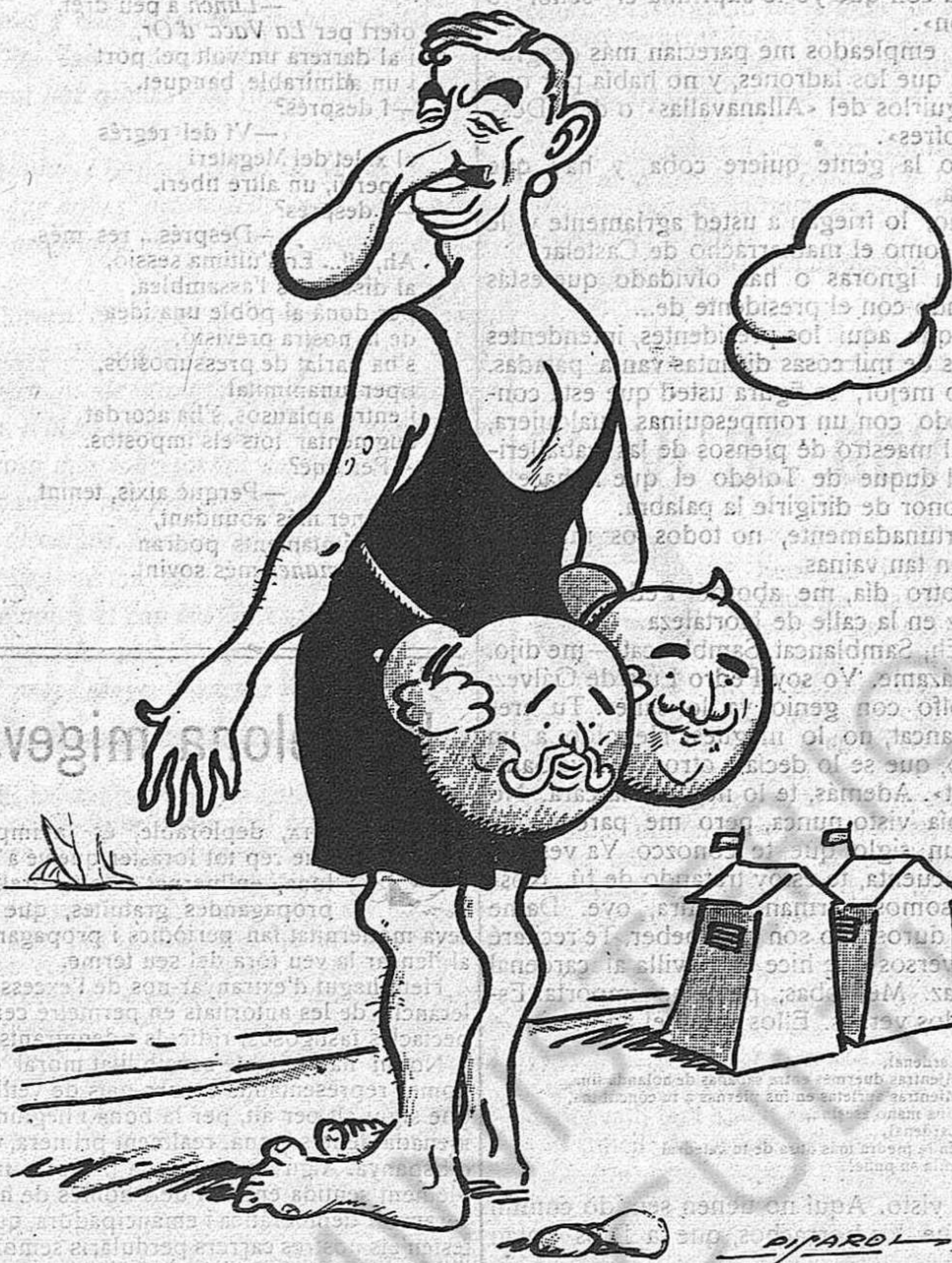
—Jo sense aquestes carabaces no podria nedar.