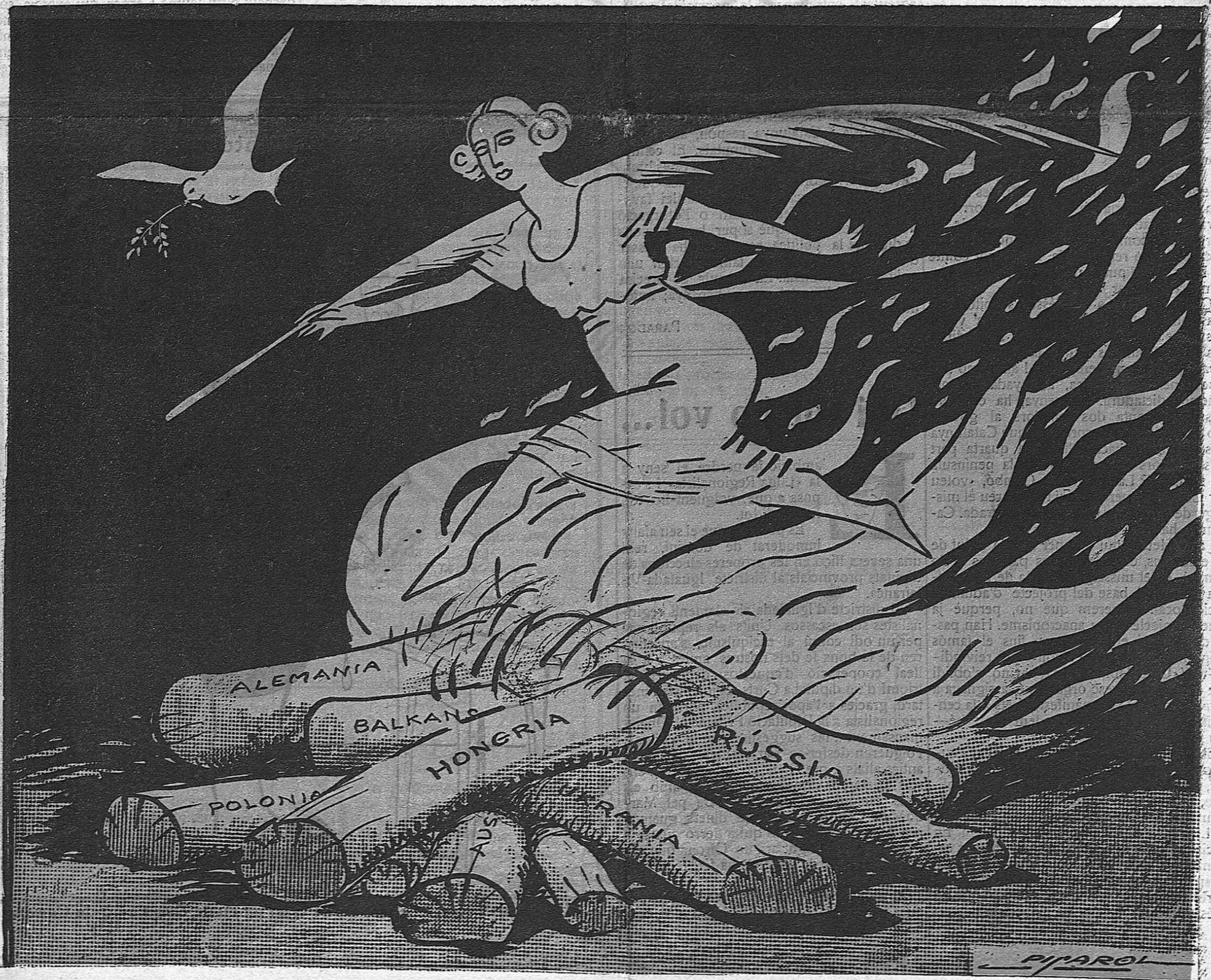
La Pau.— Ja ho sé que encara hi ha flama viva, però... què tants romanços, jo'm decideixo a saltar-la.