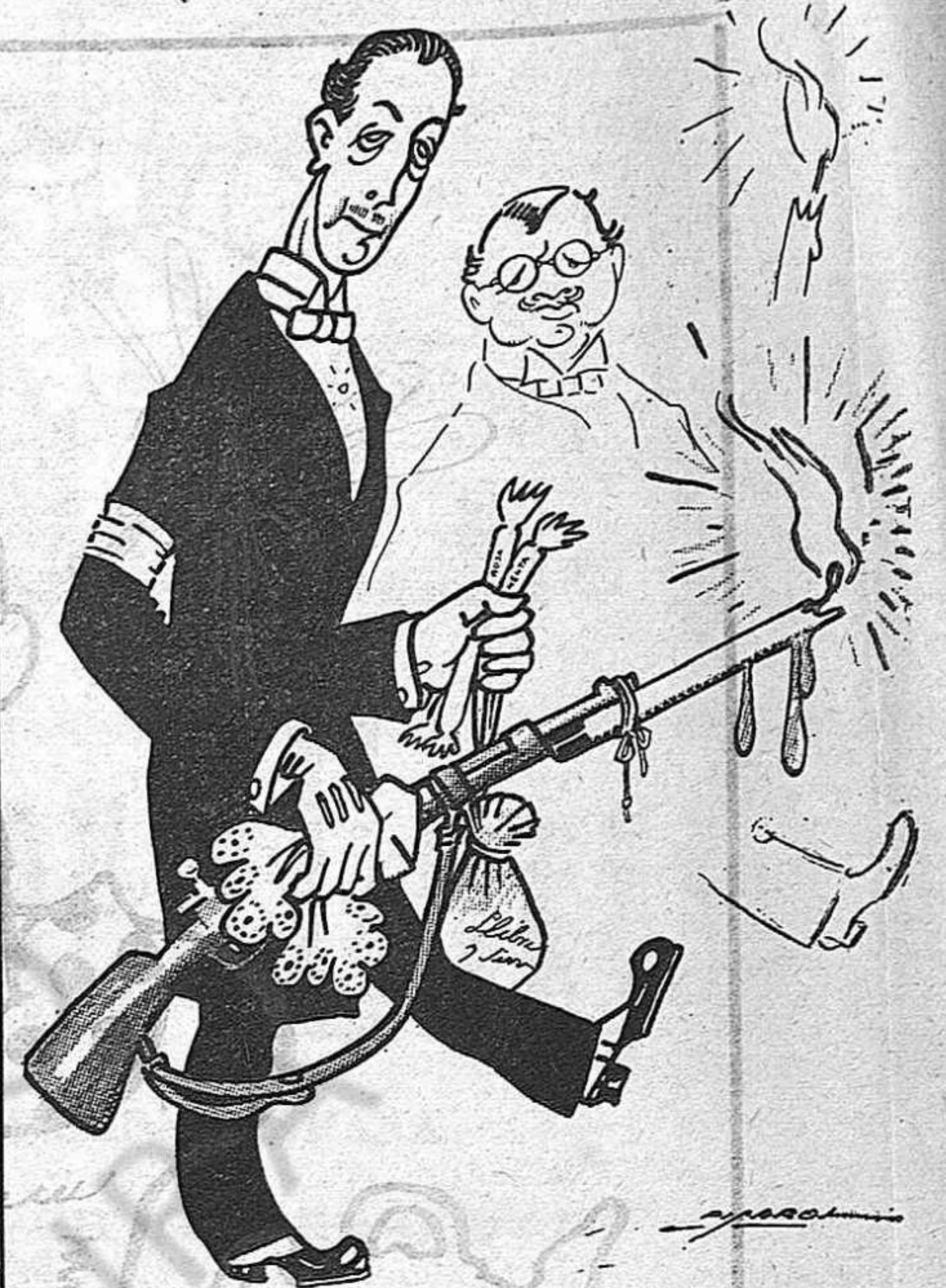
—Amic de les tradicions, primer faltaré a la dona que a les santes processons.