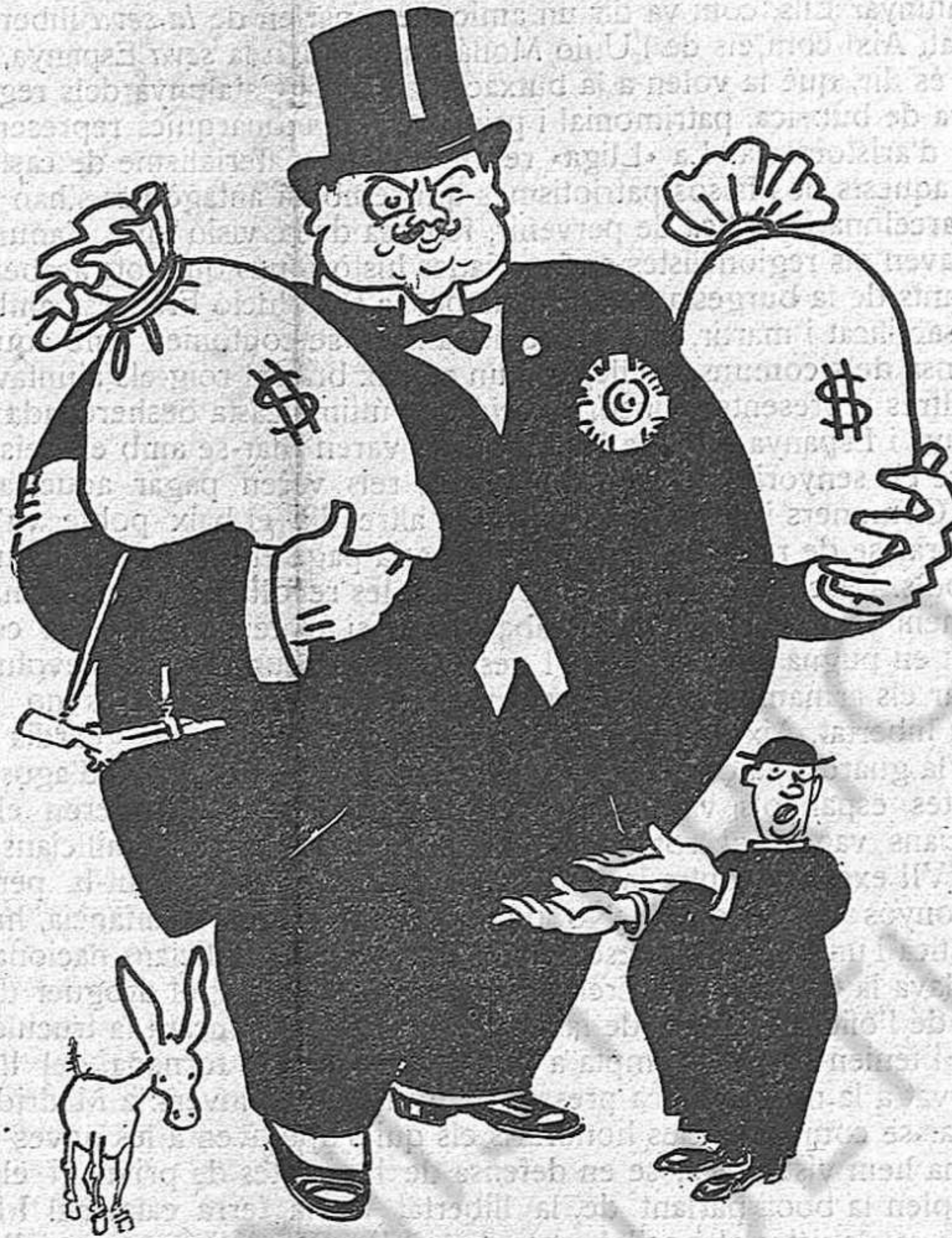
Fe en el somatent... i vinagre per vendre

perdut, amb això, un element de prestigi que hauria pogut ésser així com una espècie de voluntari d'Àfrica de les Exposicions, i en la d'Elèctriques hauria pogut dirigir la instal·lació de retrospectius.