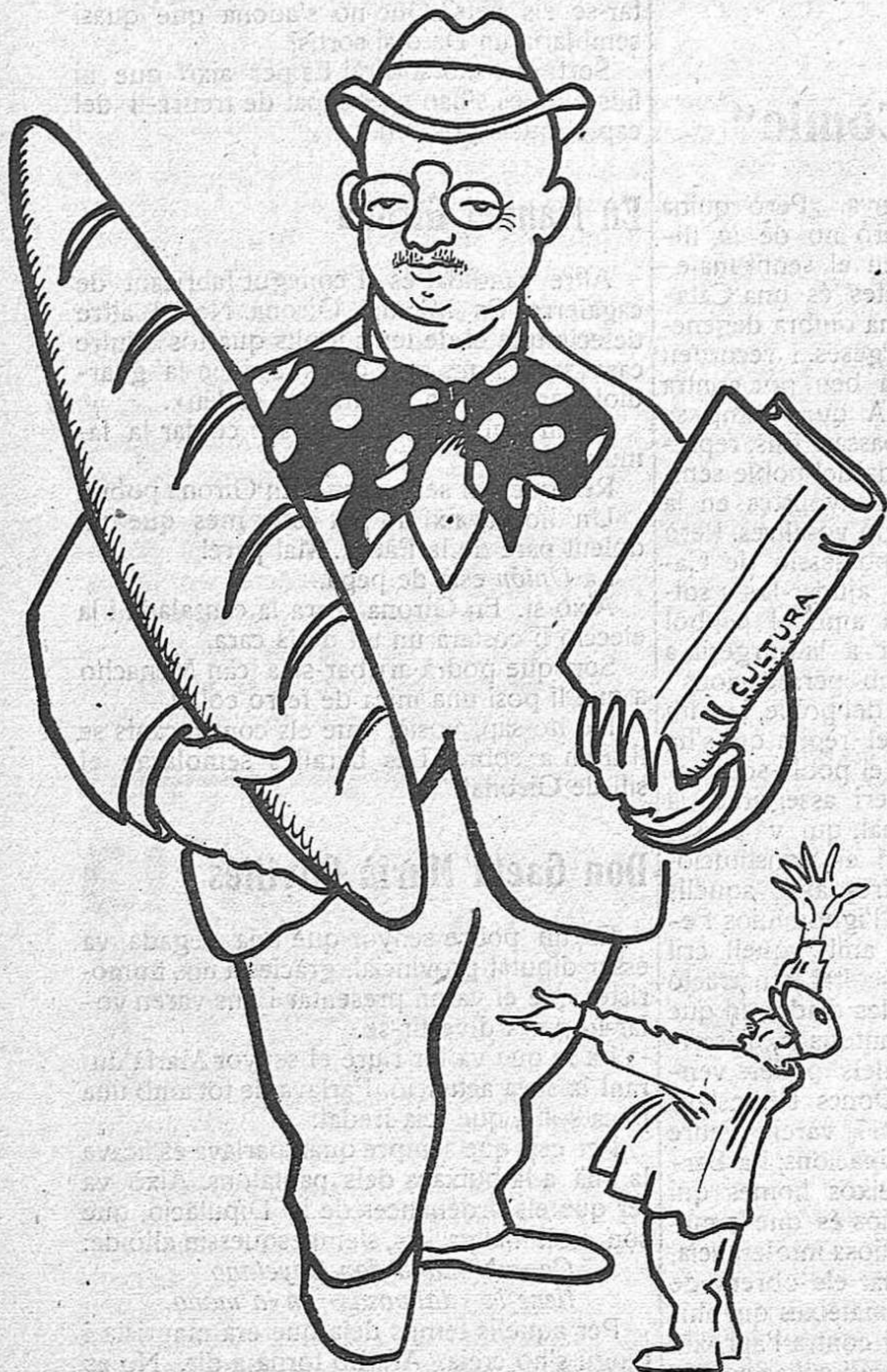
Pa barato i cultura a dojo