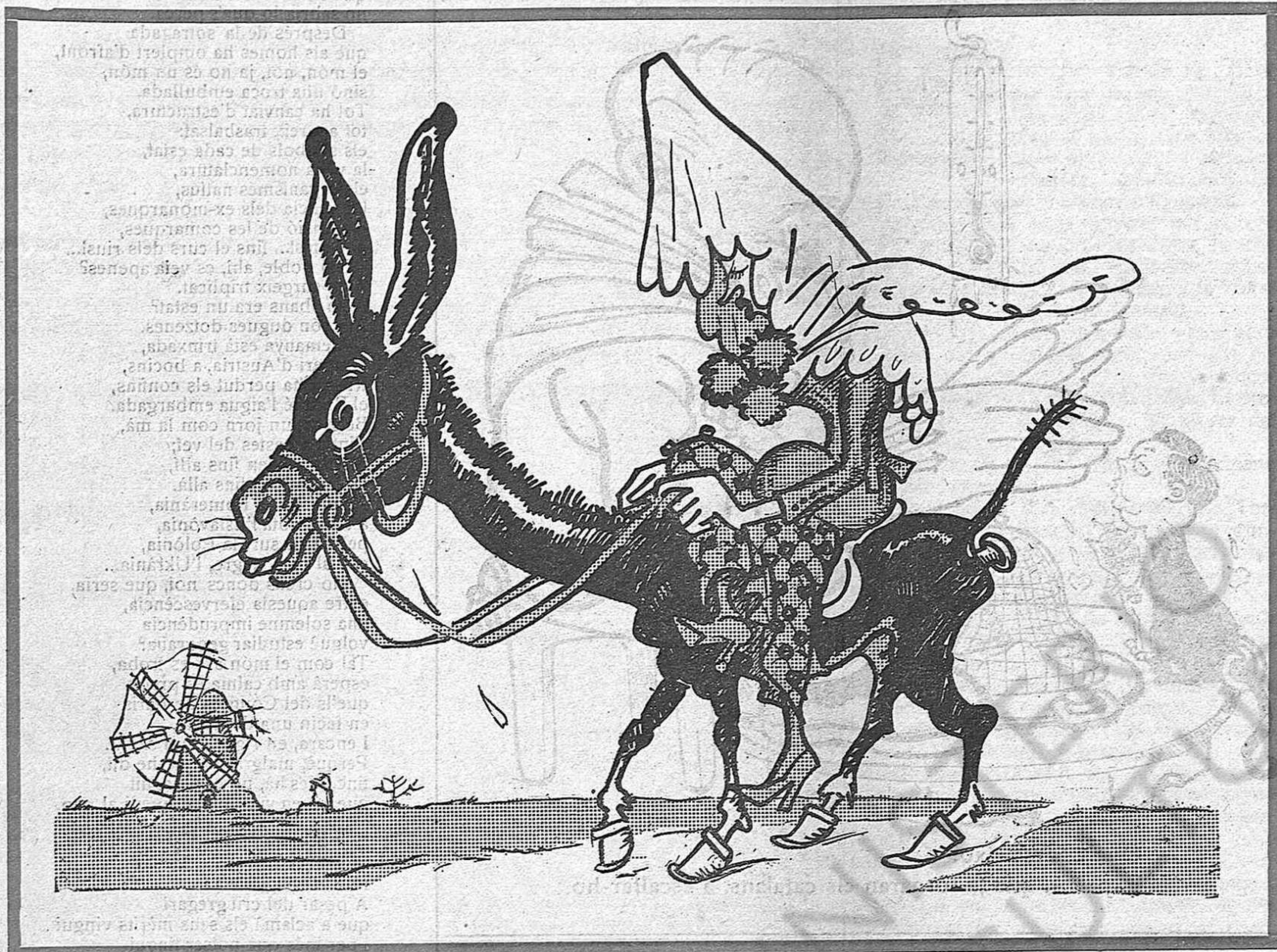
«La nieta de Malasaña»

idees del dia. Més un fet de protesta i des- preocupació per coses que no causen cap entusiasme ni estimul, per considerar-se caduques i innecessàries, que la defensa de una abstracció que ningú sent o al menys que no se li don, ni remotament, la signifi- cació dogmàtica que se preten adjuntar-li per a combatre el moviment d'aquí. Es senzillament un cas de llibertat; i aquesta és tan bona, tan desitjada, que sempre que no hi hagin prejudicis interposats, la vol tothom, per petita que sigui, per limitada que estigui a un sol ordre, a un sol aspecte de la total, i en el cas present, precisament per això, perquè és limitada, perquè no agafa més que un petit sector, que no té més que relacions llunyanes amb l'aspecte global, és que s'hi està unànim en alcançar-la, sense discrepàncies entre els partits i tendències, puix el que menys sentirà simpaties per aquest moviment, o bé no se'n cuidarà per tenir sa mirada fixa exclusivament en un ordre més gran i complet.