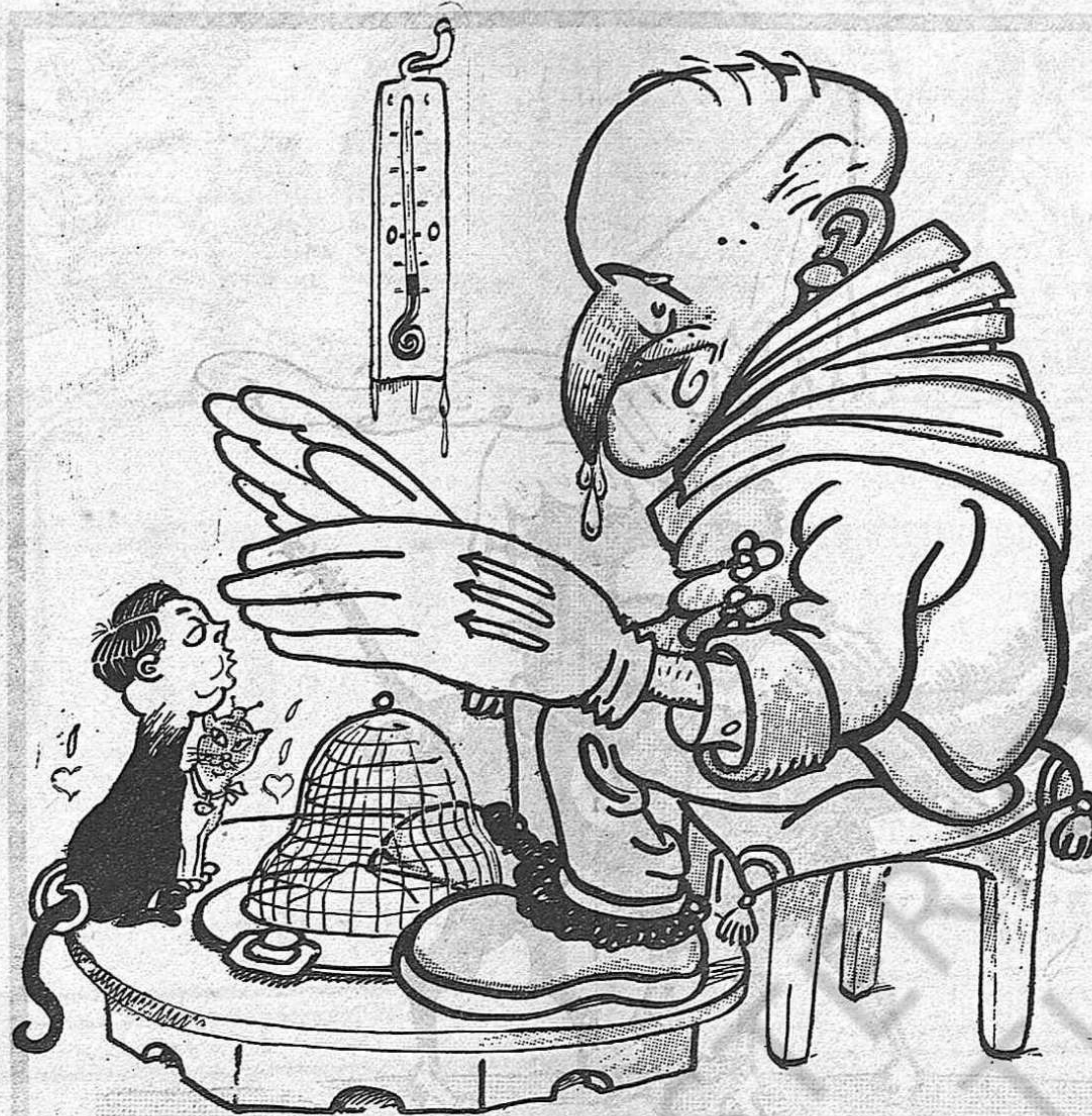
— Que és fret això! — Esperis, que ja tornaran els catalans, a escalfar-ho.

per la deliciosa sessió del Congrés on el cacic màxim de la província tingué el valor de presentar-se a defensar-se ell, i defensar sa actuació de cacic, a ensenyar a tota Espanya la podridura d'un districte que vé a ésser la reproducció de casi tots els districtes del regne.