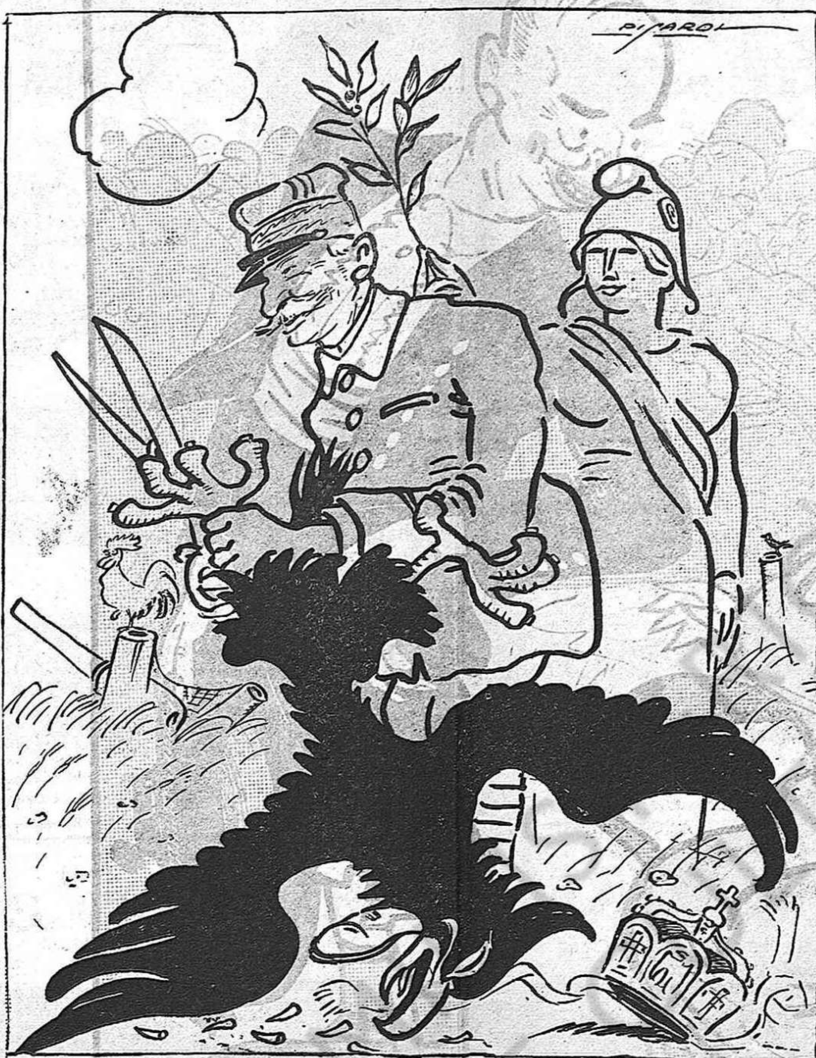
—Deixem-la sense unglots, que aixís no hi tornarà.

no dubtant de que la força bruta, guanyaria; tú, qui abocaves les injúries, les mentides i els insults a raig fet, damunt dels pobles que donaves per difunts; tú, el valent, el patriota, liberal de nou encuny qui de cara a la pesseta vas a frec a frec del furt, i amb tal de fer guany, no mires en si jugues nèt o brut; tú, el devot de missa i olla qui't vendries a Jesús més barato que'l venia Judés; son deixeble ful, digues: ¿com t'ho arregles ara per engiponà un discurs que convencí als conterutlis de què encara no heu perdut? Qui't creurà d'una paraula? Què'n faràs d'aquell orgull i d'aquell cinisme estúpid que mostraves a la llum? Creu-me, amaga't. De consciència, de moral i de virtut, per mai més enllac en parlis, ni entre savis ni entre rucs; que'l més tonto et respondria: «ja't coneç que't dius marduix», que'l món volta més depressa de lo que't convé an a tú i algun altre escanya-pobres de la mena dels barruts. Creu-me. Tria els plats més fondos, menja, beu i ronca a gust, deixa't deaviduríes com d'argúcies i d'embulls; sovint palpa't la butxaca tot girant la vista amunt, i encamana't a la Verge protectora dels ganduls.