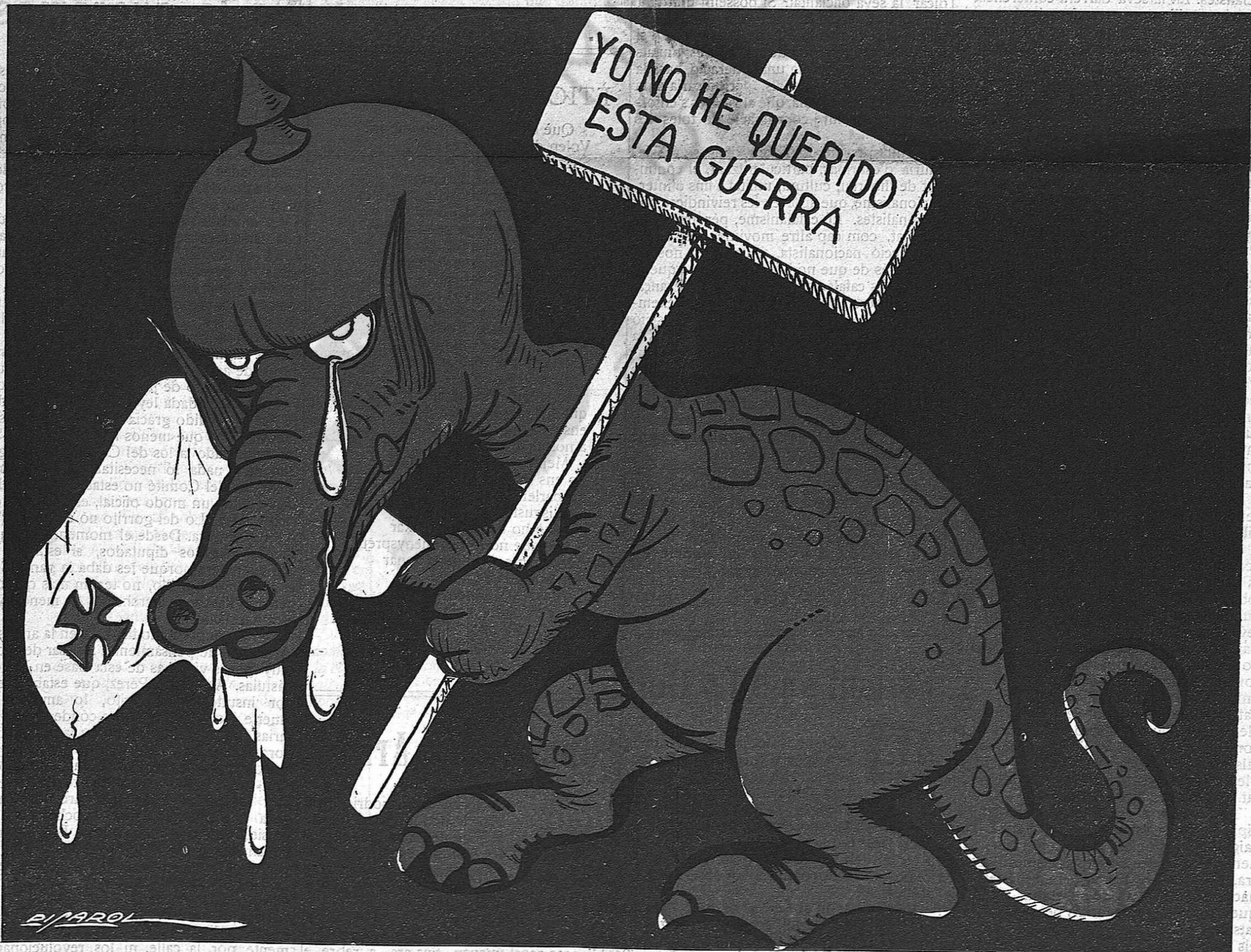
Les llàgrimes del cocodril.

“El Kaiser no ha querido esta guerra.” (De la premsa germanòfila.)