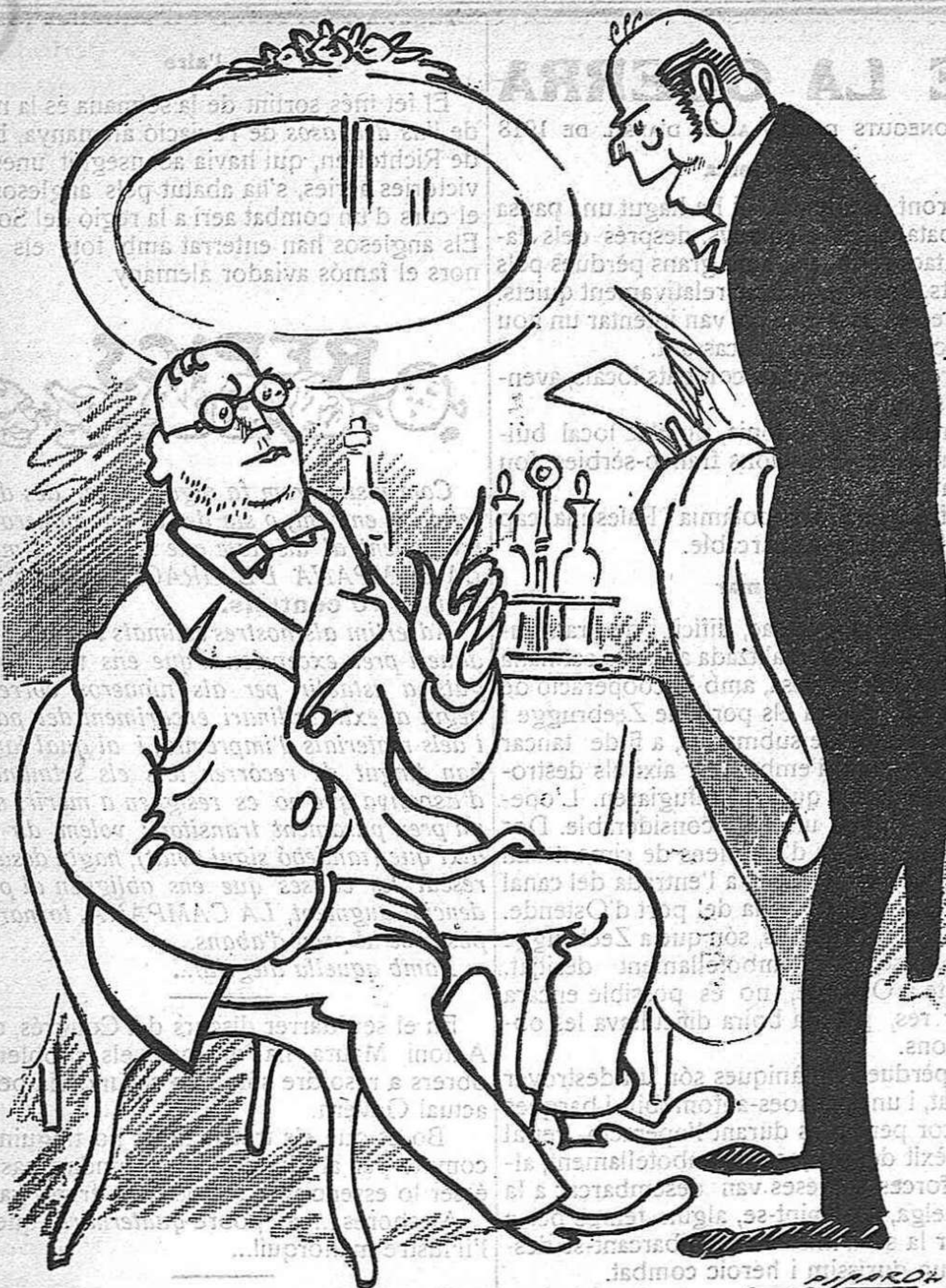
—Quin és el plat del dia? —Barco espanyol a pique.