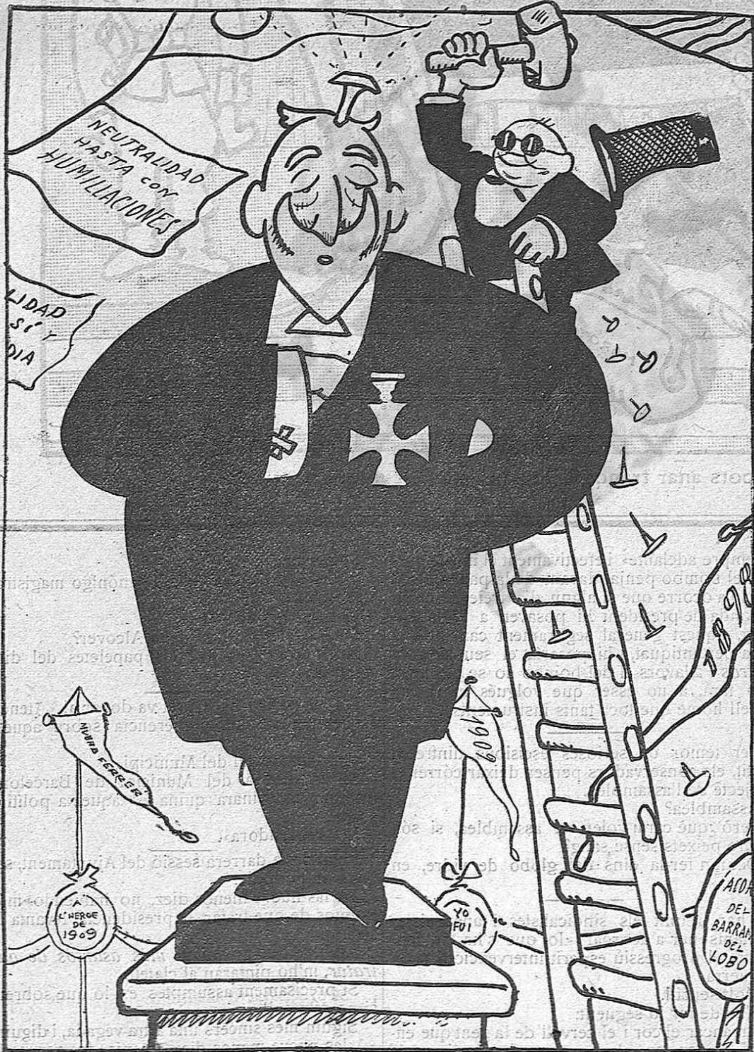
El senyor Esteve. —Bravo, noi!... Te mereixes un clau'...