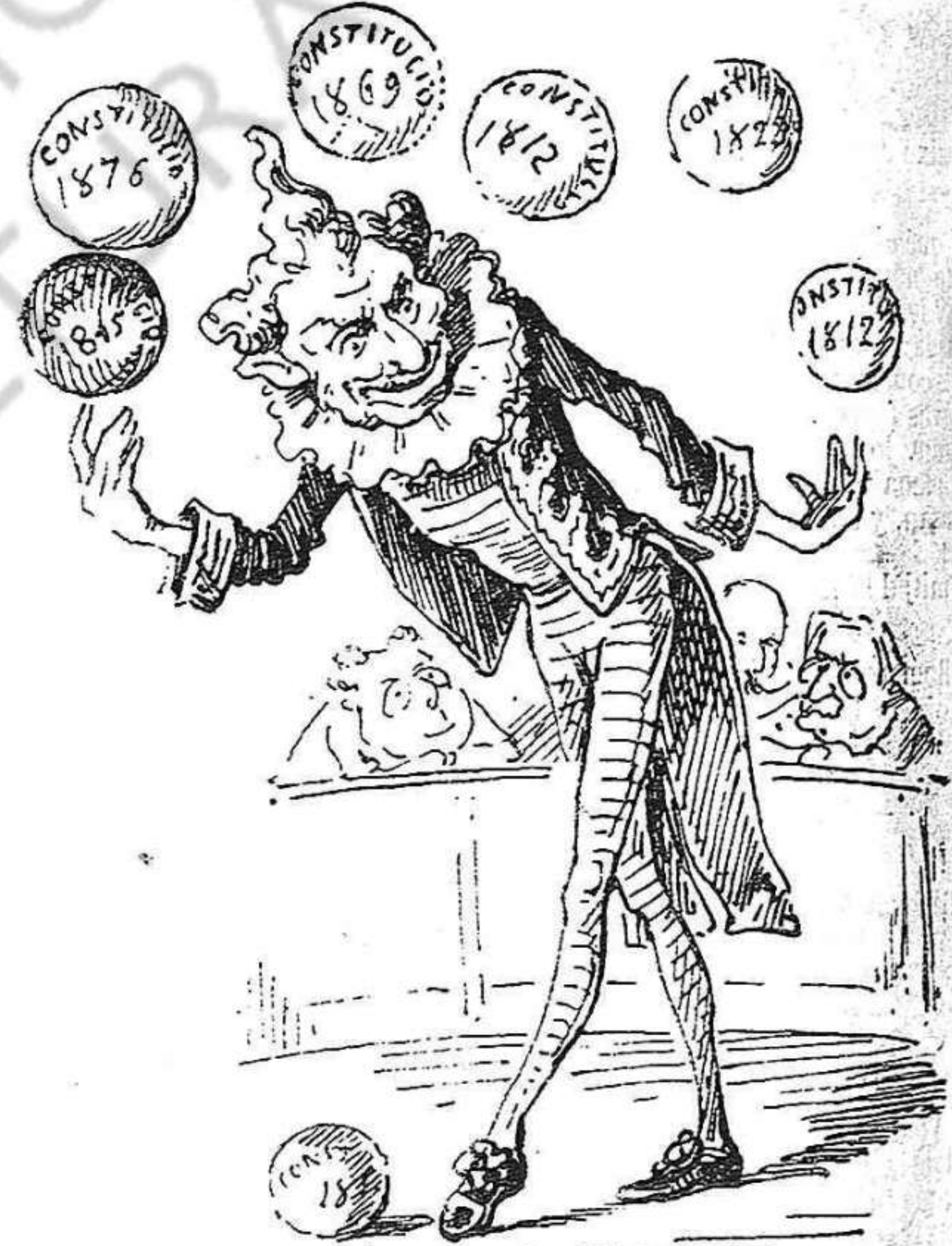
Gran espectacle nacional. Equilibris y jochs malabars.