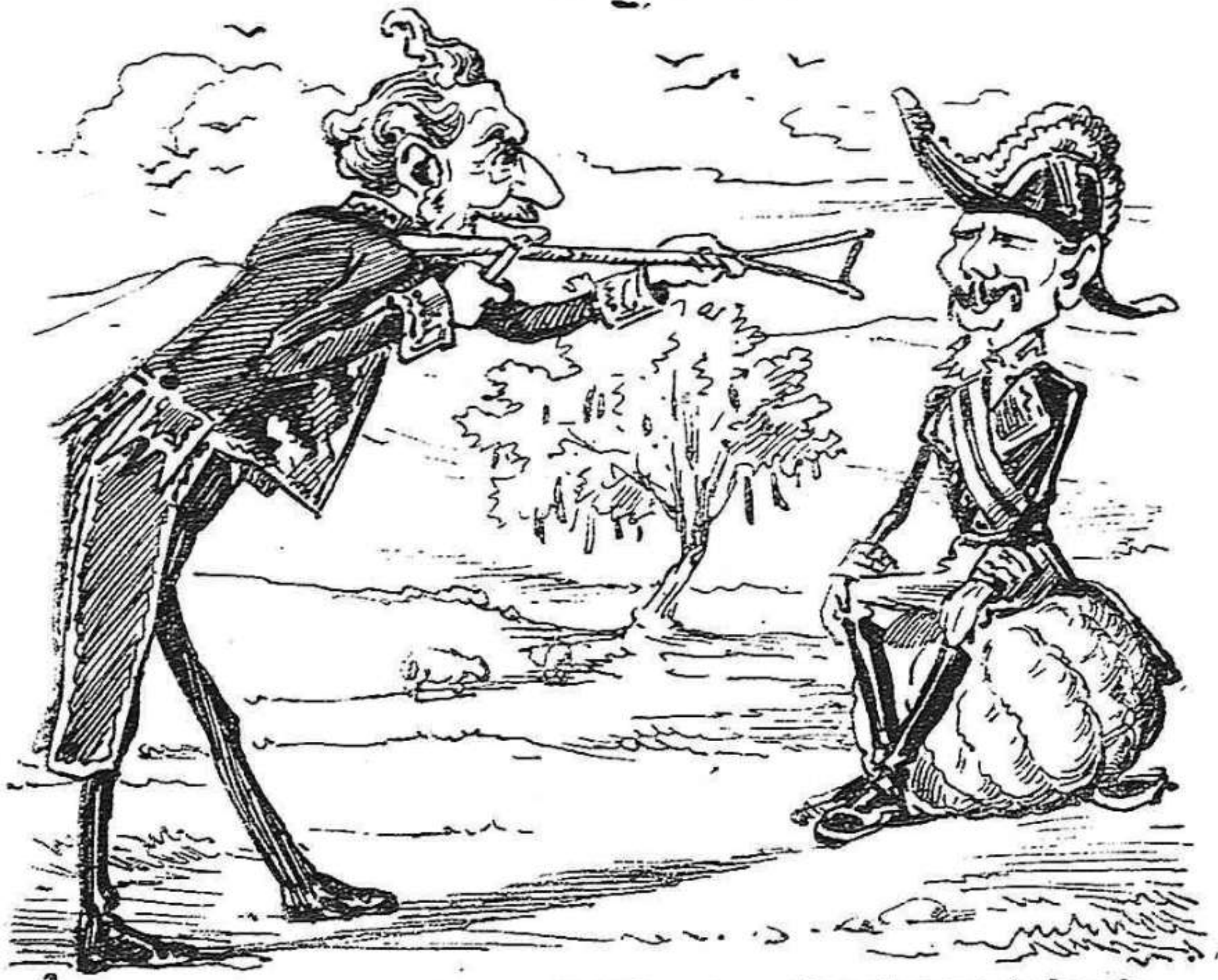
SAGASTA:—Si alló de Sagunto l' hi hagués sortit malament, jo hauria sigut lo primer de fusellarlo. MARTINEZ CAMPOS.—Y hauria obrat molt santament.