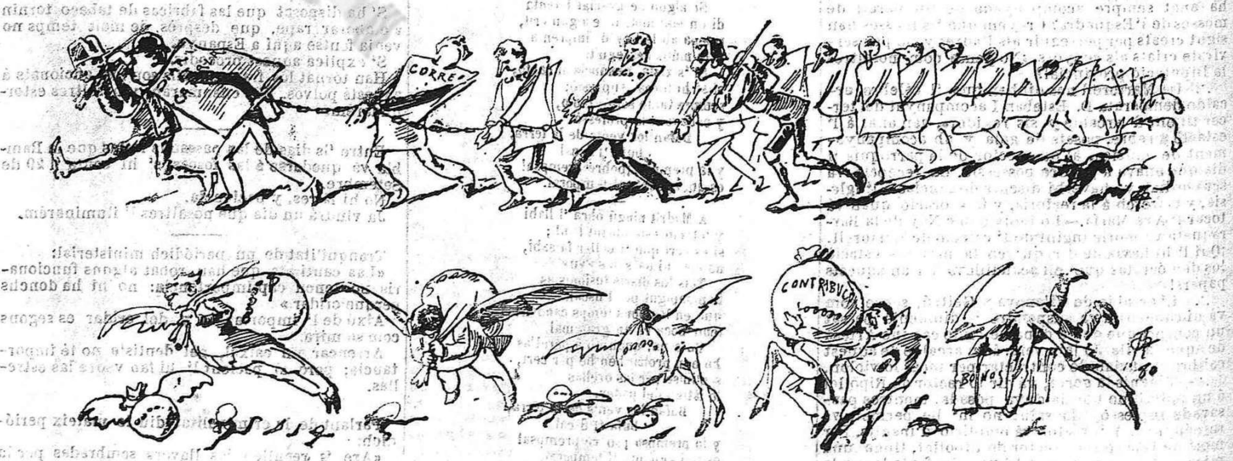
No es tot hu ser periodista de oposició ó empleat del govern!...