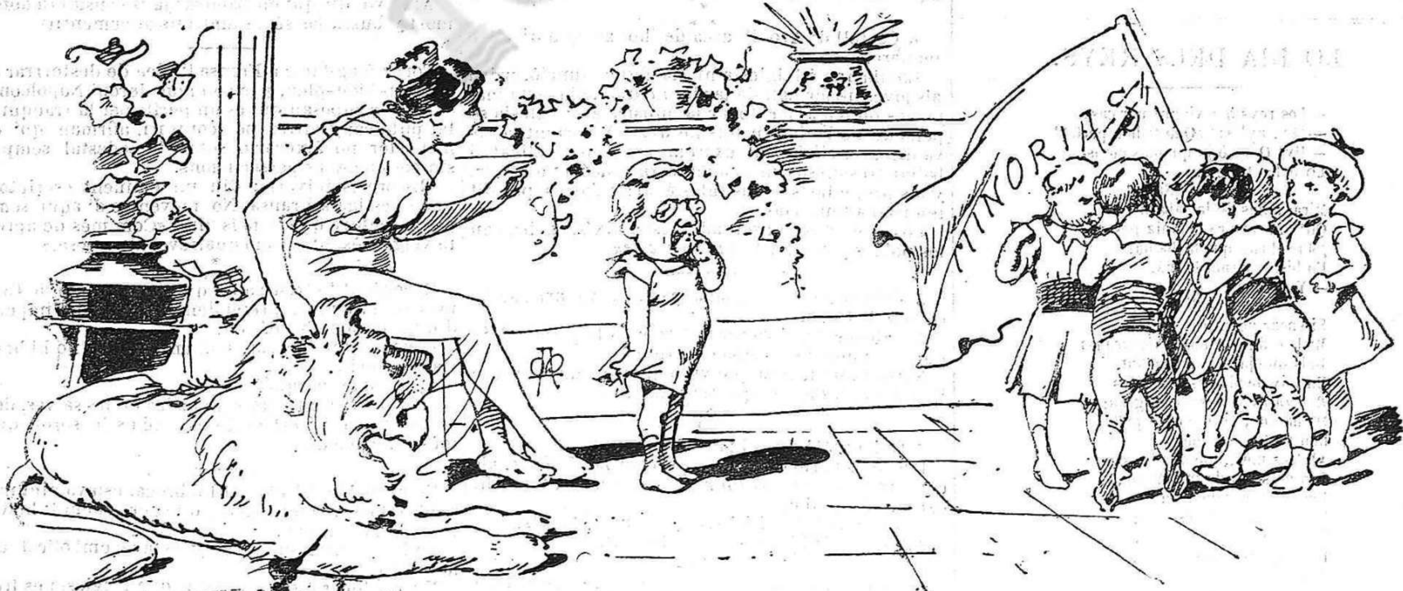
Vaja Antonet demana perdó á n' aquells nens ó sino la mamá t' farà cracrach.