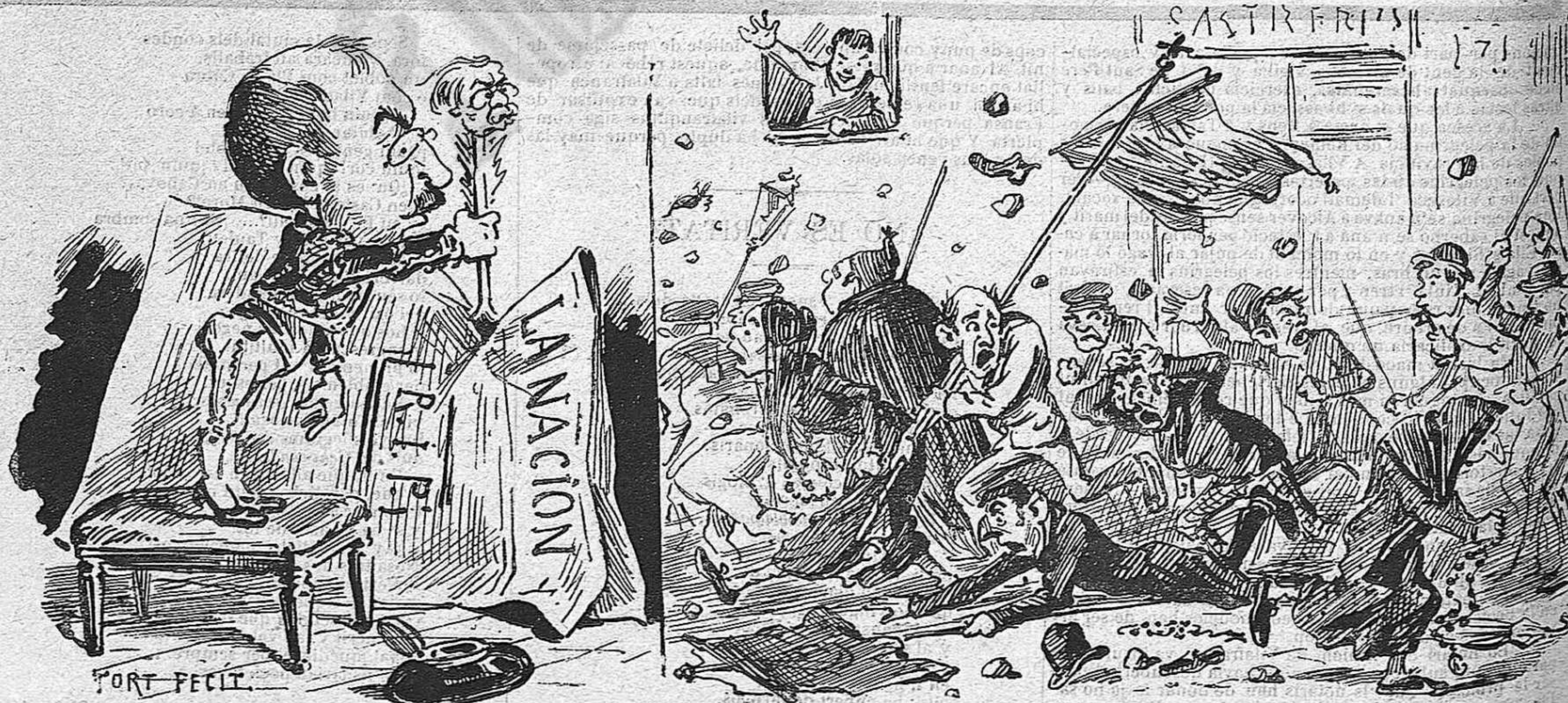
Per primer e-pasa li falta talla; per catxetero, a' pé!