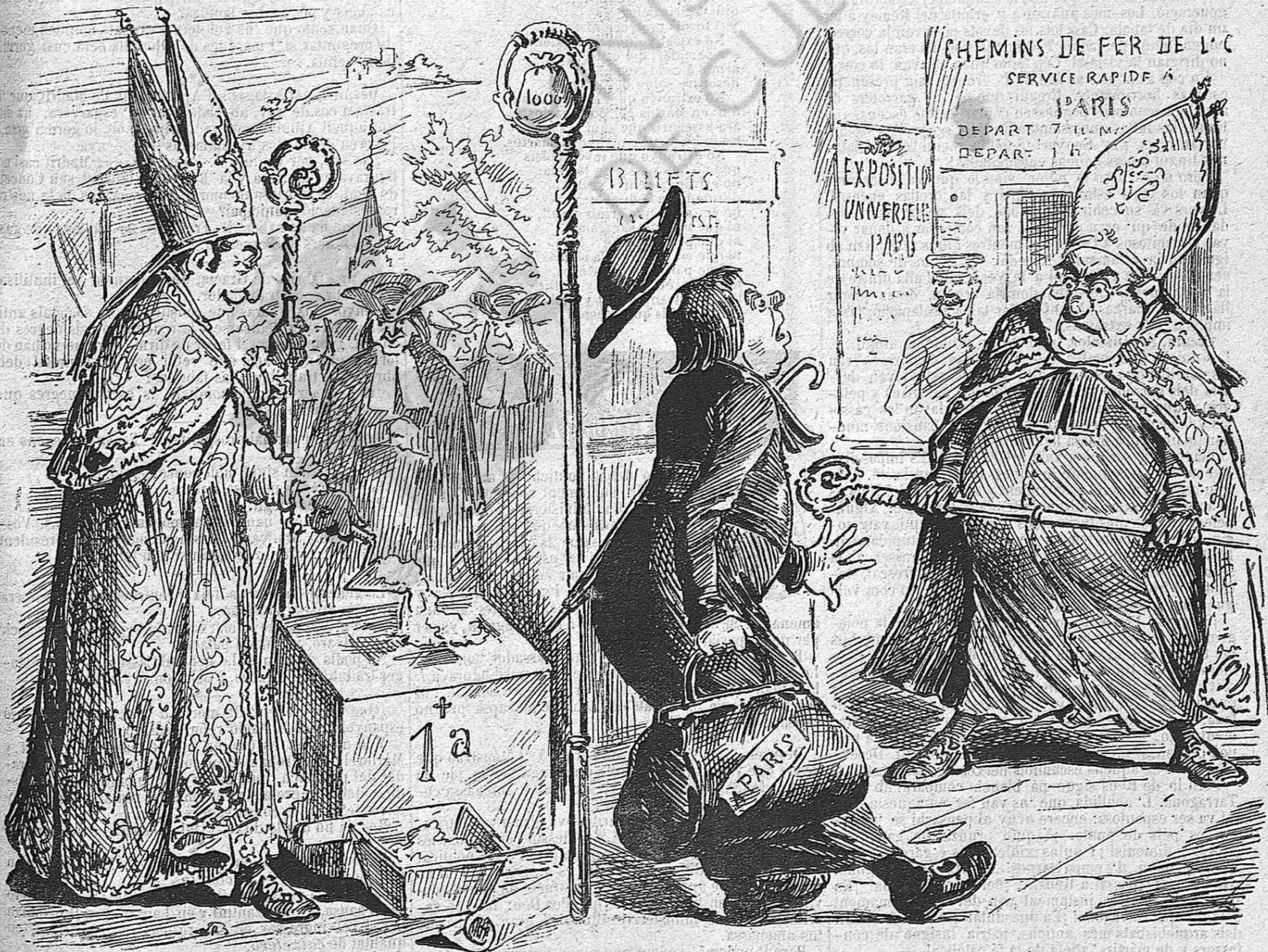
Los bisbes de aquí 'ls fan casas per doná'ls colocació;