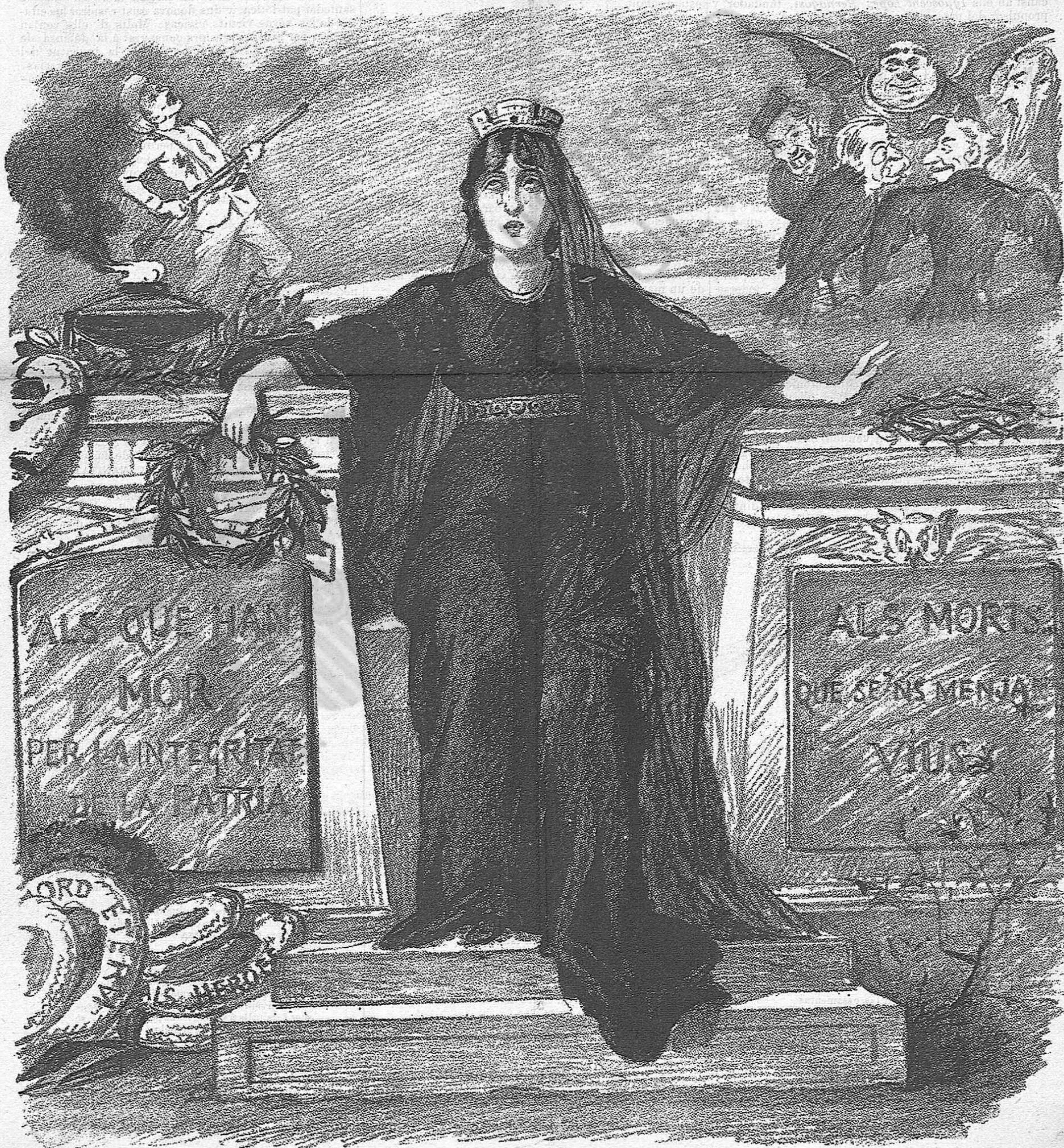
Espanya en lo dia dels Morts