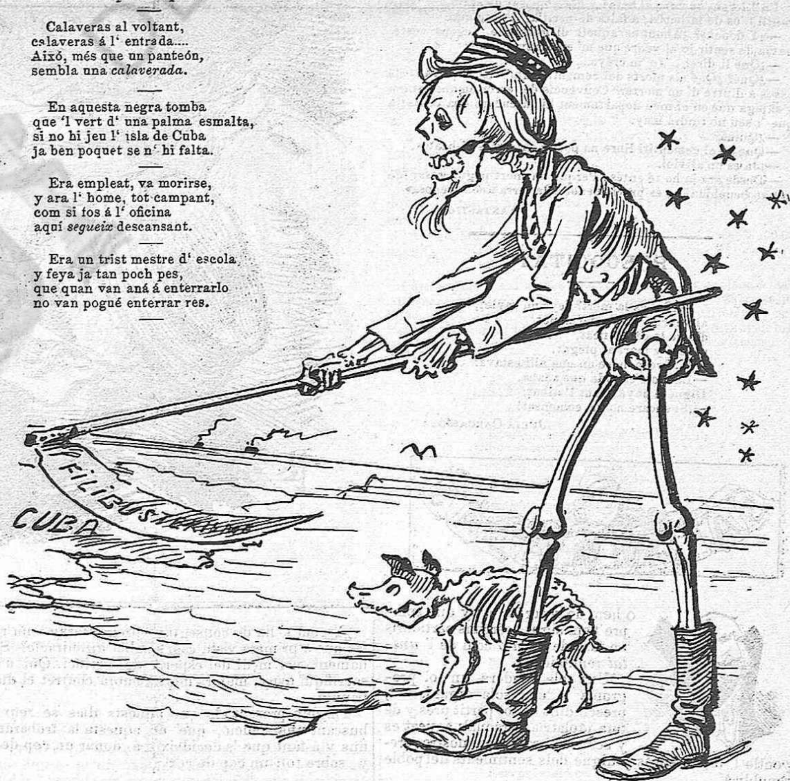
El mort que fa més porcadas.