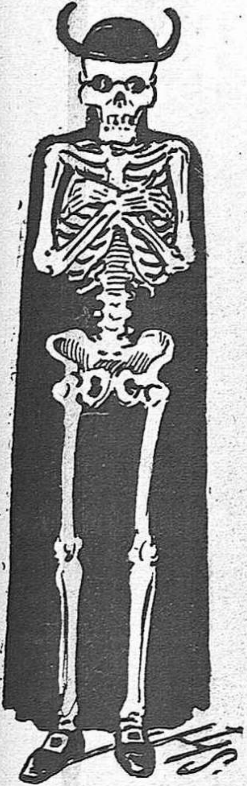
A. M. D. G.

per viure, y sou quatre plagas, ¿qué fariu allavors? ¿qué fariu, papanatas? —¿Sab que aixó potsé es vritat? —¡No ho ha de ser! Las ventatjas que proporcio a la gent son tan grossas y tan claras, que com a resúm de tot dich y diré mil vegadas que si la Mort no existís, fora precis inventarla. —C. nfor. a. es. ¿No vol res més? —No.