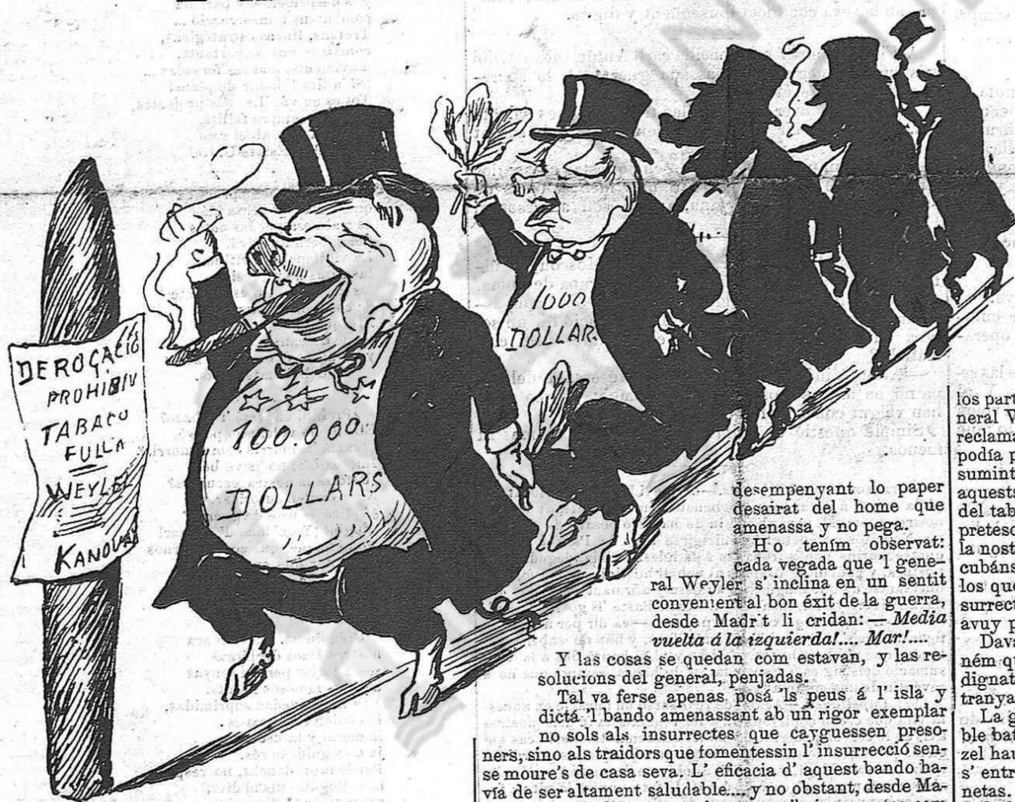
Ens posan en grans apuros y s' fuman los millors puros.