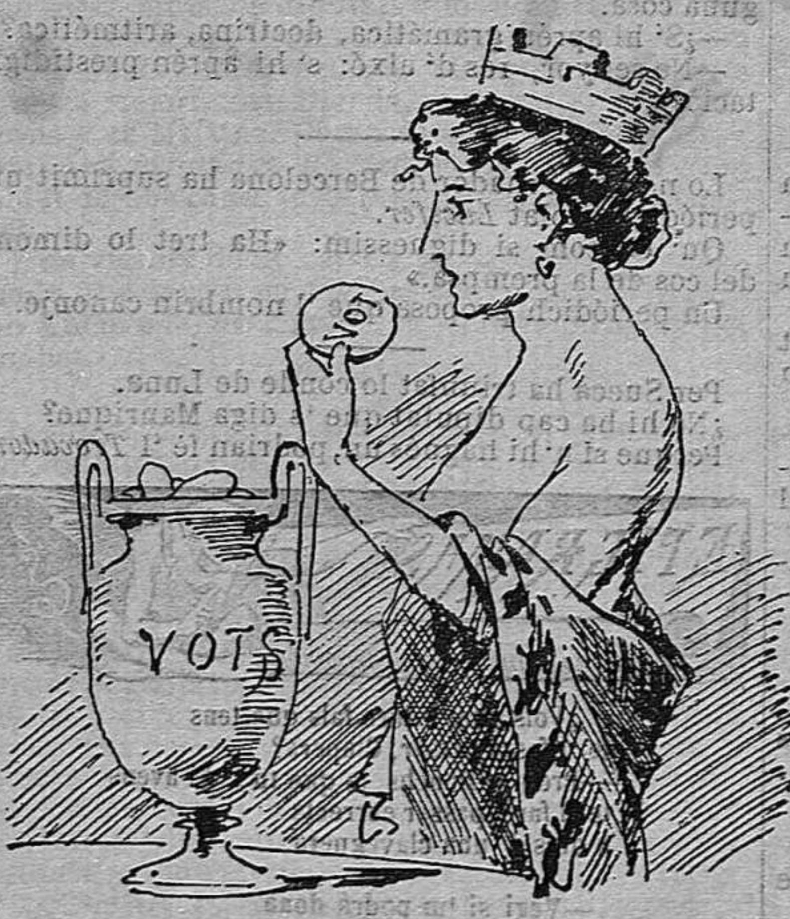
—Me sembra qu' ha passat alguna moneda que...