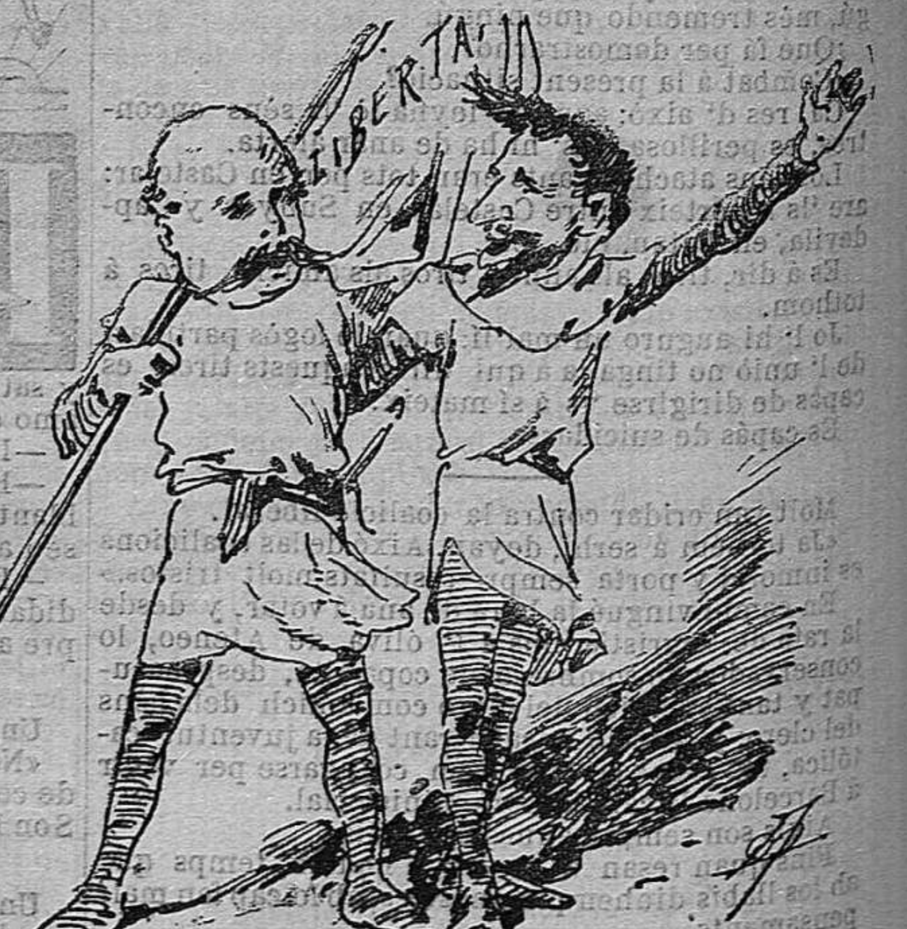
—Veyam si cantarán gaire temps junts sense desafinar.