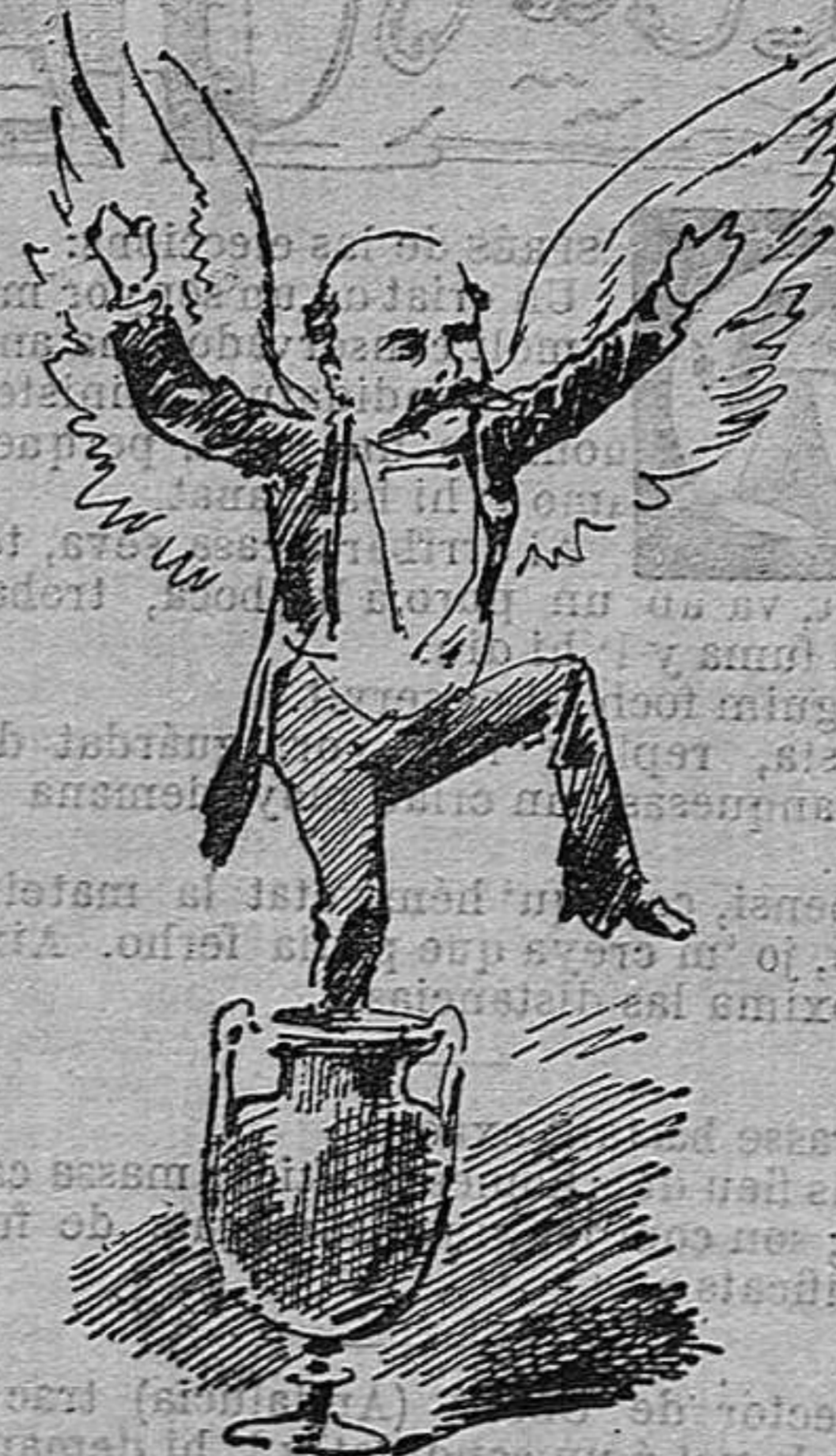
—Que siga la enhorabona.