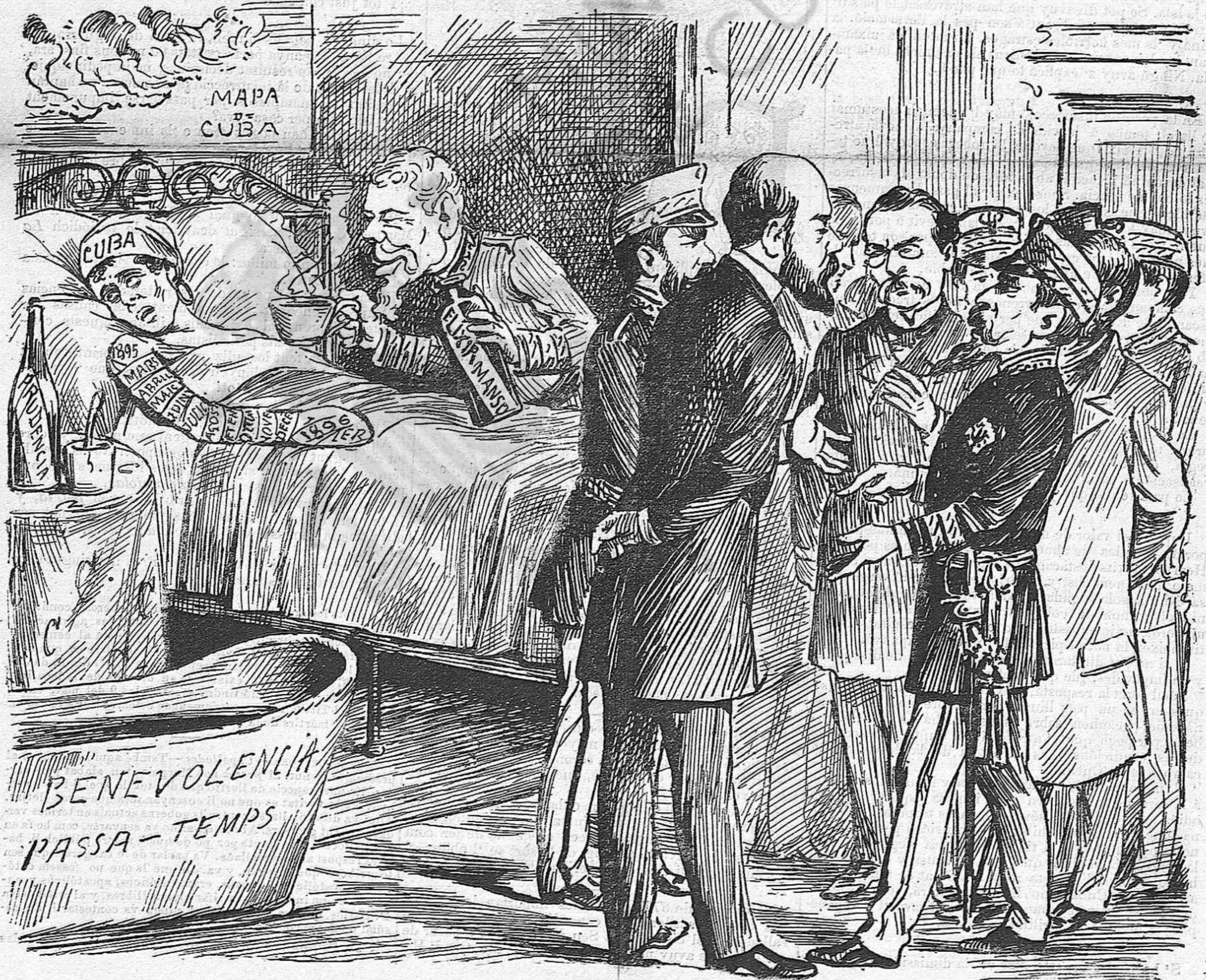
—La enfermetat es molt grave, y no n' hi ha prou ab cambiar de medicina, també s' ha de cambiar de metje.