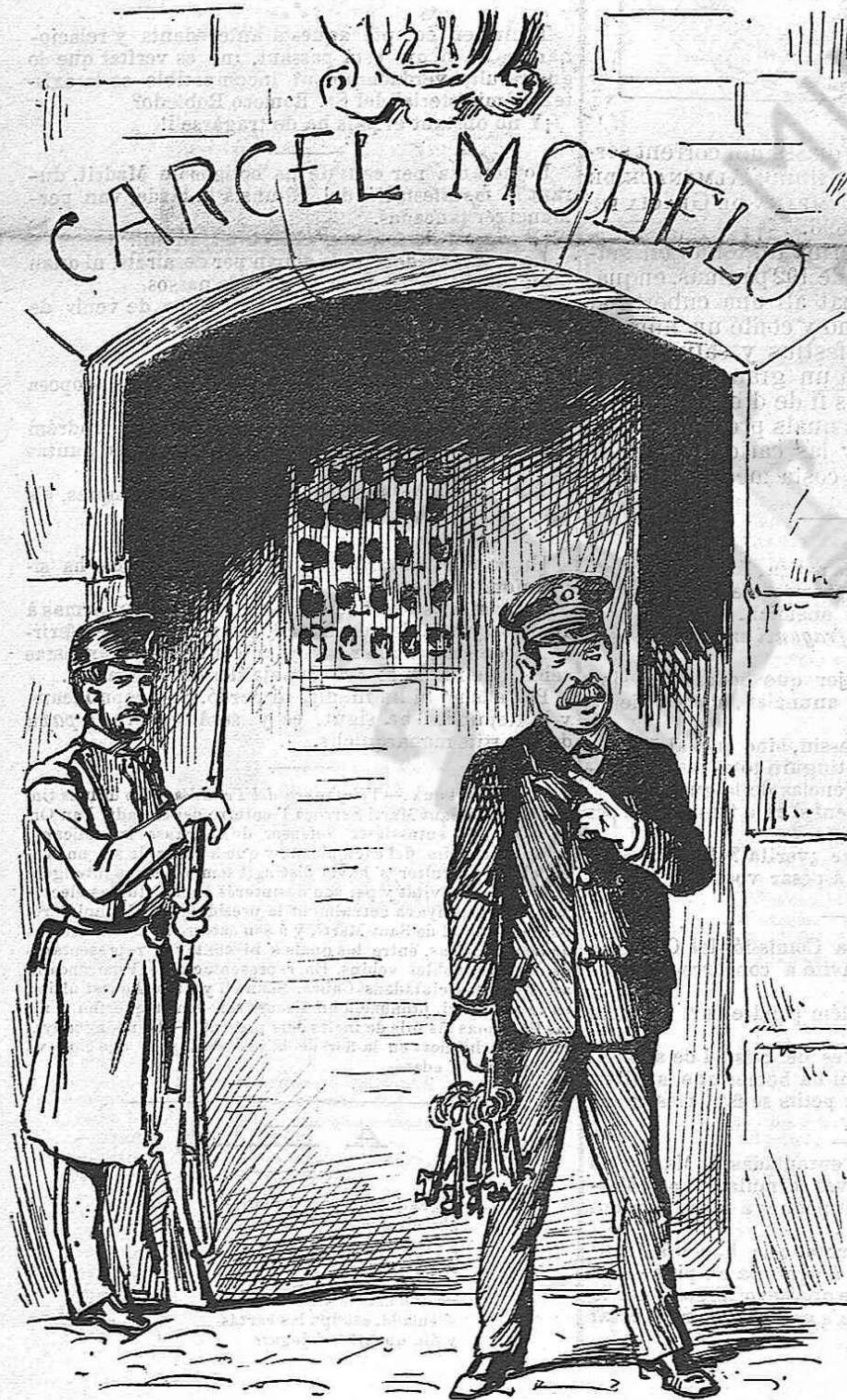
—Moltas protestas, molta manifestació, molta saragata; pero lo qu' es de concejal no veig pas que 'n portin cap á n' aquesta casa.