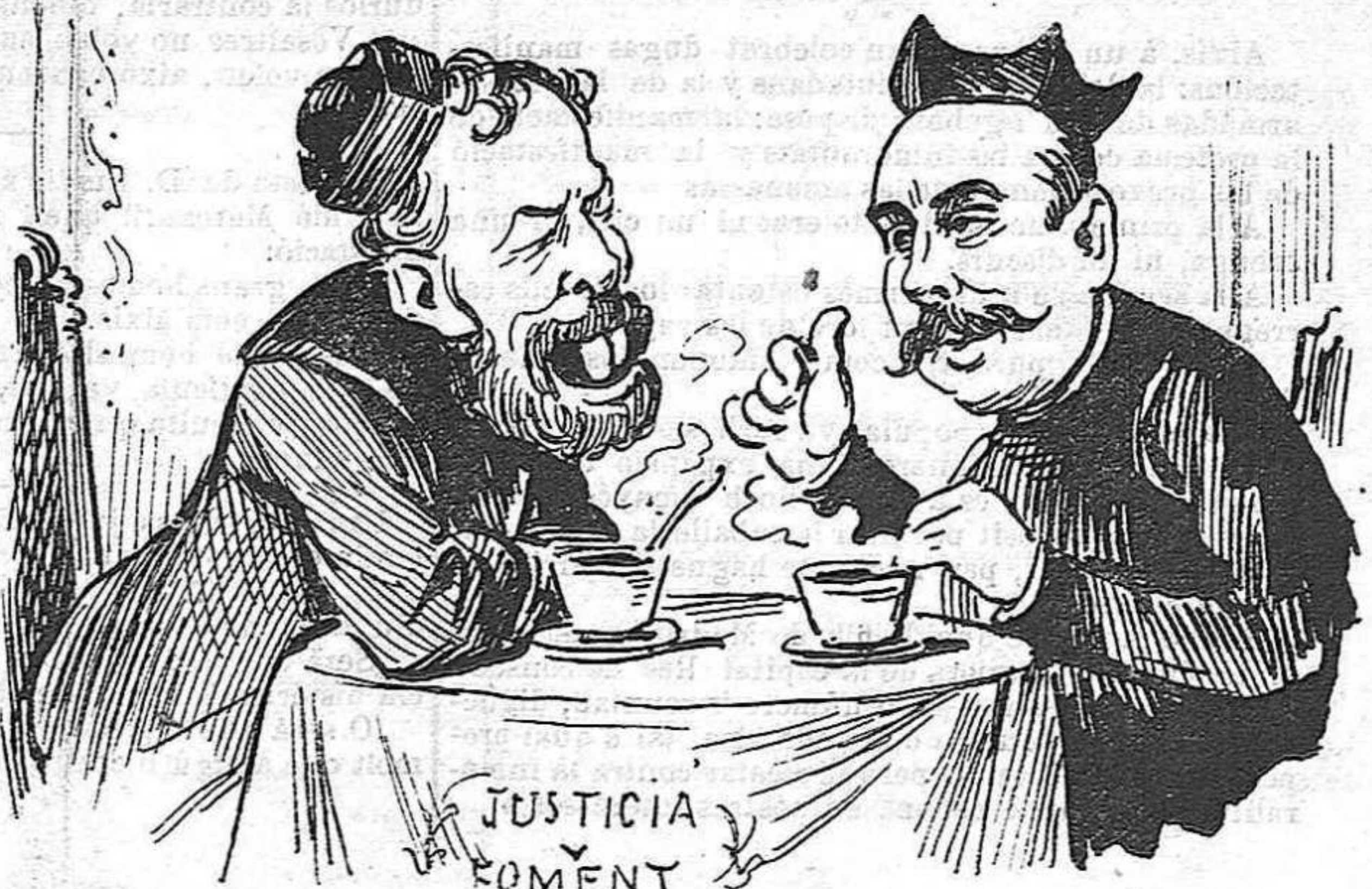
Y als socios de la barra encara menos que á D. Antón.