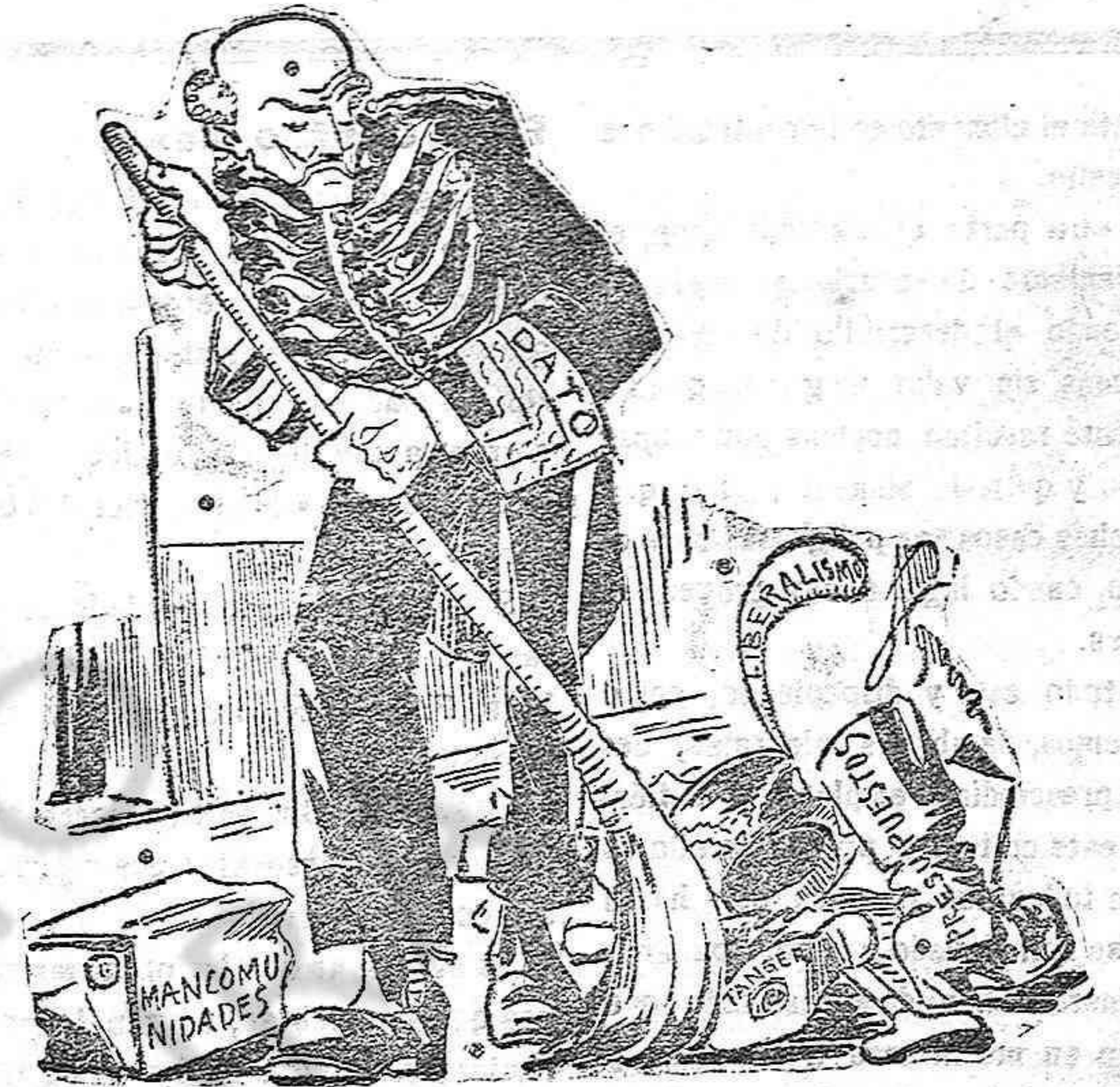
—Fuera de aquí inmundos residuos.

ma el simpático pare Farré, ilustra ja suita que durant aquets dies ha vingut fent exercicis a les obreres de la fábrica que assisteixen a les escoles nocturnes del collegi de les Germanes Carmelites.