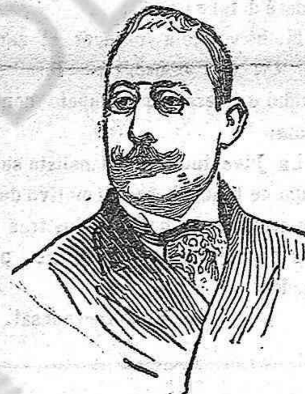
Sr. Conde de Villa, designado para el cargo de embajador de España en el Vaticano.