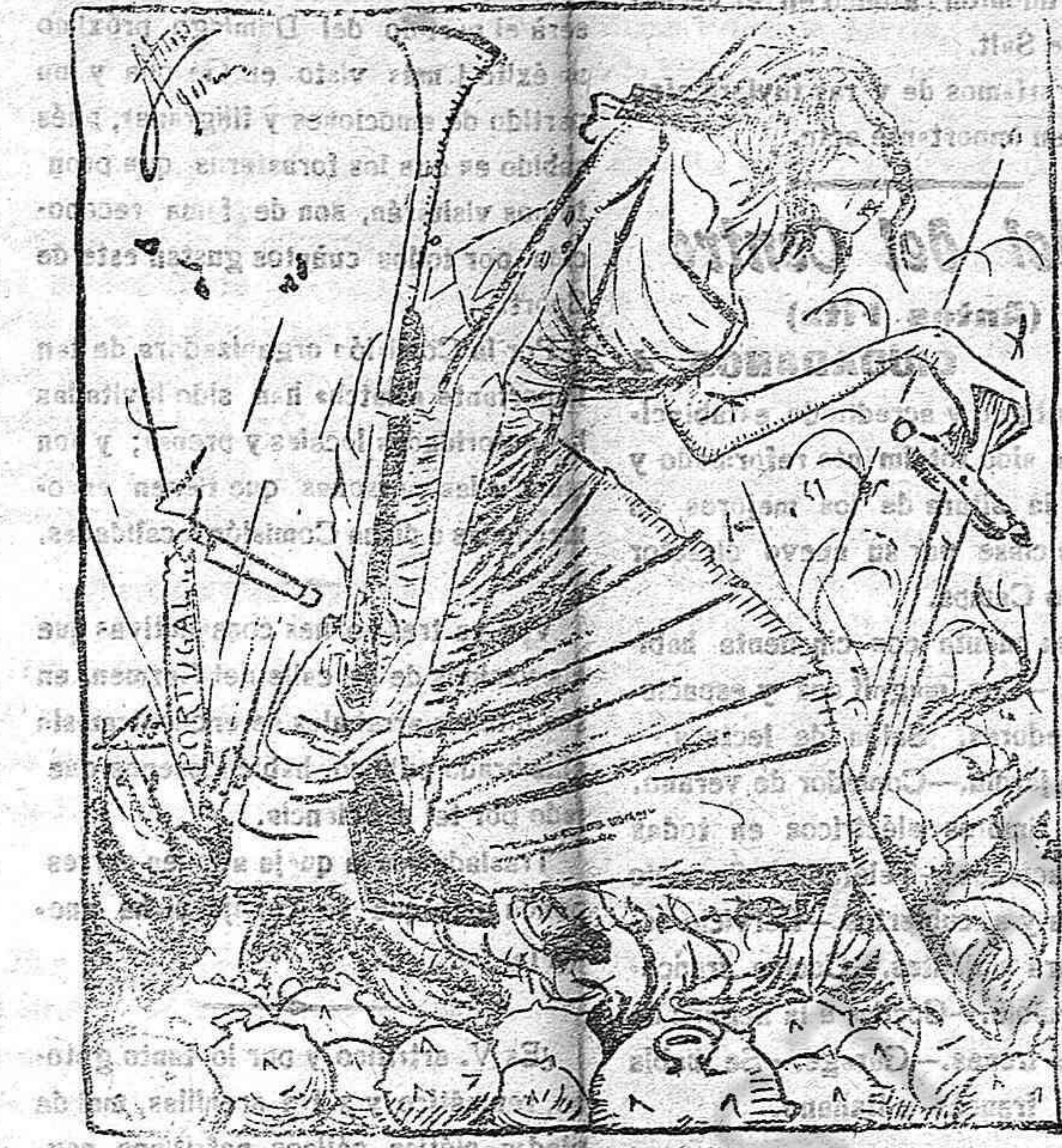
Y luego dirán que no somos dignos de pisar sobre alfombras. (Véase la clase)