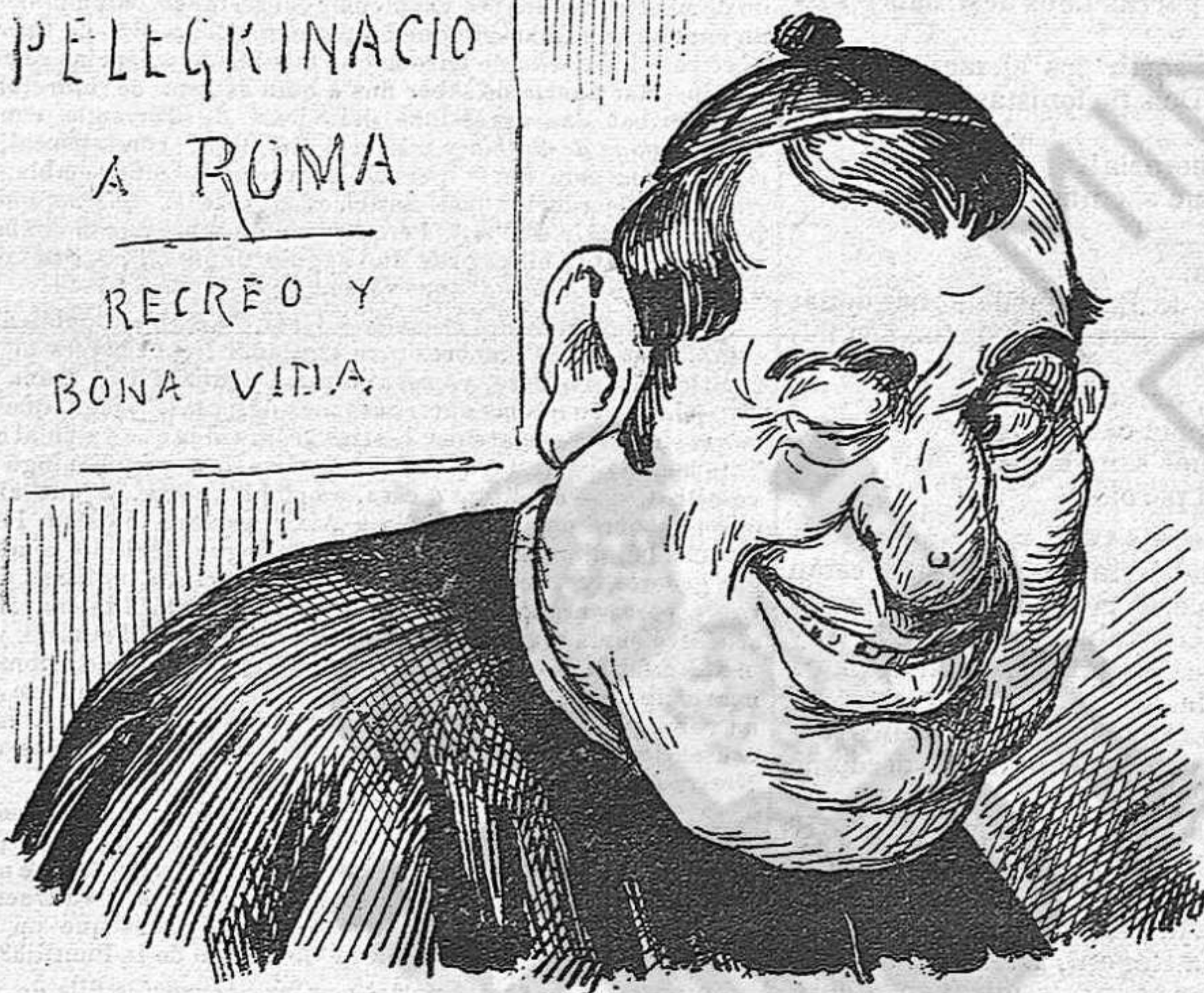
Los que menjarán macarrons

Reunidas avuy, es molt probable que avants que 'l govern, se morin de fàstich los que tractan de cridarlo á comptes.