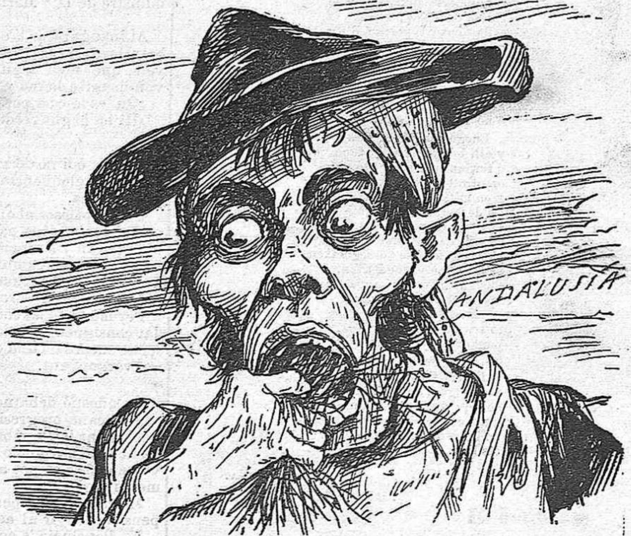
Los que menjan herbas

Pero porque 'ls ecos dels diputats republicans despertessin la conciencia pública, sería menester que s' presentessin units y compactes, formulant tots junts una sola afirmació republicana positiva, práctica y factible, davant de