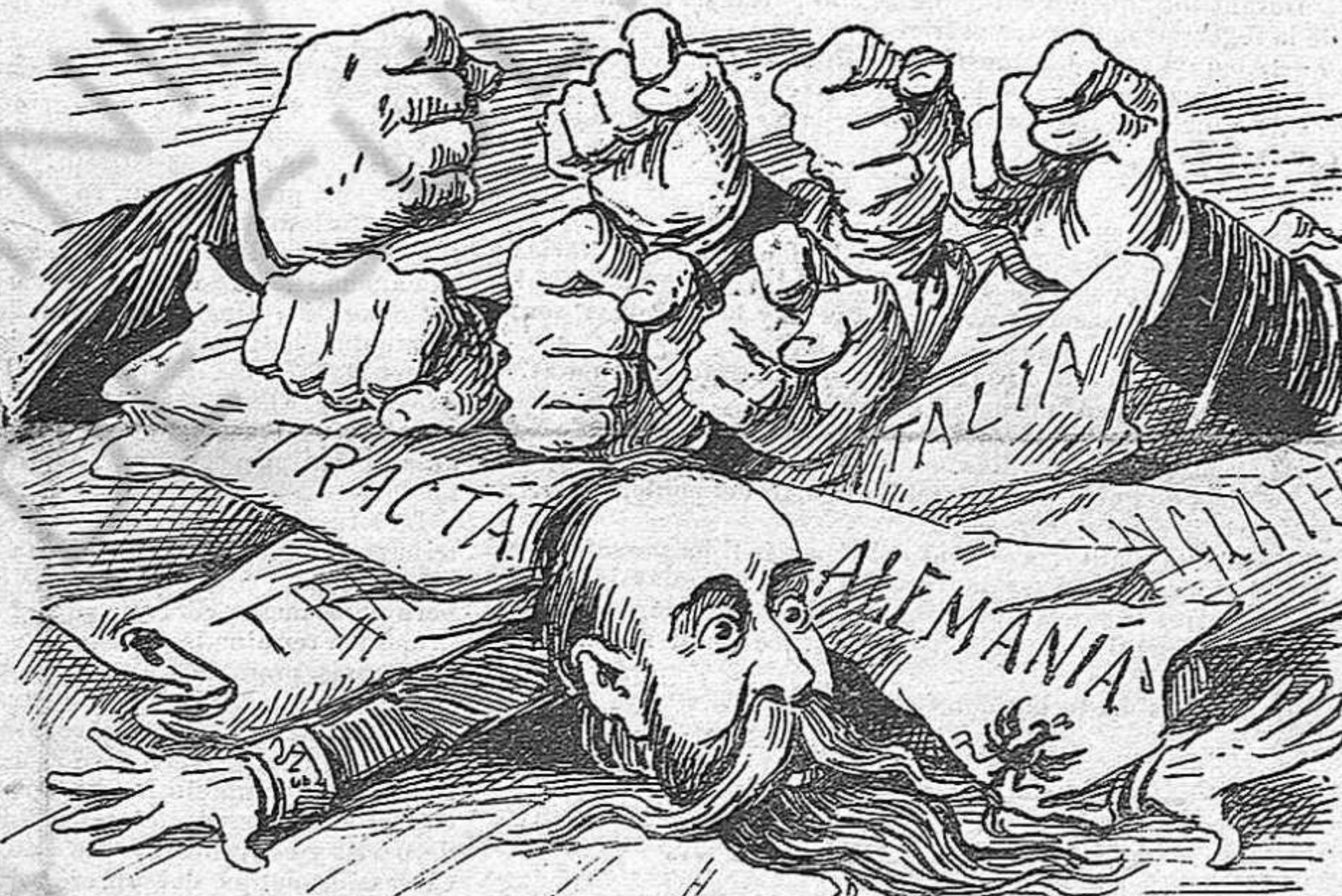
UNA AIXAFADA.—Així es lo que haurien de fer las Corts ab los tractats y 'ls tractadors.

saber que será més roig si las cubertas de aquest llibre ó las galtas dels espanyols.