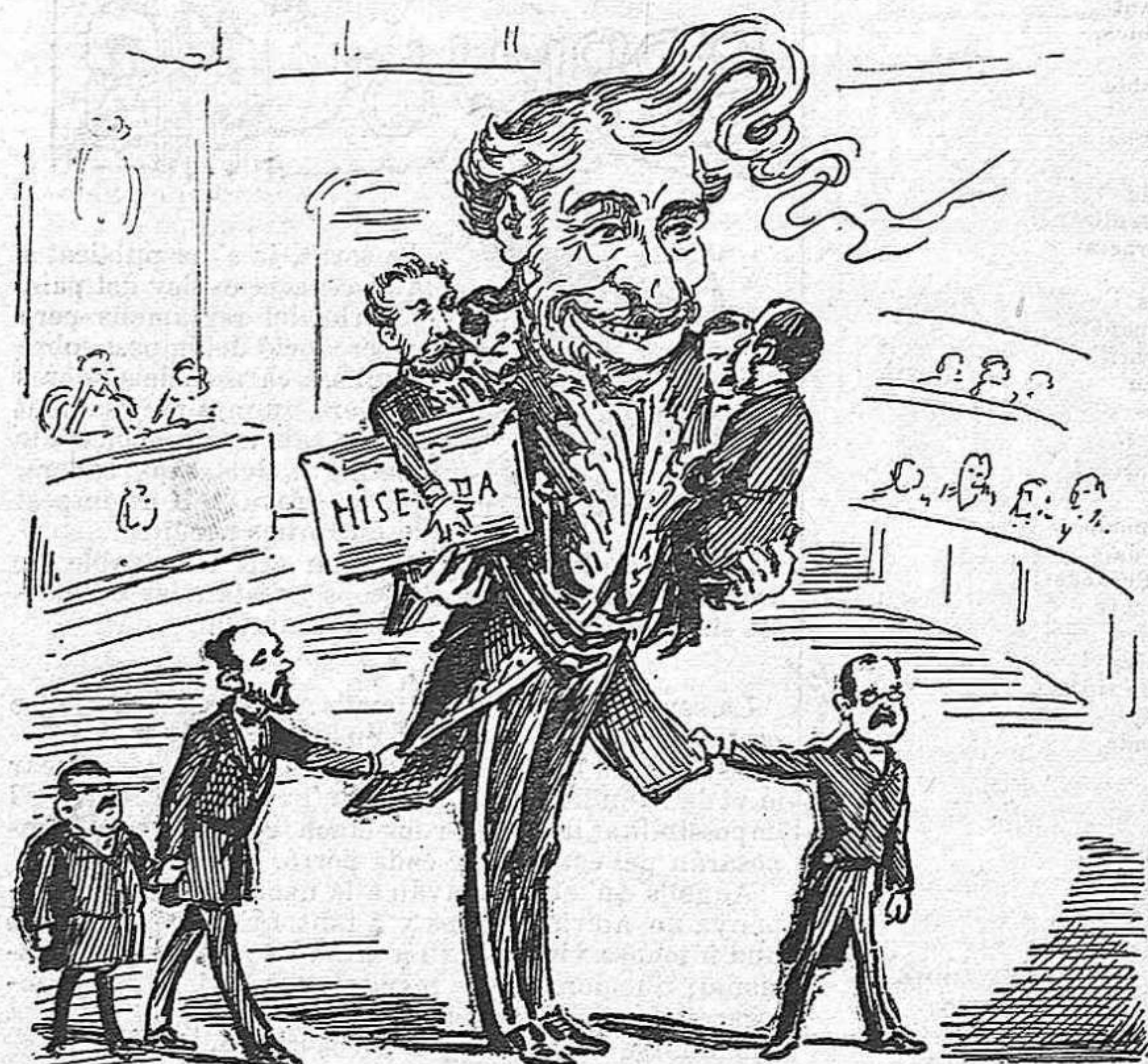
OBERTURA DE CORTS.—D. Práxedes se presenta davant dels representants del país rodejat de la família.