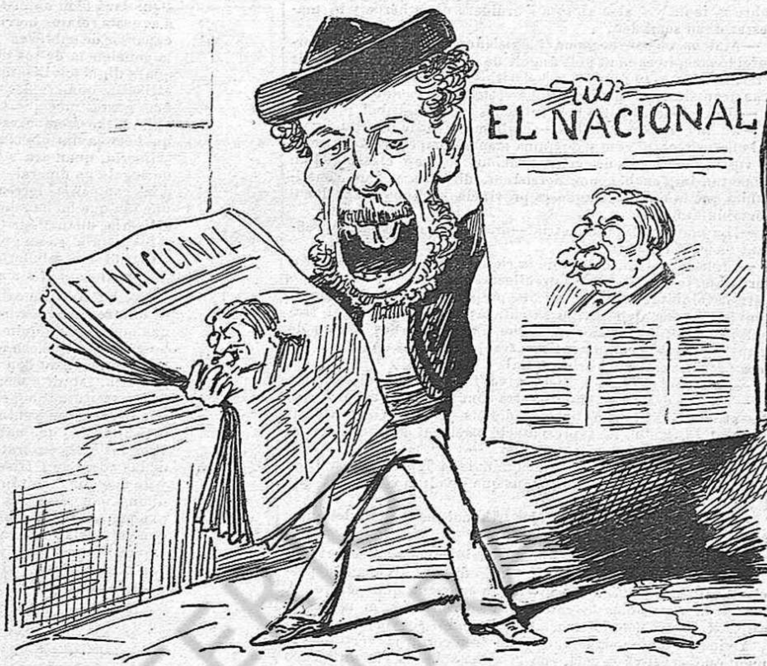
LO NOU DIARI CONSERVADOR.—Se titula El Nacional ; però a dreta lley hauria de titularse El Vermouth .