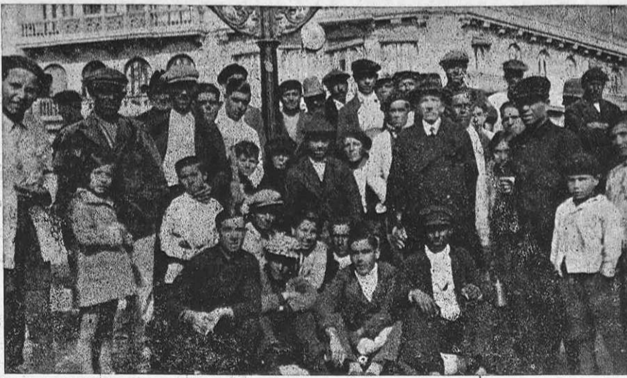
El General Labrador fotografiado con un grupo en las calles de Alicante, después de haber realizado una fructífera labor de repartición de tratados evangélicos y una activa campaña de proselitismo, su misión predilecta.