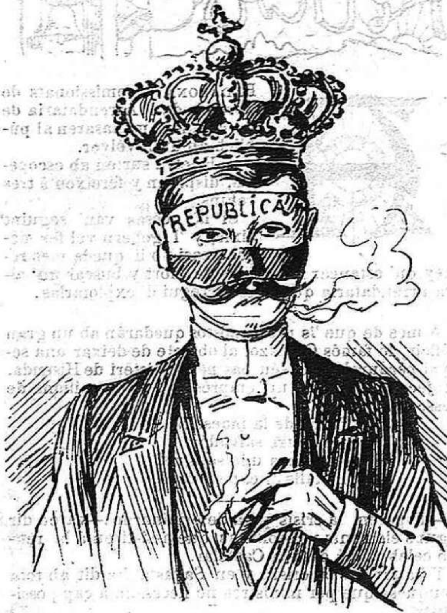
DISFRESSA DEL DIA Aquests han volgut que tot l' any fos Carnestoltas.