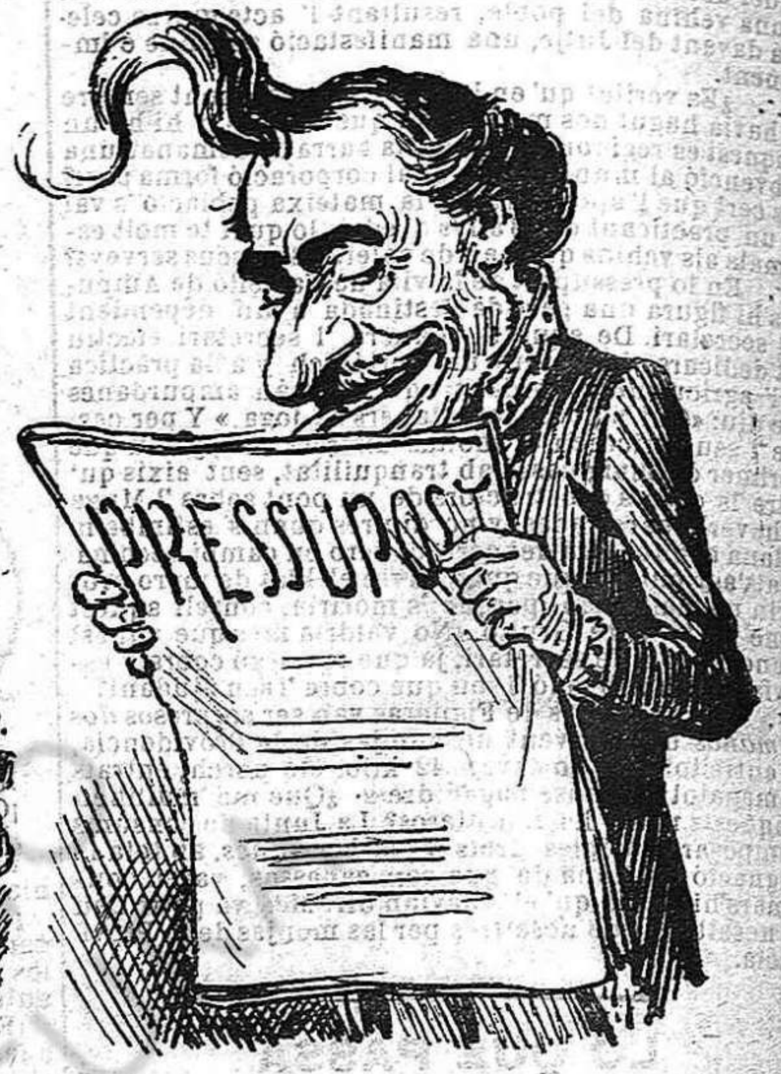
LA SITUACIÓ ACTUAL —Lo nostre ideal es lo pressupost de la pau... sense disminuir los gastos de la guerra.

gadas preferiria tenirlo de cara al davant meu, que al meu costat.