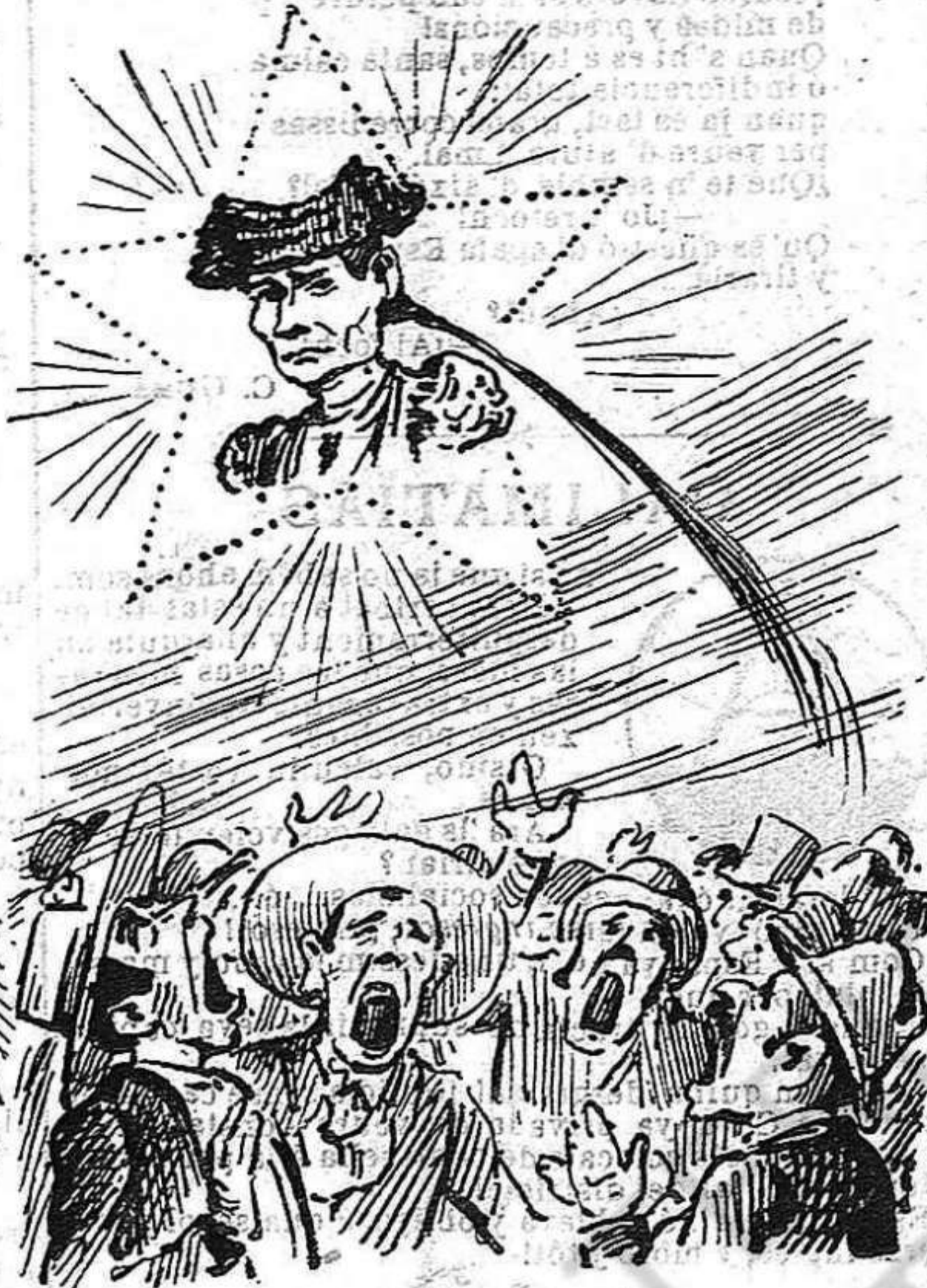
L' ASTRE D' AVUY —¡No te la cuertes!