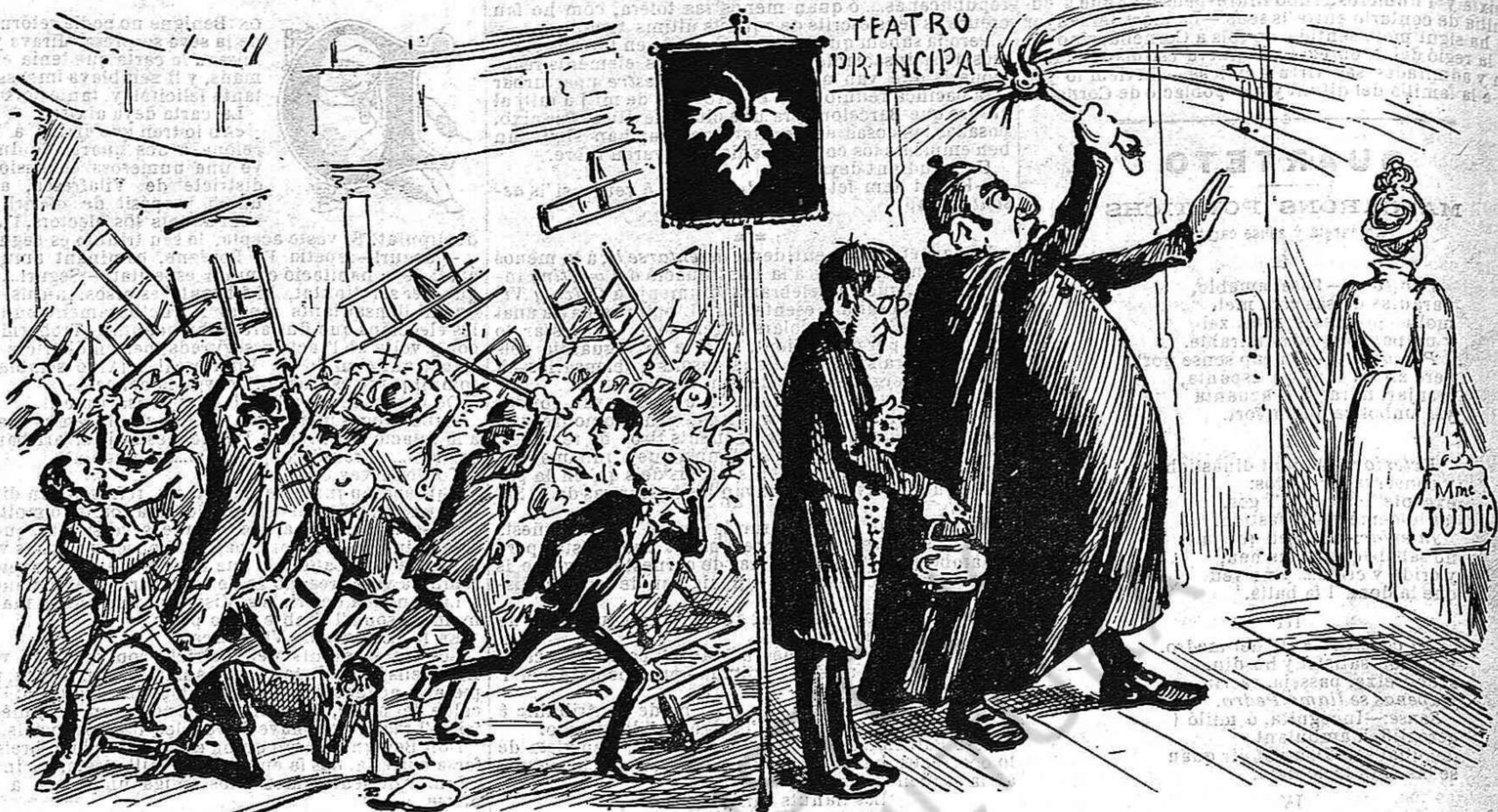
Als carlins que van anar al meeting à armar gran bulla, per curarse 'ls trenchs del cap s' hi poden posà una fulla.