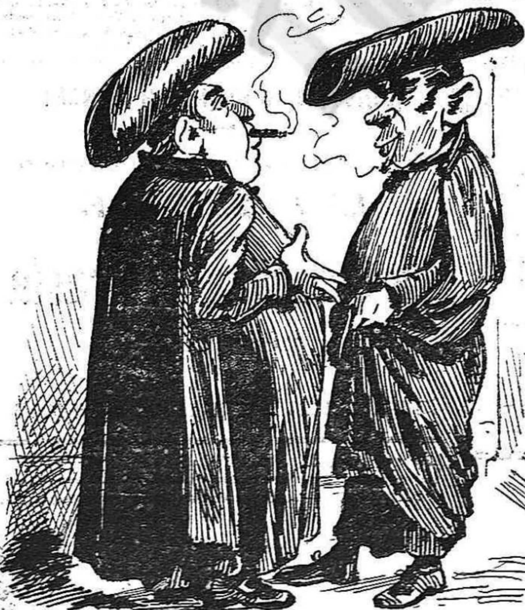
UN COMENTARI. — Mossén Magí, ja 's veu clá, si un dia mana no podrém pipá.