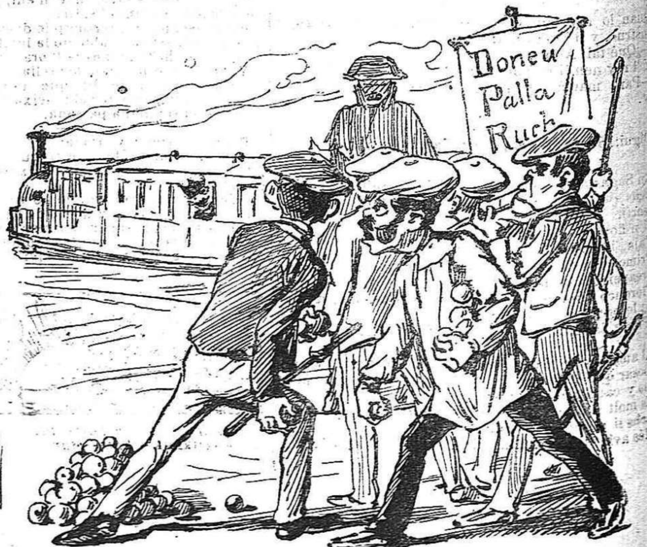
LA MARXA. — ¡Se 'ns escapa, malehit siga! y mireu, desde 'l tren ens fa la figa!