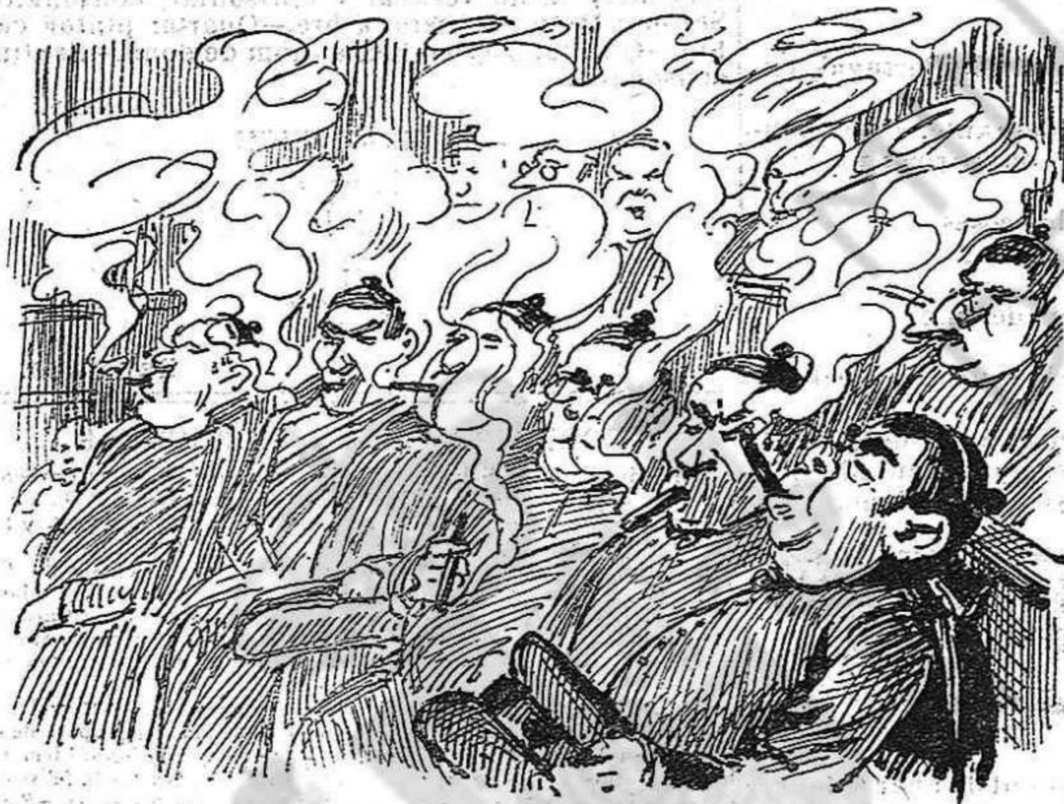
EN LO SALÓ DE CONGRESSOS. Lo concurs era allí inmezz y 'l clero 's dedicava á ferli encens!