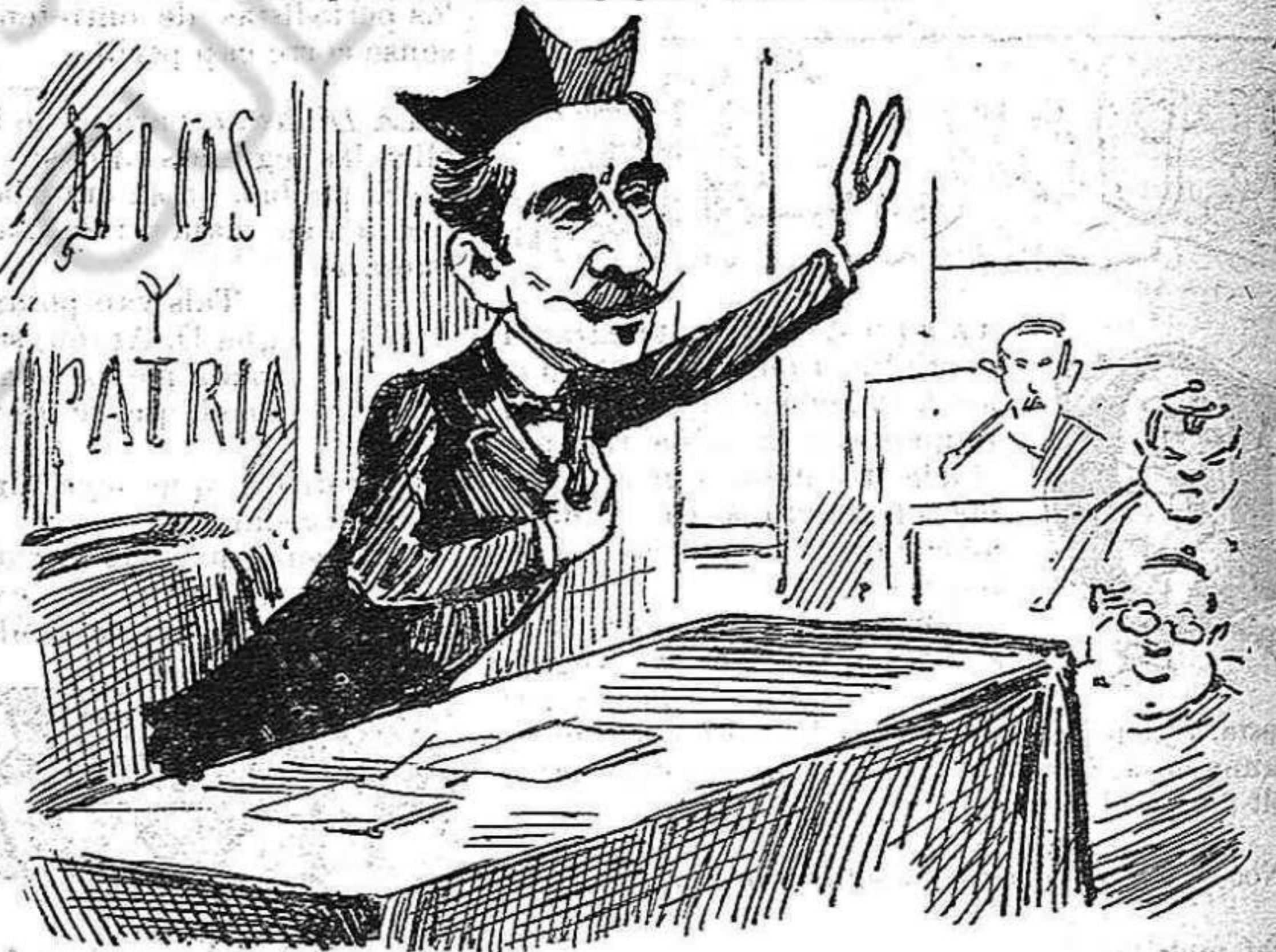
LO DISCURS. «Yo declaro aqui ante el clero que no seré ministro ni estanquero.»