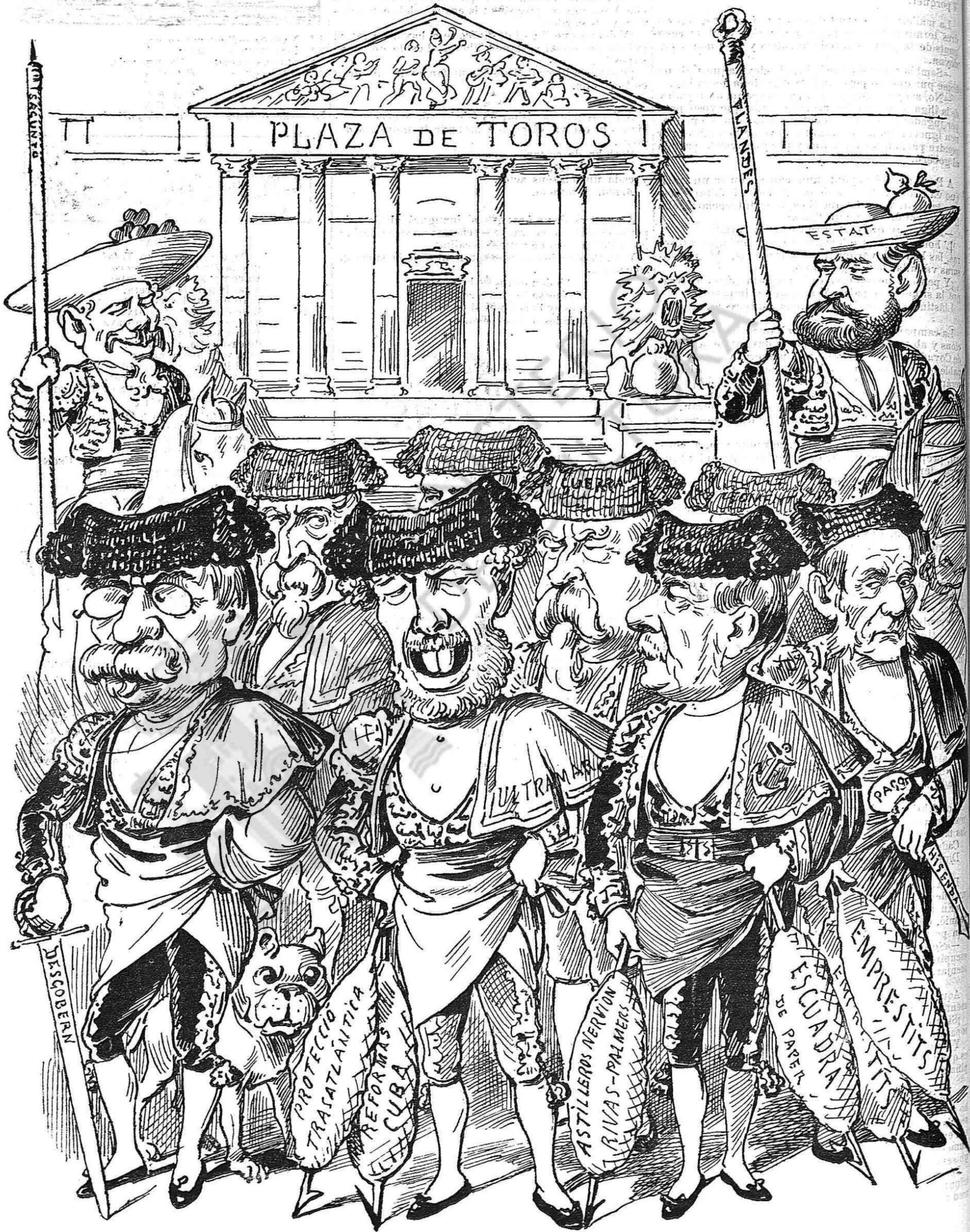
¡Gent barbiana, gent flamenca sempre distreta y felís!