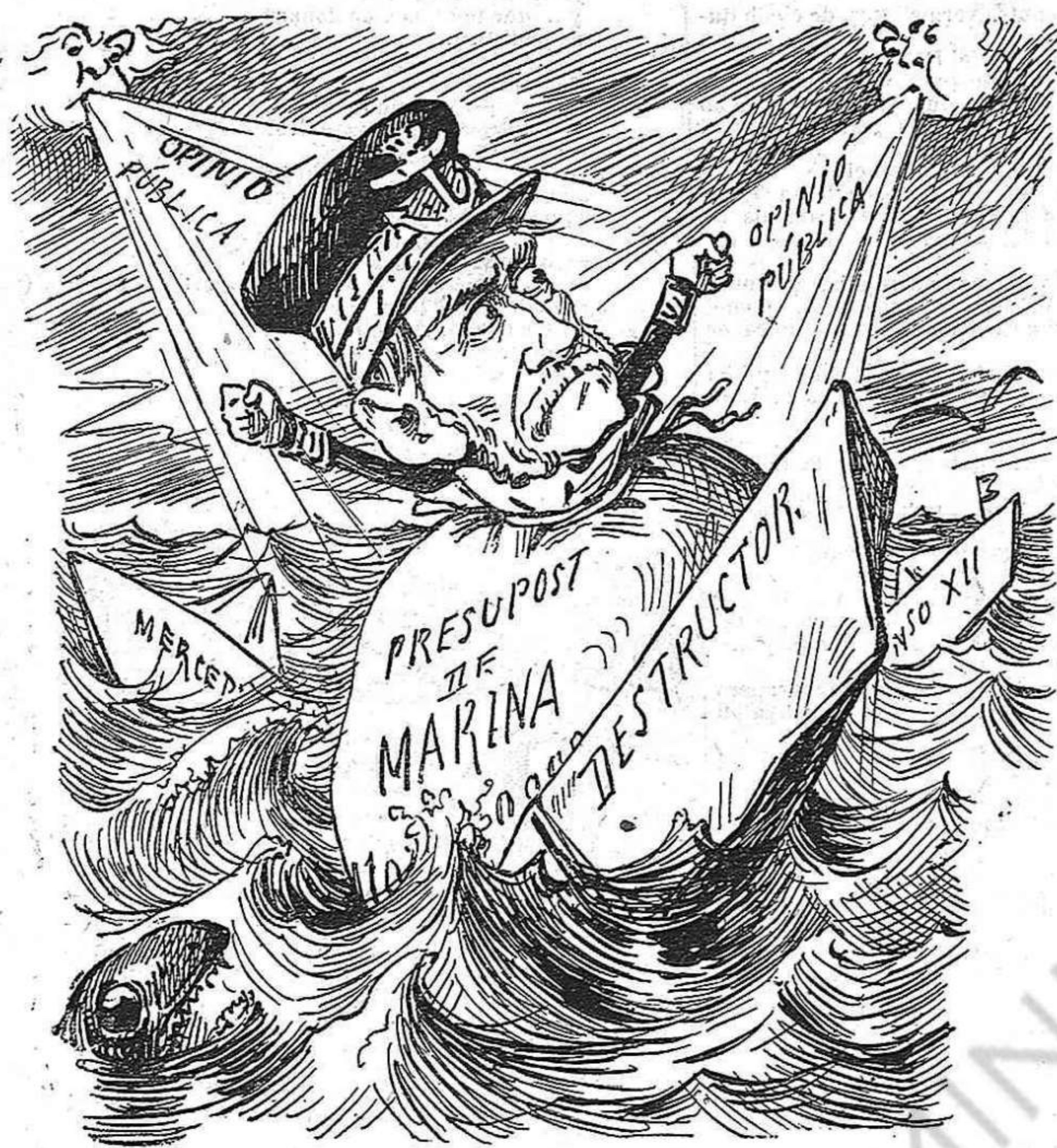
Home a l'aygua.