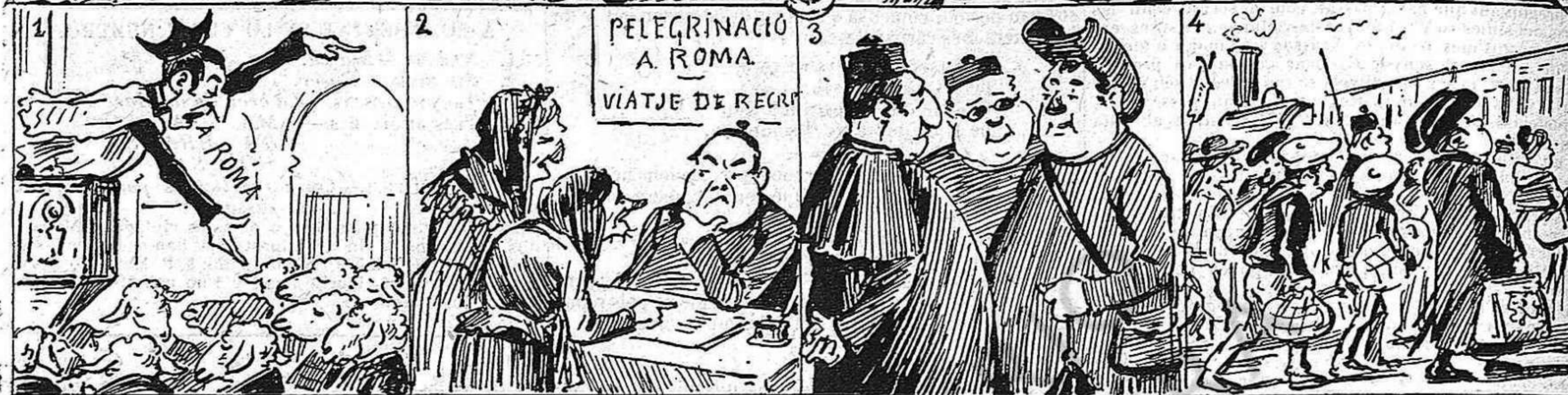
—Dalt dels cubells enfilats —¡A Roma!—ls pastors digueren, dirigintse als seus remats.