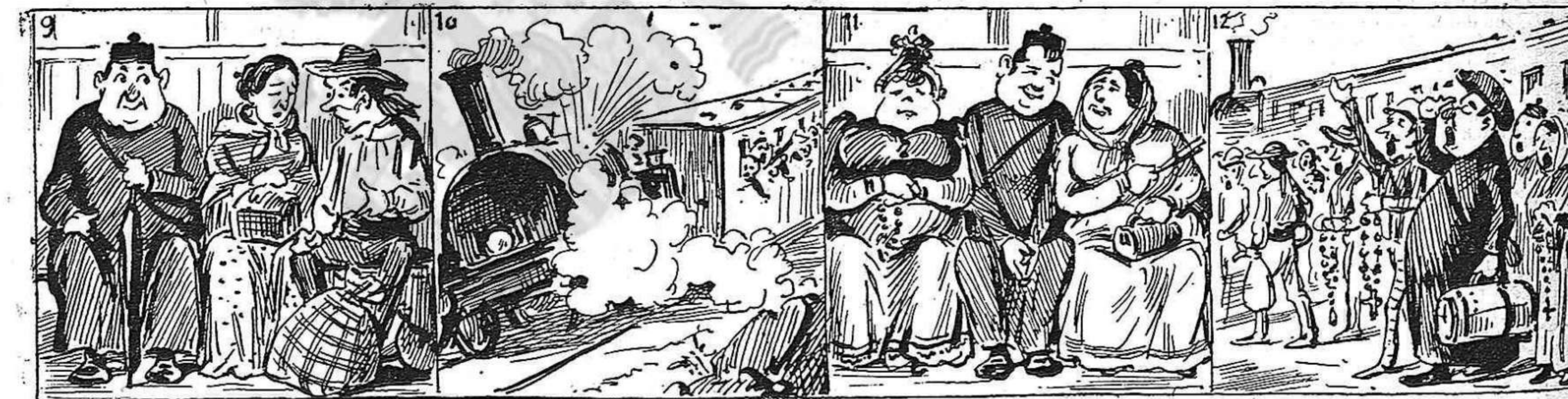
—Manela ¿per qué has xisclat quan passavam aquest túnel? —Perque algú... m' ha pessigat.