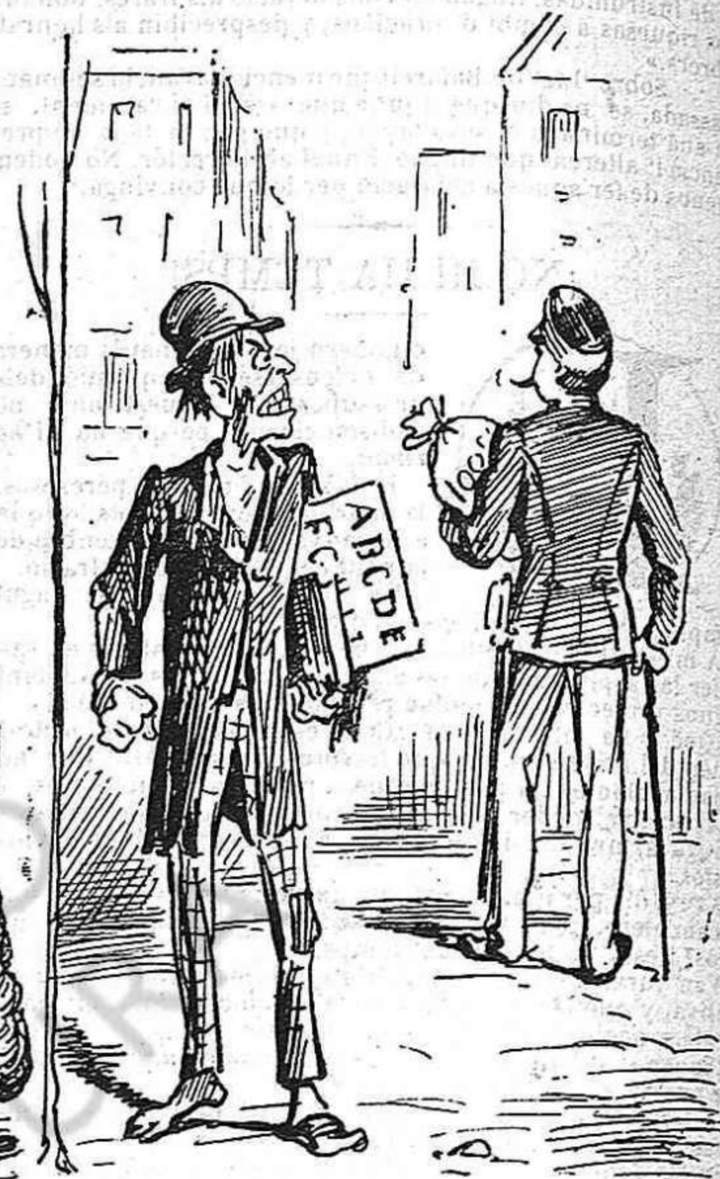
Aixís vá la pobra Espanya: als militars, augment de sou; als mestres d' estudi, augment de gana.

ni en tenirlo negre: lo més elegant y lo de més bon tó es tenirlo gris.