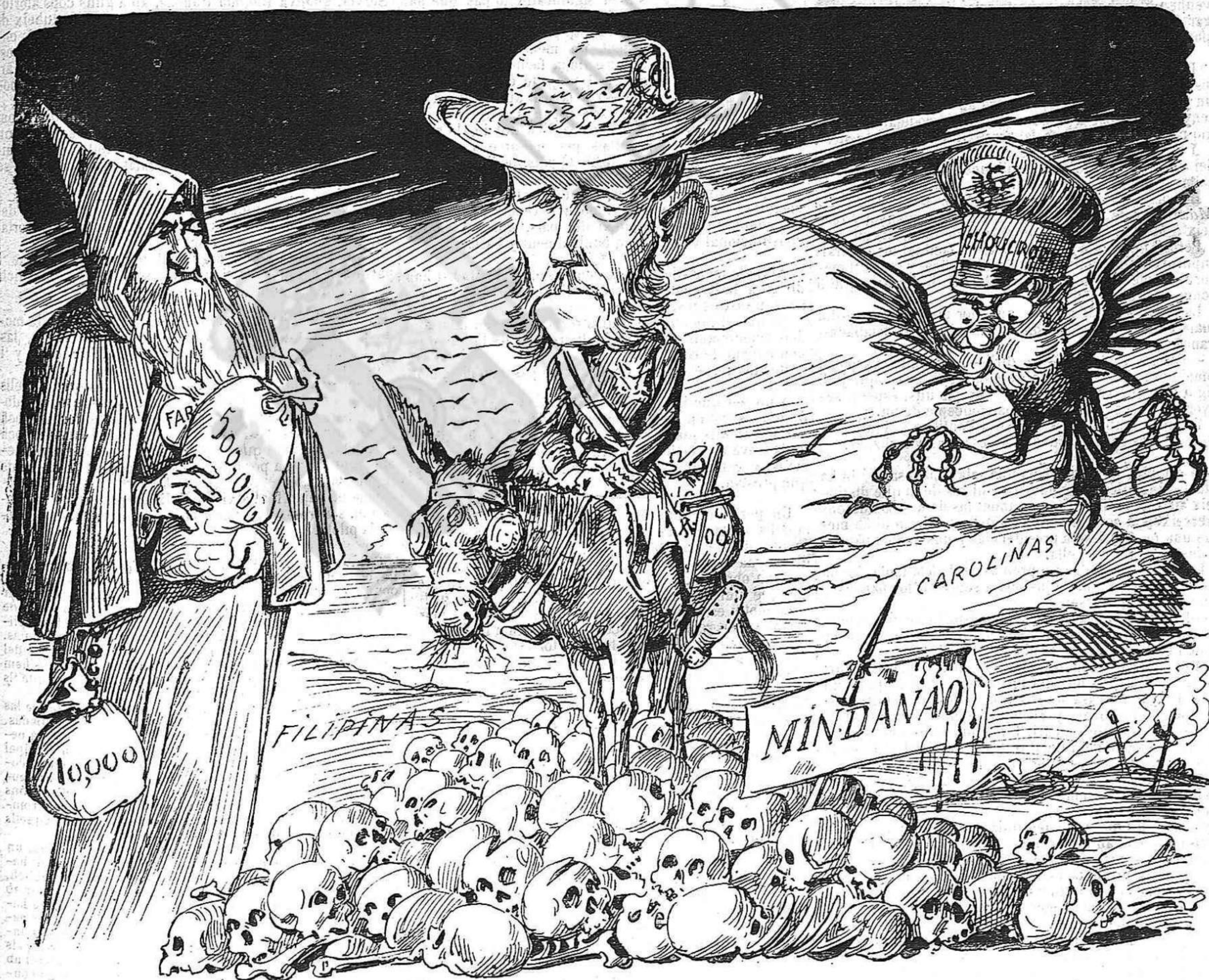
Frares que arreplegan quartos, generals que segan vidas