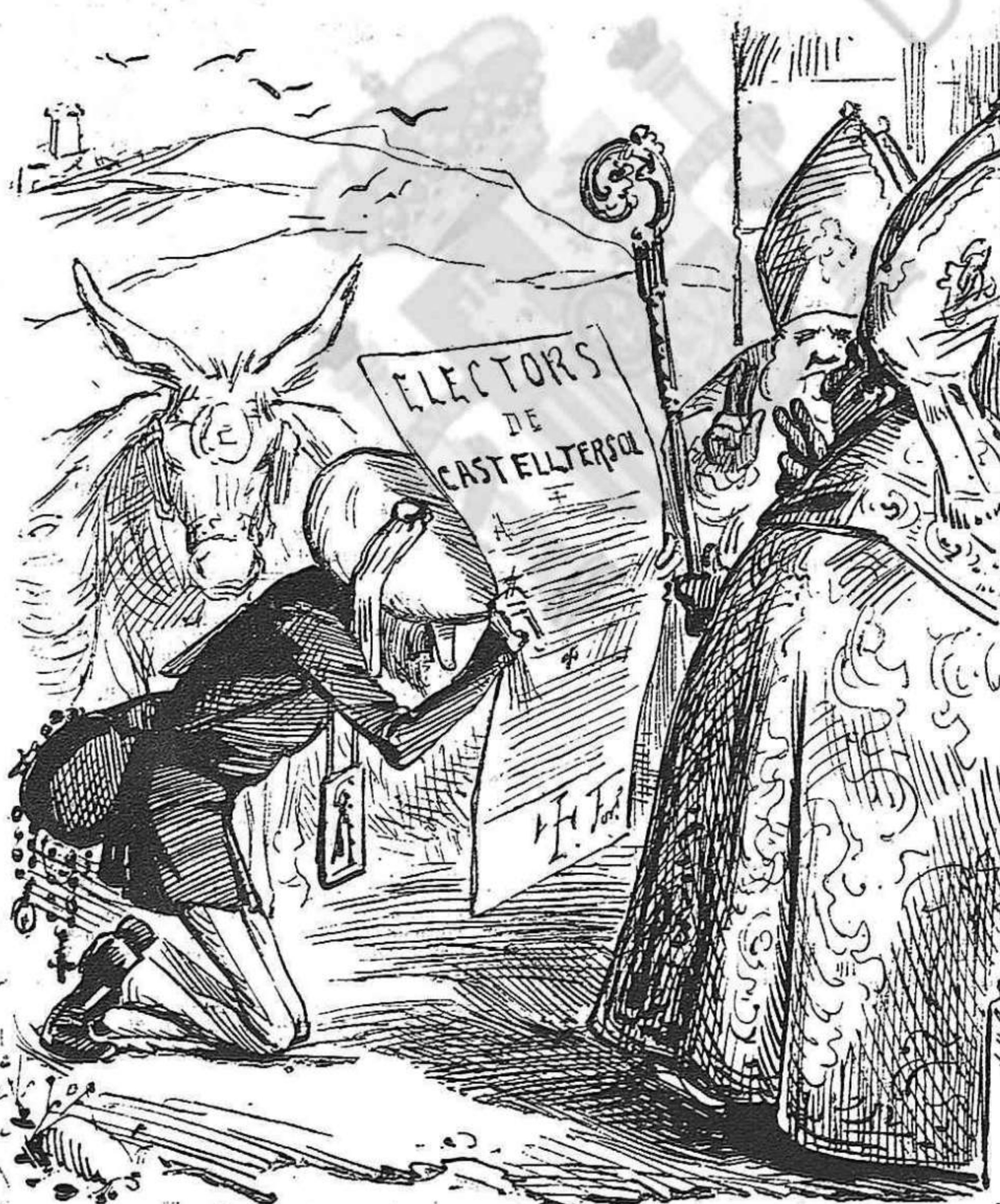
PER HIPOCRESSIA.—Fentse benehir lo manifest.