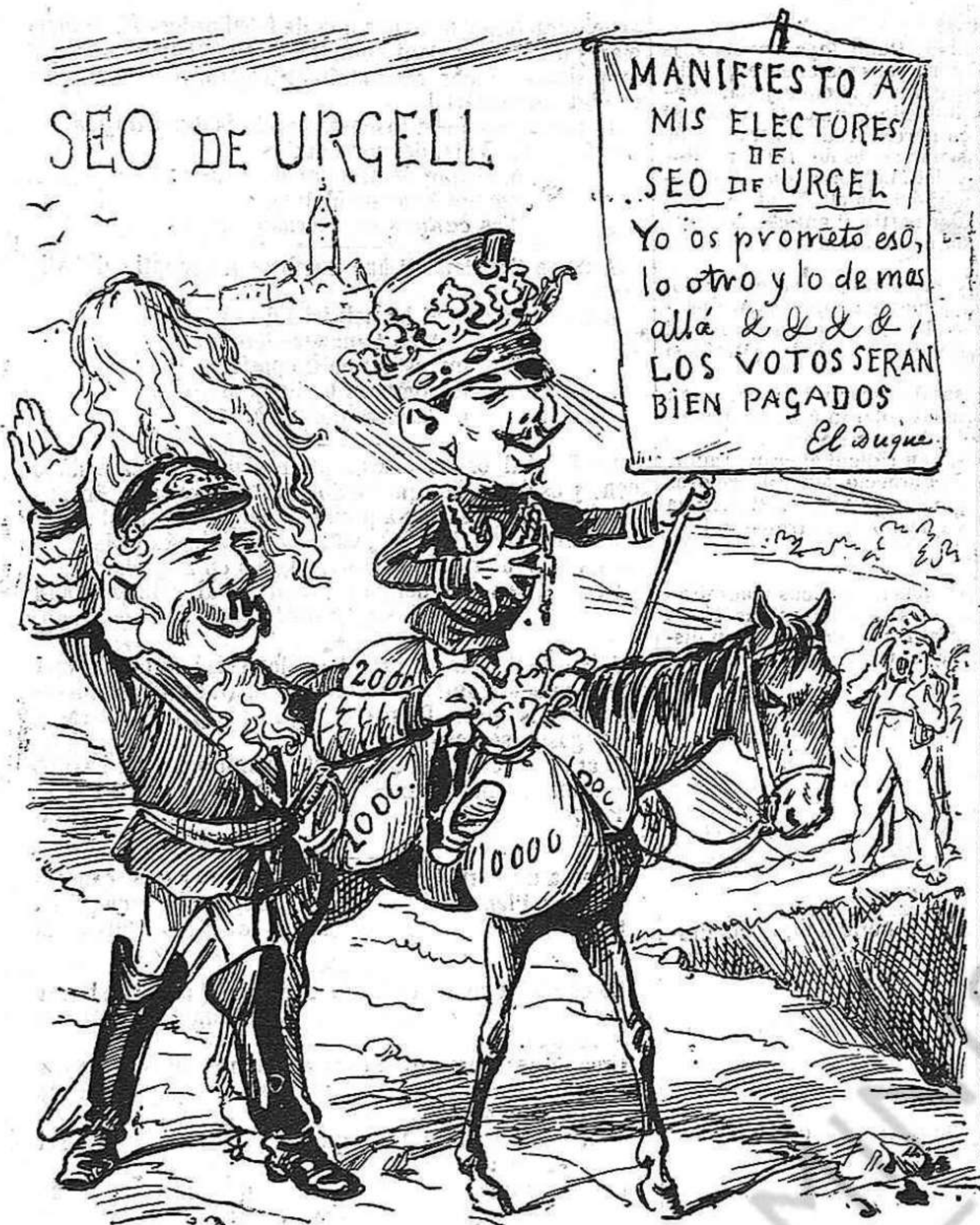
PER CORASSONADAS.—Empleant lo cor y de passada la butxaca.