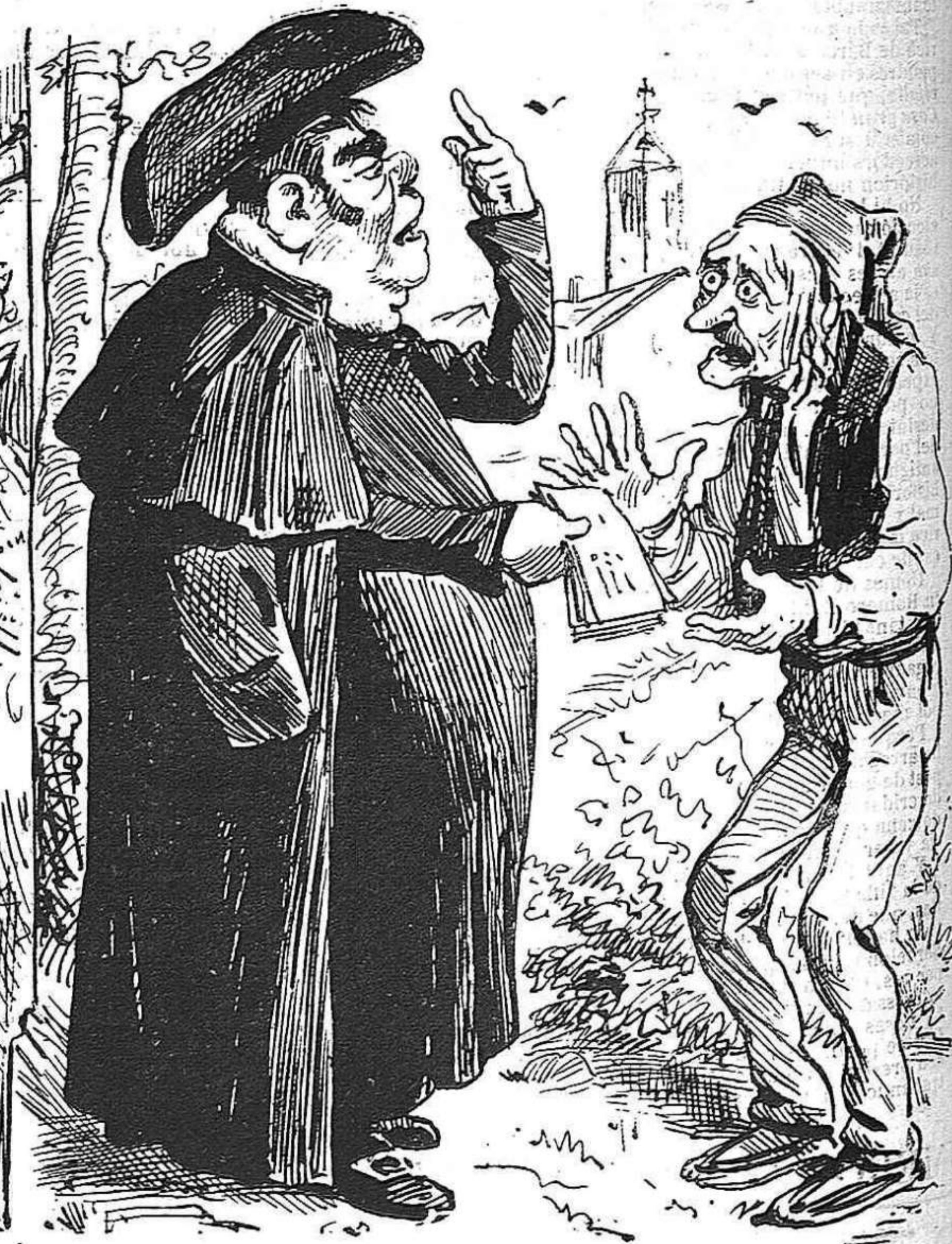
PER TERROR.—Si no votéu aquesta candidatura a vos y tots los de casa vostra, ne hi haurà terra sagrada. ¡Quan moriren al canyet!